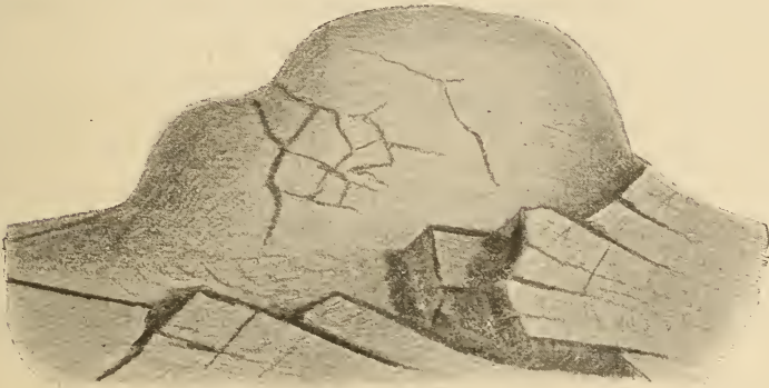
Fig. 1. Kugelig abgesonderter Melaphyr, umhüllt von schaligen Wengener Schichten. Links des Wegs zur Selaus-Alp.

Der ältere Melaphyr verhält sich an der Westseite der Seiser Alp tektonisch wie eine Schicht und hat mit den Mendel- und Buchensteiner Kalken im Liegenden, der Wengen-Cassianer Serie im Hangenden spätere Bewegungen mitgemacht, es ist aber auch gerade im Gebiete des Cipit- und des Frombachs unzweifelhaft, daß seine Oberfläche ursprüngliche Ungleichheiten besaß, so daß von vornherein die Wengener Schichten, die ihn überkleiden, ein verschiedenes Niveau erhielten.