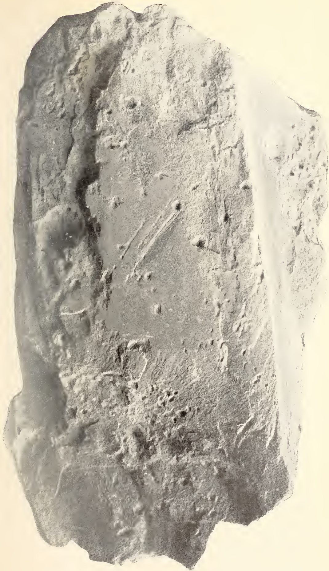
F. Frech: Ueber das Klima der geologischen Perioden.