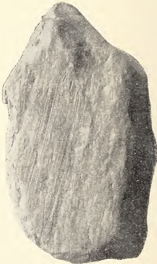
Fig. 1. Geschiebe aus Schacht I auf Zeche Preußen II, 360 m unter Tage.

sammenstellung der Tatsachen beantwortet werden, wie ich sie in der Lethaea zu geben versucht habe. Nun ist verschiedentlich aus der Zusammenstellung der Lethaea palaeozoica genau das Gegenteil von dem herausgelesen worden, was darin steht; so behauptet neuerdings ARLDT in einem