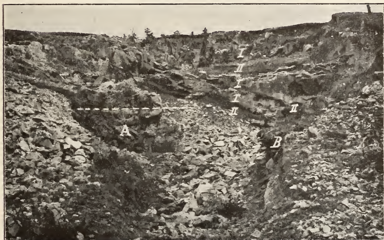
Fig. 2. Fundort diluvialer Fauna auf dem Děkaný vrch bei Wolin 1916. Ansicht von Norden.

In letzter Zeit wurden außer Resten, die ich weiter erwähne, meistens Zähne und verschiedene größere und kleinere Pferdeknöchel, ferner ein Unterkiefer des Renntiers mit allen