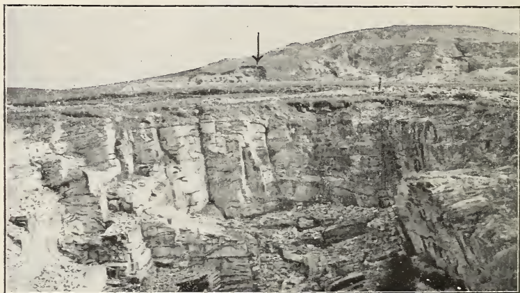
Fig. 1. Neuer Fundort diluvialer Fauna bei Zechovic (↙). Ansicht von Norden.

Die diluviale, ungleich mächtige, zur Westseite sich einigermaßen auskeilende Ablagerung ruht auf dem geschichteten, mit Biotitgranit durchsetzten Kalkstein, welcher auf der Westseite einen scharfen, ca. 2.5 m hohen Vorsprung bildet.