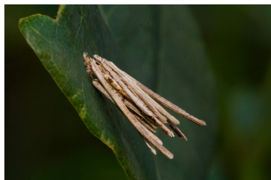
Abb. 2: Raupensack von Psyche casta Pallas, 1767, einem Sackträger.

Dass die Larven von Köcherfliegen Köcher bauen und damit durch die Unterwasserwelt ziehen, ist weithin bekannt.