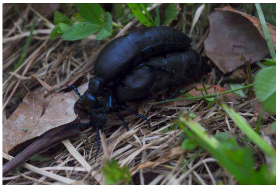
Abb. 10: Kopula von Meloe proscarabaeus .

Eine genauere Nachschau ergab wirklich nach kurzer Nachsuche einige Dutzend Ölkäfer, einige davon in Kopula; ein Bild, das man in Salzburg nicht so schnell wieder finden wird. Doch wo Ölkäfer sind, können Bienen nicht weit sein. Sie entwickeln sich nämlich über eine komplizierte Hypermetamorphose in Nestern erdbewohnender Bienenarten.