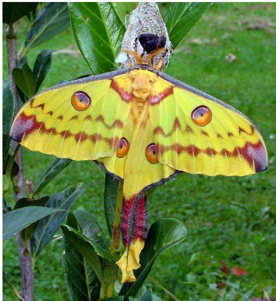
Abb. 20: Das Weibchen hat eine größere Flügelspannweite, dafür aber kürzere Hinterflügel-schwänzchen.

penstadium an Unterkühlung sterben. Je wärmer umso besser und schneller verläuft die Zucht.