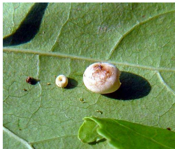
Abb. 21: Das Ei des Kometenfalters (rechts) ist gegenüber einem Apollofalter-Ei (links) riesig.

Groß ist die Anspannung für jeden Schmetterlingszüchter, wenn nun die Falter schlüpfen, meist um Mitternacht, setzen sich die Weibchen mit Vorliebe direkt auf den Kokon. Die Männchen sind aktiver und können herum krabbeln um irgendwo einen guten Halt zu suchen. Zu diesem Zweck ideal ist entweder ein großräumiger Flugkasten oder ein Fliegengitter, das man rund um den Kokon befestigt.