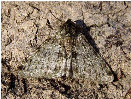
Abb. 25: Kaum Konkurrenten im Reich der Schmetterlinge: Der Gelbfühler-Dickleibspanner fliegt im Winter, die letzten Tiere noch zu Beginn des Frühlings.

Der Gelbfühler-Dickleibspanner zählt wie der Große Frostspanner (siehe oben) zu den Arten mit flugunfähigen Weibchen. Er fliegt auch während der kalten Jahreszeit, allerdings nicht im Herbst, wie die vorige Art, sondern im Winter. Ansonsten besitzt er in Salzburg eine ähnliche Verbreitung wie der Große Frostspanner – er bevorzugt auch tiefere Lagen – und benötigt verschiedenste Laubgehölze und Sträucher als Raupen-Futterpflanzen. In Salzburg erstreckt sich die Hauptflugzeit von etwa Mitte Februar bis Anfang April, ausnahmsweise auch etwas später. Früher im