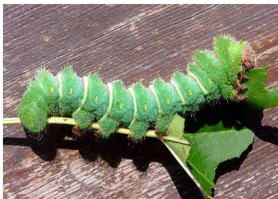
Abb. 18: Die Raupe des Kometenfalters ( Argema mittrei ) ist samtfarben mit zarten Härchen und kann über 12 Zentimeter erreichen.

Zu den wohl imposantesten Erscheinungen in der tropischen Falterwelt zählt der Kometenfalter Argema mittrei aus Madagaskar. Die endemische Augenspinnerart ist nur auf der Insel südöstlich von Afrika beheimatet. Kaum ein Schmetterlingsliebhaber kann sich der Faszination dieses Vertreters aus der Familie Saturniidae entziehen.