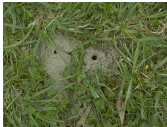
Abb. 12: Nester der Weidensandbiene Andrena vaga .

schließlich Pollen von Weiden). Mit deren Blütezeit deckt sich auch ihre Flugzeit. Wie alle Andrena -Arten hat sie einen rückgebildeten Stachel und ist auch insofern unauffällig. An sonnigen Nachmittagen sitzen Dutzende Sonnenhungrige zwischen und wohl auch auf den Nestern und merken gar nicht, dass sie sich in einer Nestagglomeration von Bienen befinden. Den unterirdischen Nestern dürfte das nicht allzu viel anhaben. Ungetrübte Sonnenstunden, die zum Sonnenbaden einladen, gibt es im April in Salzburg in der Regel sowieso nicht allzu viele.