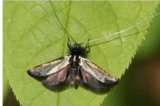
Abb. 5: Adela reaumurella (Linné, 1758) aus der Familie Adelidae.

Wert des Gehäuses liegt aber im Verdunstungsschutz genauso wie im Schutz vor zuviel Feuchtigkeit, sowie in der Tarnung vor und dem mechanischen Widerstand gegenüber Fressfeinden.