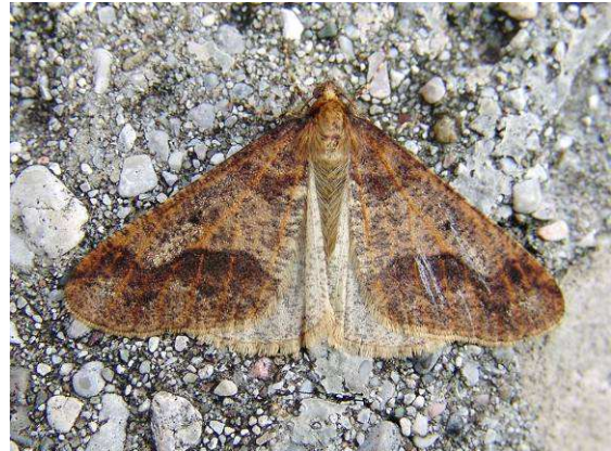
Abb. 24: Dunklere Form des Männchens des Großen Frostspanners

In Salzburg wurde der Große Frostspanner in allen Bezirken nachgewiesen, in erster Linie in Tallagen: Die Auswertung von ca. 250 Meldungen dieser Art ergab eine durchschnittliche Fundhöhe von 560 m, der höchste Fund lag bei 1350 m Höhe im Bereich von Mühlbach am Hochkönig. Die Raupe konnte ich in unserem Bundesland bisher an Zitterpappel und Faulbaum nachweisen.