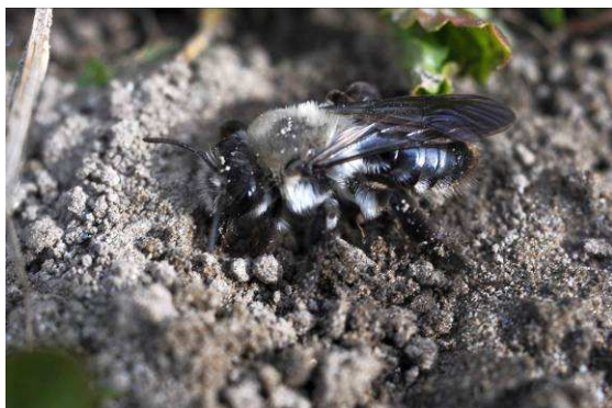
Abb. 11: Weidensandbiene Andrena vaga Panzer, 1799.

Wo ist also die große Bienenansammlung mitten in der Stadt, die eine so große Ölkäferpopulation hervorzubringen vermag?