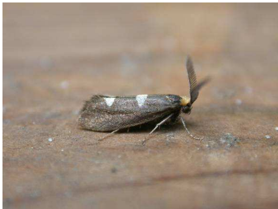
Abb. 7: Incurvaria masculella (Denis & Schiffermüller, 1775) aus der Familie Incurvariidae.

dagegen bauen sich die Raupen, sobald sie aus dem Ei geschlüpft sind, einen Köcher aus Seide und kleinen Sandkörnern oder Pflanzenteilchen, in den sie ihren Hinterleib stecken und den sie mit ihrem Wachstum immer wieder erweitern. Außerdem wird das Gehäuse außen, je nach Art, mit verschiedensten Materialien, wie Steinchen, Erdklümpchen, Blattstücken, Grasstängeln oder Nadeln belegt, um die Tarnung in ihrem jeweiligen Lebensraum zu perfektionieren.