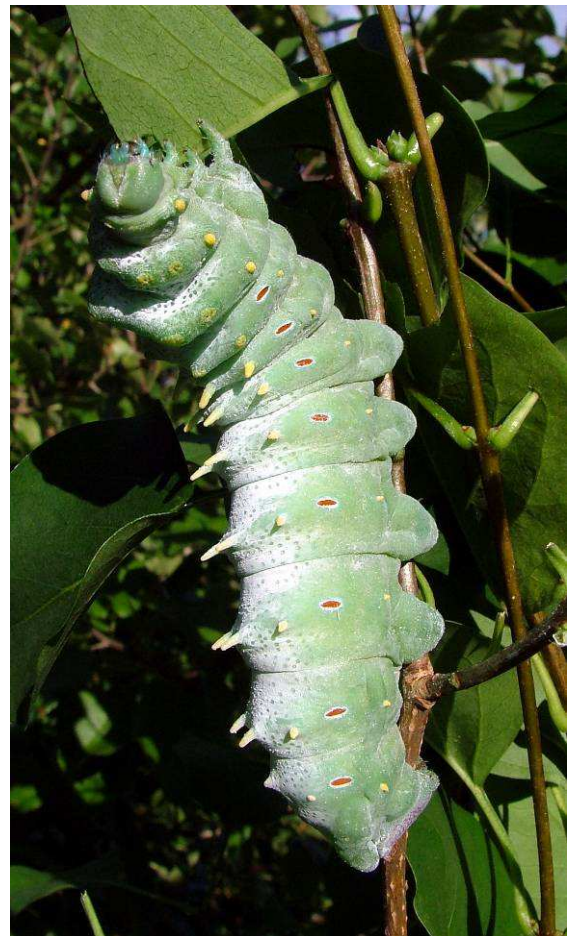
Abb. 15: Die Raupe ist ein typischer Nimmersatt und erreicht außergewöhnliche Dimensionen. Flieher fressen sie am liebsten.

Das Eimaterial stammt meistens aus Importen von Asien oder auch von Nachzuchten in unseren Breiten. Als Futterpflanze begnügen sich die Riesen mit unserem Flieder, Liguster oder Götterbaum.