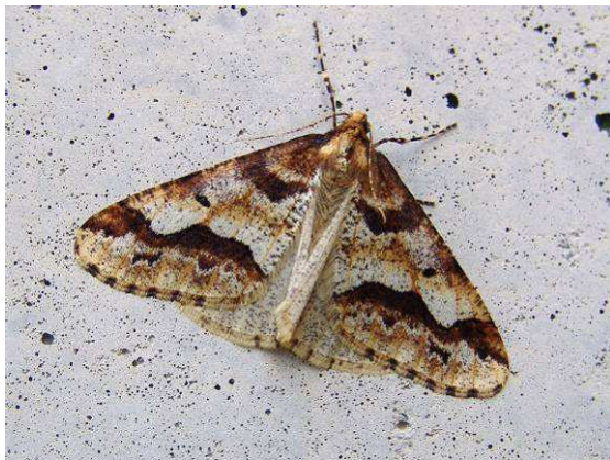
Abb. 22: Häufigere Form des Männchens des Großen Frostspanners.

Bei dem Gedanken an einen Schmetterling ohne oder mit nur verkürzten Flügeln können sich die meisten Menschen nur das Ergebnis eines Vandalenakts aus dem Bereich der Tierquälerei vorstellen. Schmetterlinge sind ja fliegende Wesen, von denen man in der Regel den Körper nicht einmal wirklich wahrnimmt. So vermag man wenig Sinn in einem Schmetterling ohne brauchbare Flügel zu erkennen.