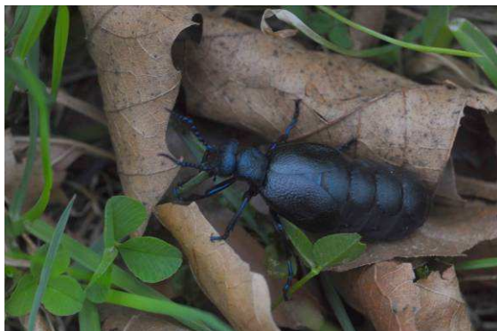
Abb. 9: Der schwarzblaue Ölkäfer Meloe proscarabaeus Linné, 1758. an der Salzachböschung im Stadtgebiet Salzburg.

Alles begann mit Meloe . Einige Mitglieder der AG Entomologie erzählten im Frühling 2010 von einer Ansammlung von Ölkäfern am rechten Salzachdamm zwischen Mozartsteg und Nonntaler Brücke. Schnell waren sie als Meloe proscarabaeus Linné, 1758 (schwarzblauer Ölkäfer) identifiziert.