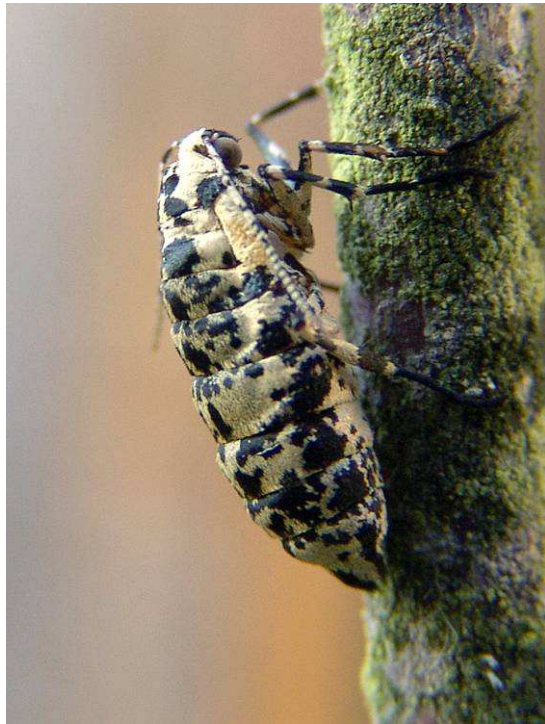
Abb. 23: Tatsächlich ein Schmetterling, der von Natur aus flugunfähig ist: Das Weibchen des Großen Frostspanners. Weiters bemerkenswert ist hier die Tatsache, dass dieses Tier, das aus einer eindeutig bestimmten Raupe stammte, stark reduzierte Flügel besaß (gelbes Viereck hinter dem mittleren Bereich des Fühlers), obwohl die Weibchen dieser Art als völlig flügellos gelten!

bäumen in der Literatur. Die offensichtlich geringen ökologischen Ansprüche dieser Art, und insbesondere die Tatsache, dass sich die Raupen vom Laub verschiedenster Laubholzgewächse ernähren können, haben eine Ausbreitung des Frostspanners über weite Teile Europas und darüber hinaus erlaubt, ohne ersichtliche Behinderung durch die Flugunfähigkeit der Weibchen.