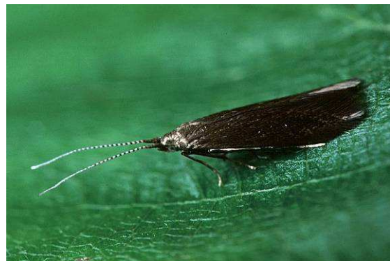
Abb. 6: Coleophora serratella (Linné, 1761), eine Coleophoridae.

Letzterer ist zwar oft recht fraglich, haben sich doch eine Reihe von Schlupf-, Brack- und Erzwespen, aber auch manche Fliegen darauf spezialisiert, gerade solche Wohnungen zu knacken. Gezielt legen sie ihre Eier in die Öffnungen oder durchbohren die Wand mit ihrem Legebohrer. Trotzdem scheint der Nutzen zu überwiegen.