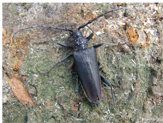
Abb. 26: Dieses Weibchen des Großen Eichenbocks wollte den Sommer in Russland verbringen: Stattdessen ist es nun allem Anschein nach das erste seiner Art, das in Salzburg nachgewiesen wurde.

Vom Großen Eichenbock gab es bislang keine ernst zu nehmenden Meldungen aus dem Bundesland Salzburg. Diese etwas wärmeliebende Art besiedelt eichenreiche Laubwälder, wie sie in Salzburg von keinem noch lebenden Menschen je bewundert werden konnten. Natürlich wurden die in Frage kommenden Landschaften des Alpenvorlandes vor bereits langer Zeit anthropogen so stark verändert, dass kaum einer sich noch vorstellen kann, wie dort früher natürliche Verhältnisse auszusehen vermochten. Wenn man nun alte Berichte liest, bekommt zumindest der Entomologe den Eindruck, hier müsste es früher die oben erwähnten Laubwälder gegeben haben: Storch (1863) ist z. B. zu entnehmen,