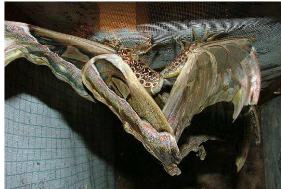
Abb. 17: Attacus caesar in Kopula. Links das Weibchen, das zusammen mit dem Männchen am Deckel vom Zuchtkasten sitzt.

Ein faszinierendes Schauspiel ist auch der Schlupf diesen Riesenfalter. Meist so ab 20.00 Uhr geht's los. Schon ca. 1 Stunde vorher, erkennt man am Kokon eine feuchte Stelle, was den Schlupfbeginn verrät. Zuerst sieht man nur den Riesenkörper, vor allem bei den Weibchen, und die etwa 3 cm kurzen Flügellappen. Aber schon nach wenigen Minuten beginnt der frischgeschlüpfte Falter mit dem Aufpumpen der Flügel. Man kann hier das Längenwachstum der Flügel förmlich erkennen. In etwa 20 Minuten sind die Flügel in natürlicher Größe und sorgen ob der Länge für große Verwunderung. Nach dem Aushärten der Flügel zeigt sich der Falter in seiner gigantischen Dimension, und man kommt aus dem Staunen nicht mehr heraus.