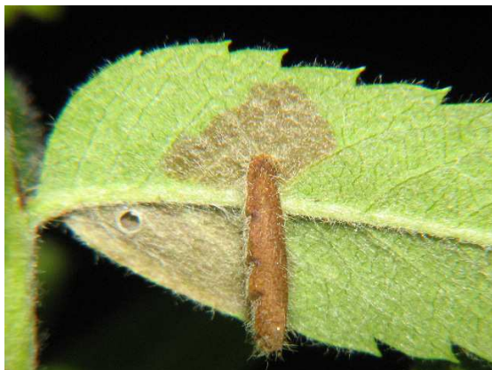
Abb. 4: Raupensack von Coleophora serratella (Linné, 1761).

Dabei gibt es sogar eine ganze Reihe verschiedener Gruppen von Schmetterlingen, deren Raupen sich ein solches "Wohnmobil" zulegen.