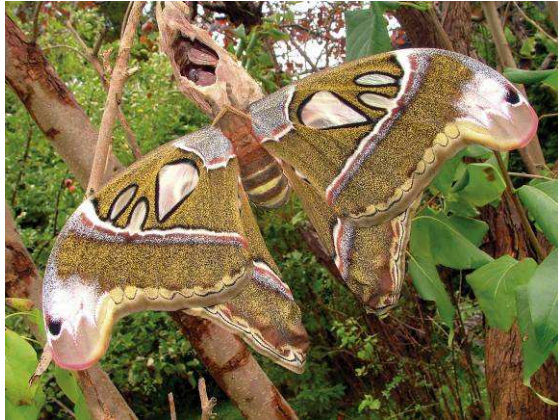
Abb. 13: Die Weibchen von Attacus caesar erreichen Spannweiten bis über 30 Zentimetern.

Wenn man sich auf die Jagd nach den größten Schmetterlingen der Welt begibt, stößt man unweigerlich auf den Attacus caesar . Dieser Attacus -Nachtfalter aus Asien, der unter anderen in der Gegend von Mindanao vorkommt, kann sich mit seiner gewaltigen Flügelspannweite über 30 Zentimeter als "wahrer Kaiser" unter den Augenspinner (Saturniidae) fühlen. Um einige Zentimeter übertreffen könnte ihn höchstens, die südamerikanische Eulenart Thysania agrippina (Weiße Hexe), die angeblich auch schon mit 35 Zentimetern Spannweite erbeutet wurde.