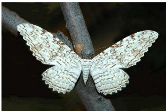
Abb. 14: Die Weiße Hexe Thysania agrippina , eine Eulenart aus Südamerika, erreicht eine Flügelspannweite von 35 cm.

Wenn man sich auf die Jagd nach den größten Schmetterlingen der Welt begibt, stößt man unweigerlich auf den Attacus caesar . Dieser Attacus -Nachtfalter aus Asien, der unter anderen in der Gegend von Mindanao vorkommt, kann sich mit seiner gewaltigen Flügelspannweite über 30 Zentimeter als "wahrer Kaiser" unter den Augenspinner (Saturniidae) fühlen. Um einige Zentimeter übertreffen könnte ihn höchstens, die südamerikanische Eulenart Thysania agrippina (Weiße Hexe), die angeblich auch schon mit 35 Zentimetern Spannweite erbeutet wurde.