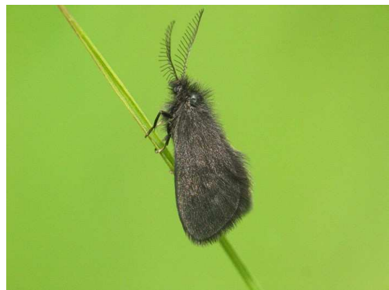
Abb. 8: Epichnopteryx plumella Denis & Schiffermüller, 1775 ein Vertreter der Familie Psychidae (Sackträger).

Lupe erkennen kann) und die Kleinschmetterlinge zu unterteilen, wobei sich die meisten Experten auf die eine oder, relativ selten, auch auf die zweite Gruppe spezialisiert haben. Wie unsinnig diese Unterteilung aber ist, sieht man am besten an den Sackträgern, deren mehr mottenartige Vertreter zu den Kleinschmetterlingen, deren robustere Vertreter aber zu den Großschmetterlingen gezählt wurden. Dementsprechend hat sich viele Jahrzehnte lang auch niemand mit dieser interessanten Gruppe beschäftigt und daher ist die Kenntnis über sie noch sehr bescheiden.