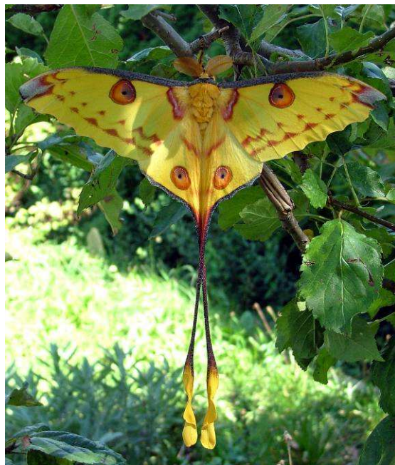
Abb. 19: Exotik pur vermittelt das Männchen von Argema mittrei , der "Komet" am nächtlichen Schmetterlingshimmel in den Tropen.

Erdball. Fast bis zu 3 mm Durchmesser erreichen sie, das ist schon sehr beachtlich.