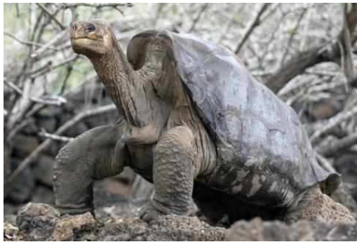
Bild 7: Schildkröten mit sattelförmigen Panzern können den Hals nach oben recken

Dann beschrieb er mehrere Beispiele für die inselspezifischen Anpassungen, die aufgrund der von Insel zu Insel unterschiedlichen ökologischen Gegebenheiten entstanden sind: Bei den Landschildkröten kann man verschiedene Arten bzw. Unterarten unterscheiden (hier ist die Auftrennung der Populationen in einem Stadium dazwischen). Es können zwei Typen von Schildkrötenpanzern unterschieden werden. Auf höheren Inseln mit ganzjährig bodennah verfügbarer Vegetation leben Tiere mit runden Panzern. Auf flachen Inseln hingegen fehlt in der Trockenzeit diese bodennahe Vegetation. Die Blätter der dort wachsenden Büsche und Kakteenfrüchte sind nur mit lang gestrecktem Hals erreichbar, weshalb die Panzer eine sattelförmige Gestalt angenommen haben.