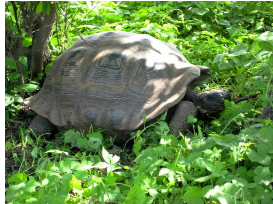
Bild 8: Schildkröten mit runden Panzern brauchen genügend Nahrung am Boden

eine genetische Drift handeln, die sich aufgrund der geringen Populationsgrößen relativ schnell entwickelt. Der flugunfähige Kormoran ist eine auch auf anderen Inseln ohne Feinde zu beobachtende Entwicklung hin zu großen, flugunfähigen Arten.