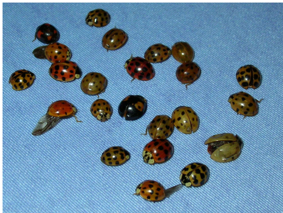
Bild 1: Die typischen Farben und Muster sind an dieser kleinen Versammlung der Überwinterungsgemeinschaft gut zu erkennen.

Seit wenigen Jahren ist die heimische Käferwelt noch bunter als sie es schon bisher war. Wo immer ein Koleopterologe genau hinschaut, findet man den Asiatischen Ma-