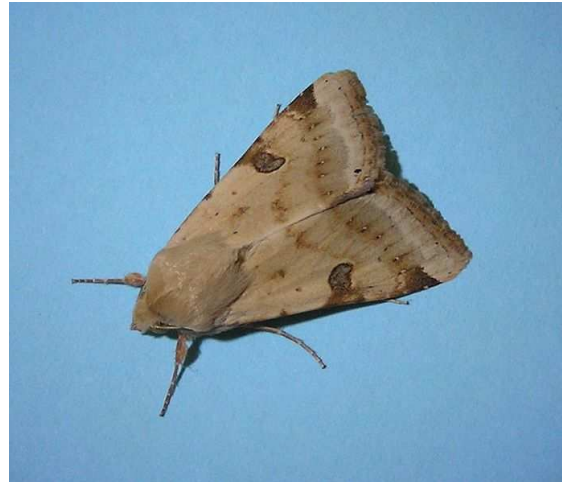
Bild 5: Wanderfalter Heliothis peltigera

Mazzucco K., 1953: Falterwanderwellen aus dem Süden. - Zeitschr. Wiener Ent. Ges. 38: 81-87. Mazzucco K., 1968: Österreichischen Forschungszentrale für Schmetterlingswanderungen. Haus der Natur, Salzburg. - Unveröffentlichter Bericht, Haus der Natur: 1-32.