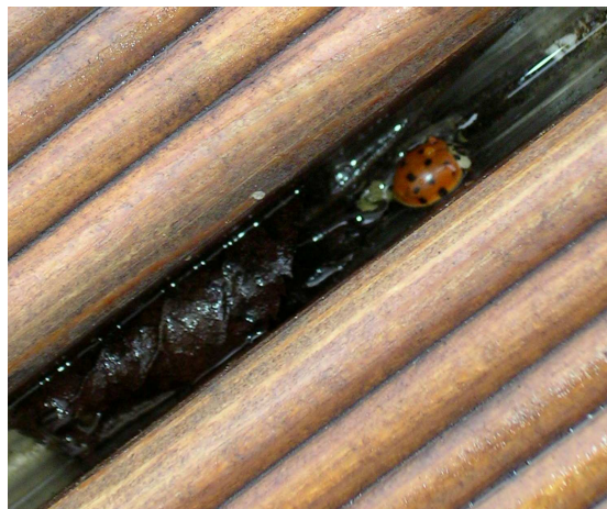
Bild 2: In diesen, bis Anfang März 2009 schneebedeckten Ritzen zwischen den Holzbrettern einer Terrasse in Grödig haben mindestens 200 Exemplare von H. axyridis überwintert.

Rabitsch, W & R. Schuh 2006. The first record of the multicolored Asian ladybird Harmonia axyridis (Pallas, 1773) in Austria. — Beiträge zur Entomofaunistik, Wien, 7: 161-164.