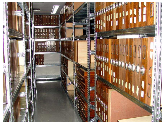
Bild 9: Lagerung der Insektenkästen in offenen Regalen

Der Sammlungsraum grenzt unmittelbar an den modern ausgestatteten Arbeitsraum, in dem ab der zweiten Jahreshälfte die Zusammenkünfte der Salzburger Entomologischen Arbeitsgemeinschaft stattfinden werden. In diesem Raum wird das Abhalten kurzer Ergebnisvorträge durch entsprechende Ausrüstung (Decken-Beamer und Projektionsfläche) auch jederzeit möglich sein. Hier wird natürlich auch für eine ausreichend große Arbeitsfläche gesorgt. Insgesamt betrachtet wird die weitere Bearbeitung der entomologischen Sammlungsbestände also unter deutlich verbesserten Bedingungen ablaufen können: Wir freuen uns bereits auf das erste Herbsttreffen! (Patrick Gros)