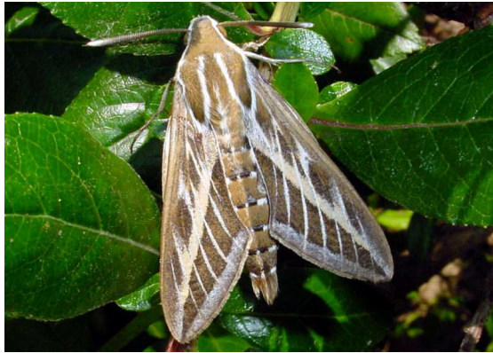
Bild 4: Wanderfalter Hyles livornica – Linienschwärmer

Norden wandern. Natürlich können die entsprechenden Zeitspannen etwas variieren, und verschiedene Einwanderungswellen einander überlappen.