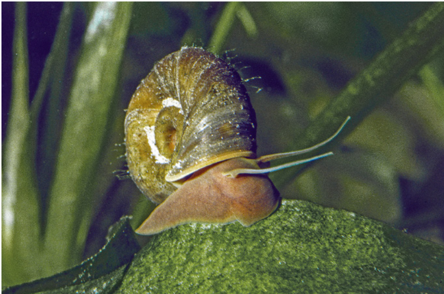
Abb. 1. Posthornschnecke Planorbarius corneus .

Robert A. Patzner robert.patzner@sbg.ac.at