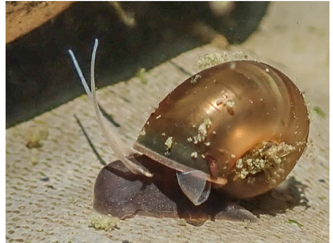
Planorbarius corneus in einem Folienteich in der Stadt Salzburg.

Inst. für Ökologie (1980–83): Limnologisch-ökologisches Überwachungsprogramm stehender Kleingewässer. Gutachten im Auftrag des Amtes der Salzburger Landesregierung, Abteilung Naturschutz. Institut für Ökologie am Haus der Natur in Salzburg. Klemm, W. (1950): Beitrag zur Kenntnis der Molluskenfauna Salzburgs. Die Gehäuseschnecken und Muscheln des Wallersees, seines Einzugsgebietes und seines Abflusses (Fischachtal). Mitteilungen der Naturwissenschaftlichen Arbeitsgemeinschaft vom Haus der Natur in Salzburg. Zoologische Arbeitsgruppe 1: 45–54.