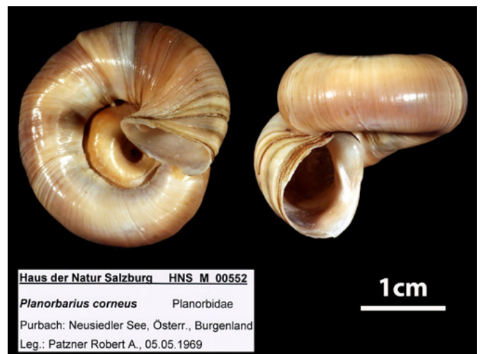
Abb. 2. Missbildung einer Schale von Planorbarius corneus aus dem Neusiedlersee, gefunden 1969. Beleg am Haus der Natur in Salzburg.

Reischütz A. & Reischütz P.L. (2007): Rote Liste der Weichtiere (Mollusca) Österreichs. In: Zulka, K.P. (Hrsg.) Rote Listen gefährdeter Tiere Österreichs: Kriechtiere, Lurche, Fische, Nachfalter, Weichtiere. Grüne Reihe 14(2): 363–433, Böhlau Verlag, Wien.