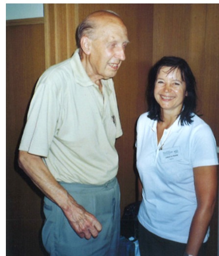
Treffen an der Universität Prag im Juli 2005.