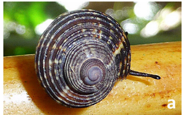
Abb. 1: a: Tropidophora pulchra , Praslin; b: Pachnodus niger , Mahé; c: Pachnodus ornatus , Mahé; d: Stylodonta unidentata , Mahé; e: Stylodonta studeriana , Praslin.

Gerlach J. (2006): Terrestrial and freshwater Mollusca of the Seychelles Islands. Backhuys, Leiden.