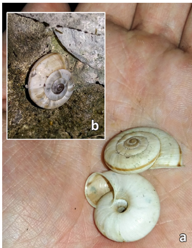
Abb. 2. C. cingulatum . a: Leerschalen b: lebendes Tier (Fundort: Bad Reichenhall/Albauer Kopf SO-Fuß).

Kwitt S. (2021). Verwendung von Observation.org zur malakologischen Kartierung. Newsletter Malakol. Arbeitsgem. Haus der Natur Salzburg 15: 5.