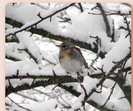
Bei geschlossener Schneedecke ist die Vogelfütterung am wichtigsten. Im Bild: Wacholderdrossel.

Körnerfresser (Finken, Sperlinge und Ammern) fressen gerne Sonnenblumenkerne und Hanf sowie die handelsüblichen Freiland-Futtermischungen. Weichfutter- und Insektenfresser (Amseln, Drosseln, Rotkehlchen, Heckenbraunelle, Baumläufer, Zaunkönig und Star) ernähren sich hauptsächlich von tierischer Kost (Insekten, Spinnentiere)