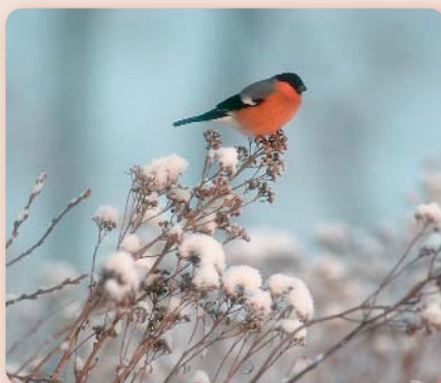
In einem Naturgarten finden die Vögel das ganze Jahr über Nahrung. Im Bild: Gimpel.