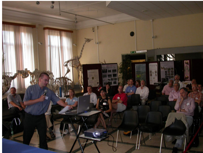
14 th European Congress of Lepidopterology – the Geometridae Workshop.

Here we are 11 years later. I don't know if the lepidopterological societies from Europe and North America increased exchanges, but at an individual level, it is clear that there has been more regular cross-Atlantic attendance. And my Bernard has moved to Europe, a sad loss for Canada and a great gain for Switzerland (Holy smoke! We did not mean 'increased exchanges' to be that way!) The Rome congress included eight participants from the New World (2 from Canada, 1 from Ecuador, 5 from the United States).