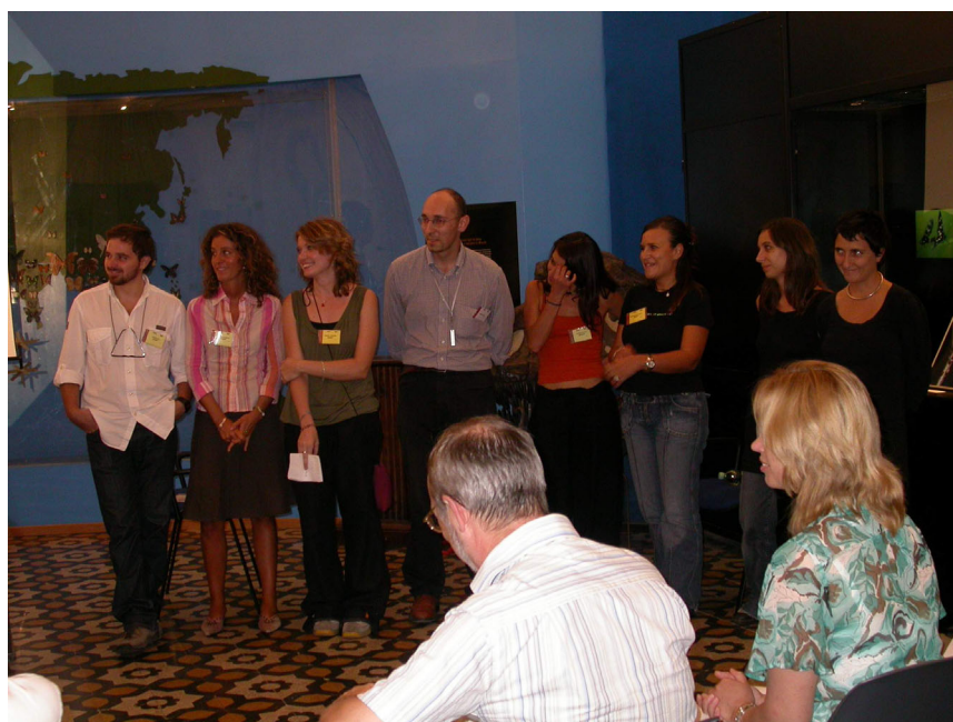
14th European Congress of Lepidopterozoology – applause for the assistants (Photo: R. Trusch).