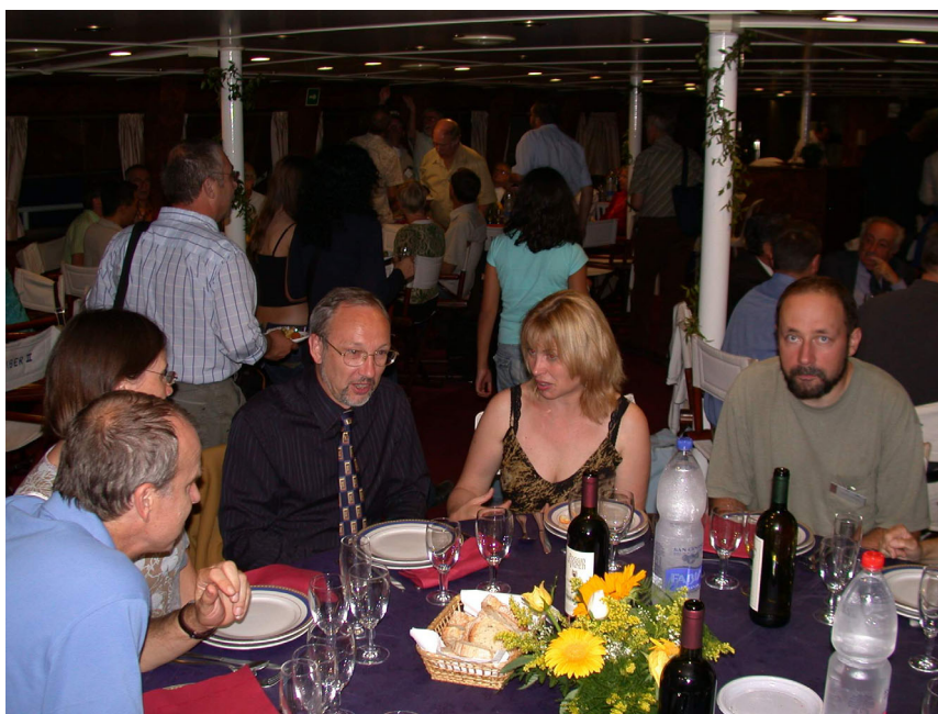
14 th European Congress of LepidopteroLOGY – Congress dinner during a cruise.