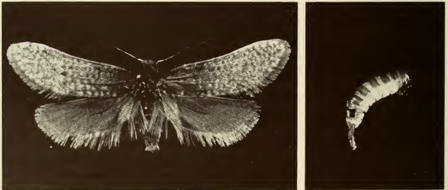
Abb. 1. Männchen (links) und Weibchen (rechts) von Praesolenobia clathrella (F.v.R.). Spannweite (♂) 16 mm. Imagines nehmen keine Nahrung auf ; die Lebensdauer beträgt maximal nur wenige Tage.

Am 2. April 1988 wurden zusammen mit den Herren F. LICHTENBERGER und J. ORTNER, beide Waidhofen/Ybbs, Gehäuse von Praesolenobia clathrella (FISCHER VON RÖSLERSTAMM, 1837), in Loretto (Burgenland) gesammelt (vergleiche LICHTENBERGER, 1983). Der Lebensraum dieser nach MACK (1985) in Niederösterreich, Mähren und Ungarn verbreiteten Art ist ein teilweise verbuschtes Wiesengelände, das als Truppenübungsplatz genutzt wird. Die Männchengehäuse waren im Grasbestand knapp über dem Boden zur Verpuppung angespannen, die der Weibchen meist über der Grasschicht, z.B. an trockenen Apiaceenstengeln. Die Gehäuse wurden zuhause mit einem Teil des Substrates (Grasblatt, Stengel) an eine senkrechte Unterlage (Styropor) genadelt und bis zum Schlupf gruppenweise und nach Geschlechtern getrennt in Gläsern aufbewahrt. P. clathrella tritt ausschließlich in einer bisexuellen Form auf (Abb. 1).