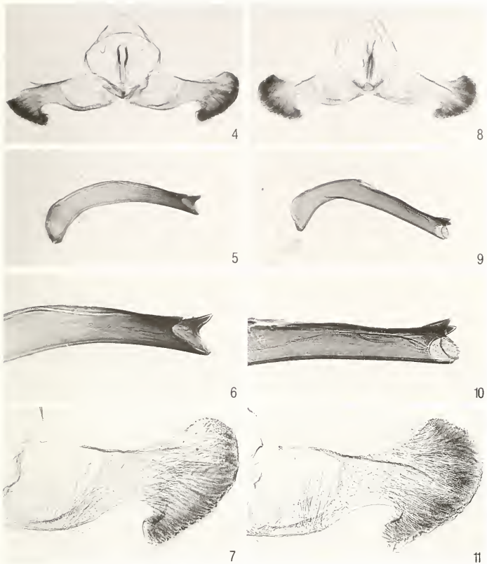
Abb. 4-11. Dichrorampha harpeana Frey, ♂ Genitalien - Tegumen-Vinculum-Valva (4,8), Aedoeagus x2,5 (5,9), Aedoeagusspitze x5 (6,10), Valva x2,5 (7,11): 4-7. D. harpeana harpeana , Lectotypus, Schweiz, Graubünden; 8-11. D. harpeana andorraensis ssp.n., Holotypus, Andorra.

den Gebirgszonen der iberischen Halbinsel sind erst wenige Arten bekannt (Vives Moreno, 1992) und es scheint daher von besonderem Interesse weitere Funde aus der Region publik zu machen.