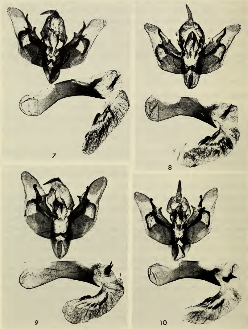
Fig. 7-10. Armures génitales ♂. - 7. C. oreana n. sp., paratype, mêmes localité et date que l'Holotype. - 8. Id., Porté (Pyr.-Ortles). - 9. C. alpestris Bsd., Montagne de Lure (Alpes de Haute-Provence). - 10. C. ocellina Schiff., env. Mizoen (Isère).