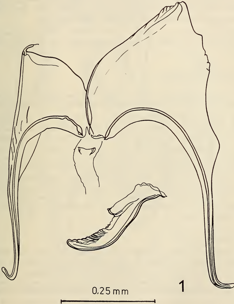
Abb. 1. Subgenitalplatte des Holotypus von Gnorimoschema elbursicum sp.n.

♀ – Subgenitalplatte (Abb. 1) deutlich breiter als lang, strukturlos, mit eingebuchtetem Proximalrand, der in Richtung zum ostium bursae mässig ausläuft. Vorderapophysen mittellang mit kurz gebogenen Spitzen. Colliculum klein, schwach sklerotisiert. Signum relativ gross und plump, mässig gebogen, mit stumpfer Spitze.