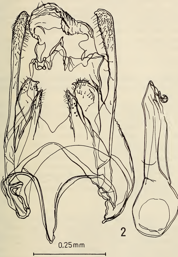
Abb. 2. Männliche Genitalien des Holotypus von Scrobipalpa zouhari sp.n.