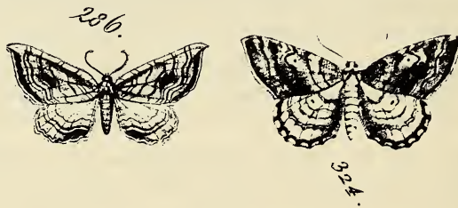
Abb. 2. Die " Lapidaria " – (286) und die " Lapidata "-Abbildung (324) von HUEBNER, wovon Nr. 324 nach DE LA HARPE 1855 radicaria ähnlich sein soll. Bei radicaria laufen die Linien jedoch anders, der Apikalstrich ist viel deutlicher und die Mittelpunkte fehlen meistens.

Ich muss hier ausdrücklich darauf hinweisen, dass laurinata SCHAW. nach meinen Untersuchungen weder als eine Unterart noch eine Form von radicaria LAH., sondern lediglich als ein Synonym angesehen werden darf. Der Lectotypus von laurinata SCHAW. (in coll. Nat. hist. Mus. Wien, siehe in REZBANYAI 1978) ist nach seinem Aussehen mit dem radicaria -Neotypus ziemlich identisch ; er ist nur etwas dunkler braun, deshalb treten die Zeichnungen weniger deutlich vor und auch der Apikalstrich ist weniger scharf. Die wichtigsten Erkennungsmerkmale der Genitalien (Ampulla der Valven) konnten auch ohne Mazeration untersucht werden.