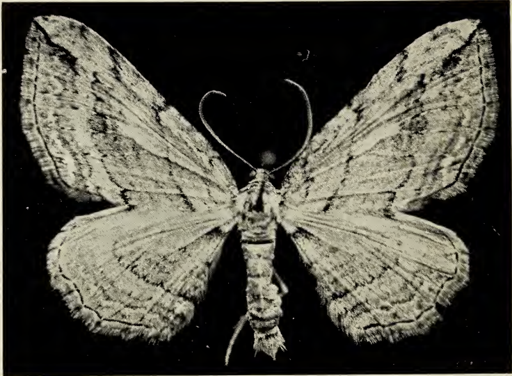
Abb. 1. Horisme radicularia DE LA HARPE 1855, Neotypus (♂) CH Lausanne VD, Mai 1928, leg. F. KEHRMANN, in coll. Mus. zool. Lausanne.

bzw. in Mitteleuropa heute laurinata nennt (REZBANYAI 1978, 1981, FORSTER & WOHLFAHRT 1981, usw.). Das von der Wiener tersata artverschiedene Taxon soll folglich Horisme radicularia DE LA HARPE 1855 heissen.