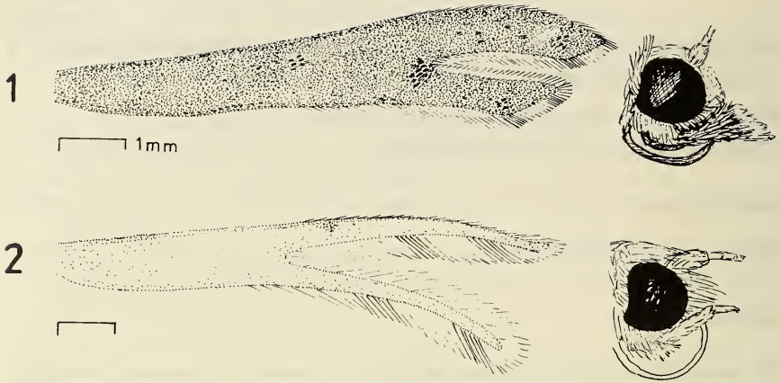
Abb. 1-2. Stenoptilia paludicola WALLENGREN (1) und Pterophorus obsoletus ZELLER (2) aus Ungarn; Vorderflügel und Kopf.