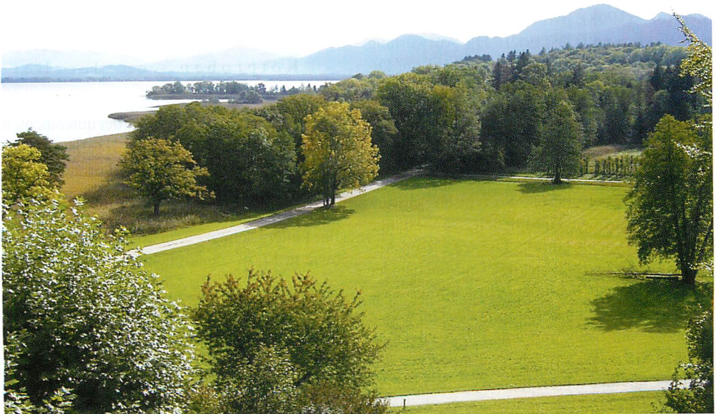
Abb. 1. Herreninsel. Blick vom Nordteil in Richtung Süden.

erhebliche Belästigung der Touristen sowie der auf der Insel beschäftigten Personen dar. Aufgrund der Bedeutung des Chiemsee für den Tourismus wurden die Mücken aufgrund ihrer hohen Populationsdichte in den Jahren 2000 (Juli bis August) und 2001 (Juli) durch den Einsatz von BTI ( Bacillus thuringiensis israelensis ) auf der Insel und an den Uferzonen des Sees bekämpft (Landratsamt Rosenheim, briefliche Mitteilung). An den Uferzonen des Sees fand die Bekämpfung auch zusätzlich in den Jahren 1996, 1997 und 1998 statt. BTI hemmt gezielt die Entwicklung von Stech- und Zuckmücken (Culiciden und Chironomiden) und scheint für andere Organismen weitgehend harmlos zu sein (IGLTHALER 1999). Stellen Stech- und Zuckmücken jedoch einen wichtigen Nahrungsbestandteil für Insektenfresser wie die