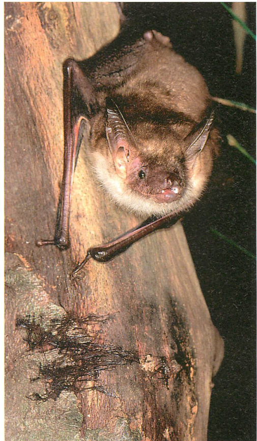
Abb. 1. Mausohr ( Myotis myotis ) nach Netzfangkontrolle kurz vor dem Abfliegen.

Die Ergebnisse der Netzfänge sind in Tab. 1 zusammengestellt. Insgesamt wurden von 1999 bis 2004 80 Mausohren gefangen, davon 35 ♀♀ und 43 ♂♂; bei 45 Tieren wurde der Unterarm vermessen.