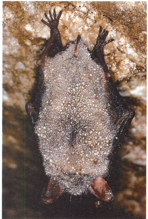
Abb. 3. Mausohr ( Myotis myotis ) winterschlafend in einer Gipskarsthöhle.

RÜHMEKORF & TENIUS (1960) haben in 10 Jahren im Weserbergland und im Harz 15 ♂♂ und 24 ♀♀ z. T. im Winter markiert. Darunter befand sich ein ♀, das am 27.IX.1953 in einem