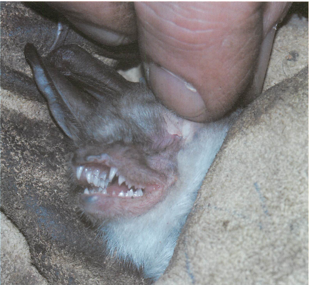
Abb. 3. Linke Gesichtshälfte des mißgebildeten Mausohr-♂.