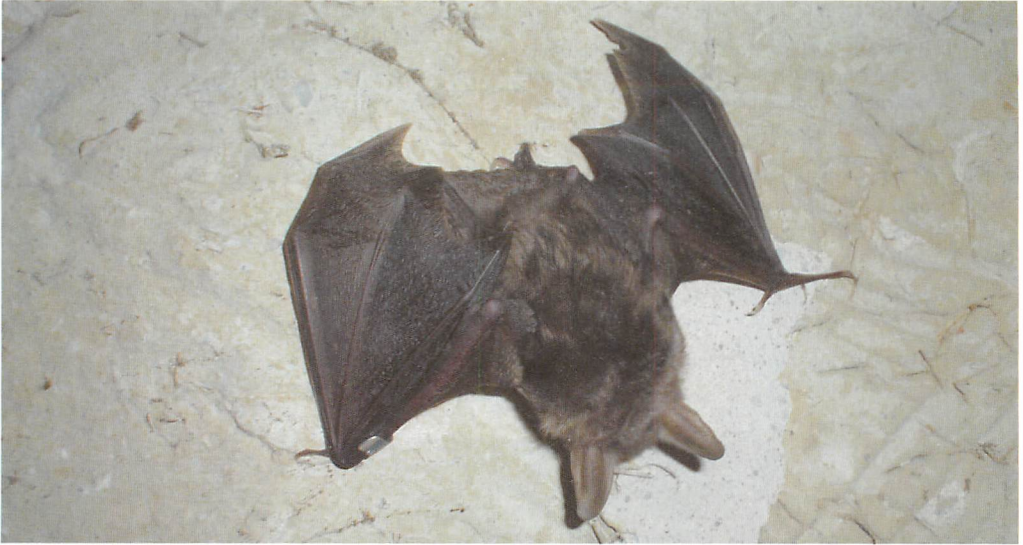
Abb. 2. Mißgebildetes Mausohr-Jungtier an der Wand sitzend kurz vor dem Abfliegen.