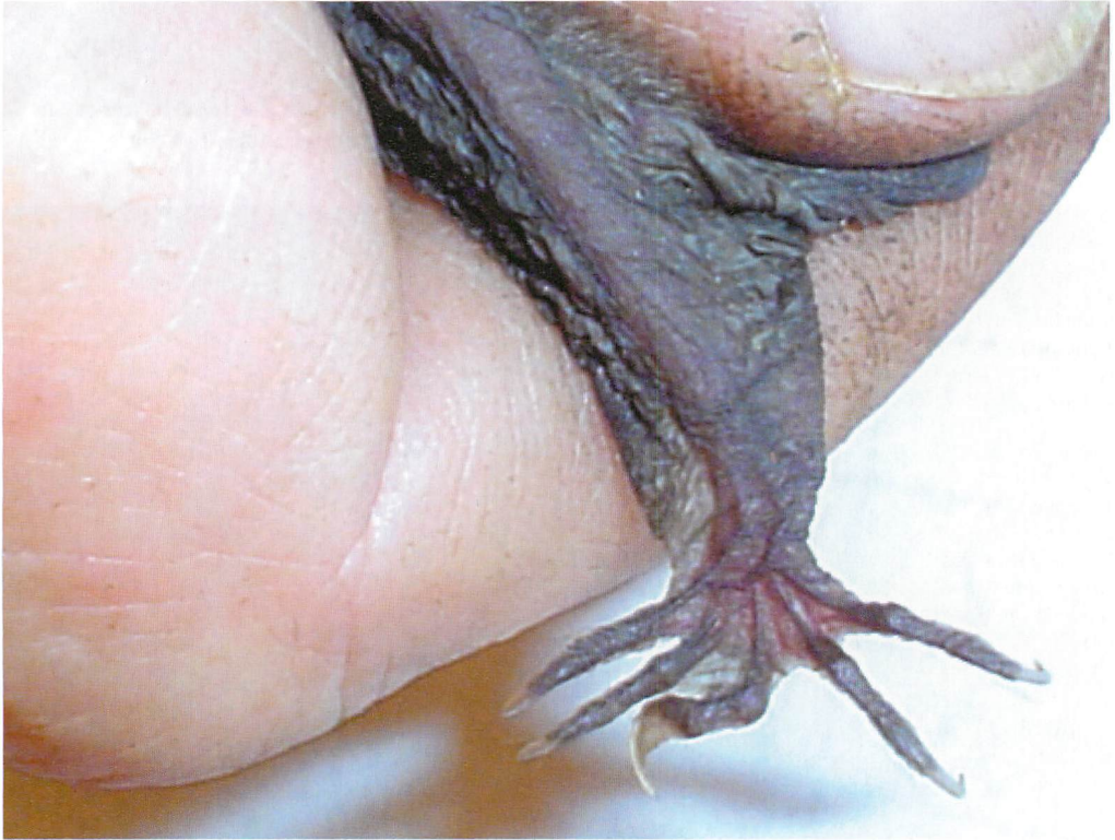
Abb. 4. Linker Fuß des mißgebildeten Mausohr-♂.