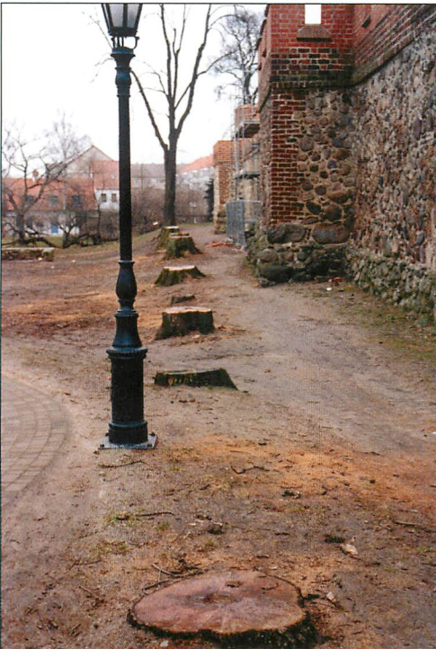
Abb. 9. Herstellung einer Sichtschneise durch Liquidierung der ganzen Baumreihe in Beeskow, 4.II.2005.

Die Beobachtungen in den als Paarungsgebiete entwickelten Fledermauskastengebieten lassen erkennen, daß der männliche Teil der Mausohrpopulation, soweit wie die Strukturen der Landschaft es zulassen, diffus verteilt ist. Die einzeln sitzenden Quartierbesitzer erwarten in der Paarungszeit die Zugesellung der WW. Eine hohe Trefferquote ist durch die genetisch bedingte Habitatpräferenz und im Gebiet durch akustische Signale der MM garantiert.