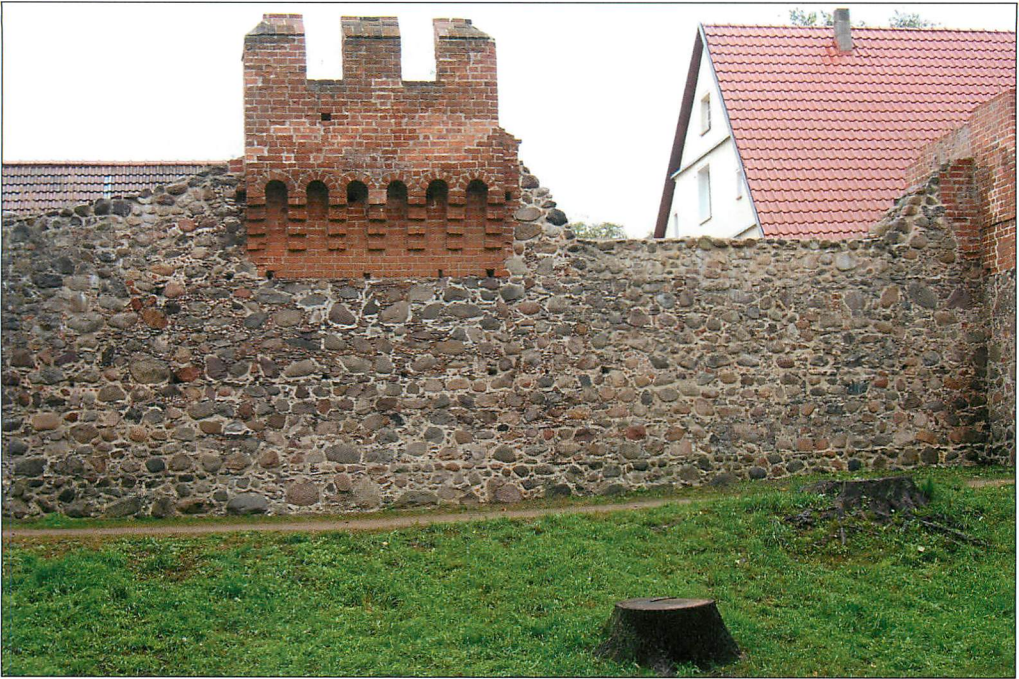
Abb. 8. Fällung wertvoller Altbäume in Beeskow zur Freistellung der sanierten Stadtmauer mit Kriegsdenkmal (n Mio EURO), 25.IX.2005.