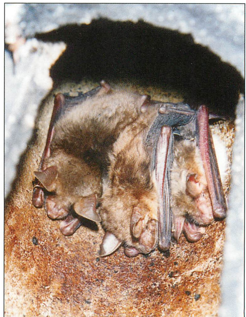
Abb. 5. Das im Text erwähnte Mausohr-M X 64545 in einer Paarungsgruppe im FKa 10 im Revier Kirschweg, 10.IX.1996.