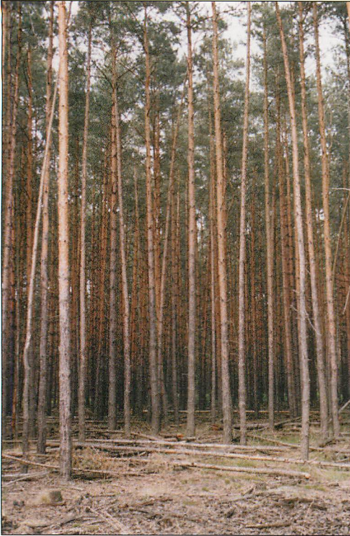
Abb. 3. Kiefern-Stangenholz im Mausohr-Paarungsgebiet Blankes Luch, 1.V.1998.

im Revier Blankes Luch. Während es in den beiden folgenden Jahren wieder Paarungsgruppen im Revier Blankes Luch bildete (3 verschiedene WW), blieb es bis zum Jahr 2005 (x 29.VI. und 1.VIII.) verschollen. Es erreichte ein Alter von 10 Jahren und 2 Monaten.