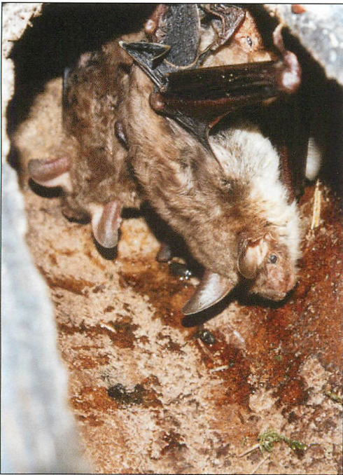
Abb. 7. Mausohr-Paarungsgruppe mit MA 02590 im FKa des Reviers Blankes Luch, 1.X.2000.

Im Revier Blankes Luch entwickelte sich die 2FN-Holzbetonhöhle 33 am Rande eines monotonen Kiefern-Stangenholzes zum wichtigsten Paarungsquartier (Abb. 7). Am 23.VIII.2000 bildete das M A 02590 mit dem W A 12695 eine PGr in dieser Höhle. Es war in der Region schon seit 1995 (o 8.VIII. Revier Dollin als juv.) bekannt, besetzte 1996 (x 4.VII., 27.VII., 11.VIII., 17.VIII., 17.IX., 27.IX.) im Beringungsgebiet einen Fledermauskasten und weilte kurzzeitig (x 23.VII.) im Revier Blankes Luch, ohne in diesen Gebieten eine Paarungsgruppe bilden zu können. In den folgenden Jahren besetzte es zur Paarungszeit im Revier Blankes Luch den FKa 10 (x 5.VII., 2.IX. und 5.X.1998, 3.VII., 15.VII., 22.VIII., 18.IX. und 4.X.1999) und bildete in seinem 3. und 4. Lebensjahr mit jeweils 1 W (A 12412, = Nachtrag zu SCHMIDT 2003, A 18624) eine Paarungsgruppe. Fortpflanzungsmäßig richtig erfolgreich wurde es erst nach Inbesitznahme von FKa 33 im Jahr 2000 (x 20.VII.-1.X.), in dem es mit 6 verschiedenen WW 3 PGr bildete. Anschließend fehlte von M A 02590 jeder Nachweis bis 2005, als es vorübergehend vor der Paarungszeit nochmals auftauchte (x 29.VI. und 1.VIII., Alter 10 Jahre 1 Monat). M A 02590 hatte insgesamt mit 8 verschiedenen WW Paarungsgruppen gebildet, in der Saison 2000 mit 6 verschiedenen, am 18.IX.2000 gleichzeitig mit 4.