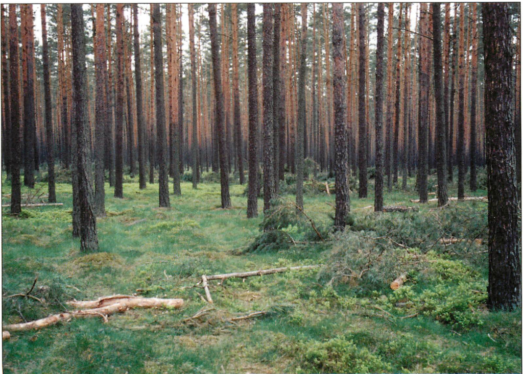
Abb. 6. Lebensraumausschnitt, Kiefernforst, Baumholz, im Revier Schwarze Lake, 1.V.1998.

Im Gebiet Schwarze Lake, 11 km NNO Beeskow, hängen 12 FKä auf 11 ha (Abb. 6). Dieses Fledermauskastengebiet wurde 1984 eingerichtet. Erst 1996 konnten Mausohren nachgewiesen werden (2 Ex.). Die ersten 2 PGr wurden 1999 festgestellt. In den letzten 3 Jahren (2003-2005) hatten 4-5 MM Paarungsquartiere besetzt und mit 8-19 WW pro Paarungszeit Paarungsgruppen gebildet. Das MA 27698 bildete in der PZ 2003 mit 6 verschiedenen