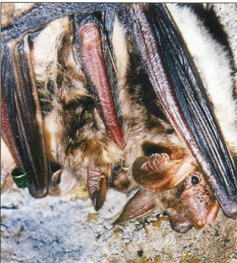
Abb. 4. Mausohr-Paarungsgruppe in einer 2FN-Höhle im Revier Kirschweg am 7.X.2001, ausschließlich aus Wiederfunden bestehend: M A 34083 (o 23.VIII.2001, ad.), W A 06589 (o 27.VIII.1996, ad.), W A 01276 (o 21.VII.1995, juv., Wst Bad Freienwalde, BG Dr. J. HAENSEL) und W A 30029 (o 26.VII.2000, juv., dieselbe Wst, BG Dr. J. HAENSEL).

M X 44859 wurde am 17.VII.1984 ad. beringt und am 8.VIII.1985 im Gebiet kontrolliert. In beiden Jahren konnte es keine Paa-