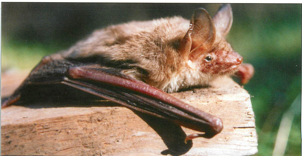
Abb. 1. Mausohr-Männchen aus einem Fledermauskasten im Revier Schwarze Lake, 22.X.2000. Aufn.: Dr. AXEL SCHMIDT

Vor den Nachweisen von Paarungsgruppen des Mausohrs in Fledermauskästen waren nur aus Balkenlöchern des Schlosses Ragow (LOS) und des Schlosses Sauen (LOS) Paarungsgruppen bekannt.