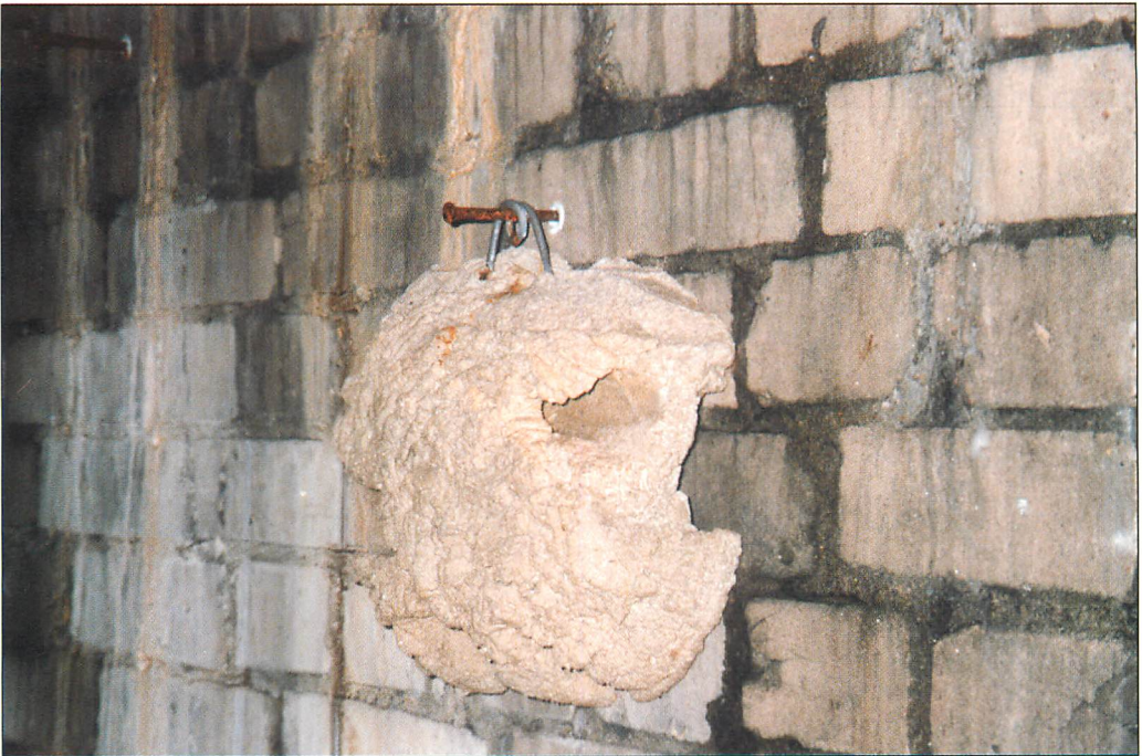
Abb. 4. Das auf Abb. 3 erkennbare Wandelement in Großaufnahme. Am Ende der vorderen Röhre befand sich am Kontrolltag – allerdings nicht sichtbar – eine winterschlafende Fledermaus (22.II.2007).

bzw. Stahlnägel an den Wänden und ohne Bügel an den Decken (Abb. 3, 4) von mehreren unterirdischen Hohlräumen, die als Fledermaus-Winterquartiere meist seit langem bekannt waren, aber viel zu wenig Versteckmöglichkeiten boten. Zu meiner großen Überraschung wurden diese eher aus Verlegenheit entstandenen, äußerlich zugegebenermaßen recht unförmig aussehenden und dadurch ziemlich gewöhnungsbedürftigen Wand- und Deckenelemente überall (!) sehr gut von den Fledermäusen angenommen.