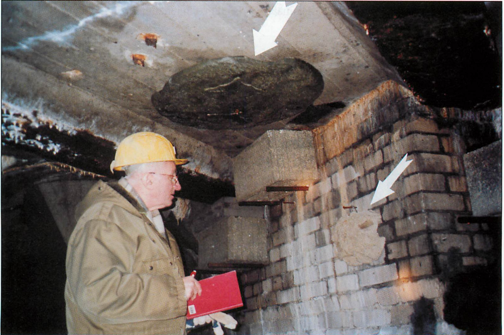
Abb. 3. Je ein aus Holzbetonresten hergestelltes Decken- (dicker Pfeil) und Wandelement (dünner Pfeil) - (6. II.2007). Das Wandelement besitzt zwei hinter- bzw. übereinander ausgeformte Eingänge jeweils mit flachen Hohlräumen im Inneren. Des Weiteren sind im „Aschetunnel“ verschiedene, von den Fledermäusen meist ebenfalls gut angenommene Hohlblocksteine eingebaut.