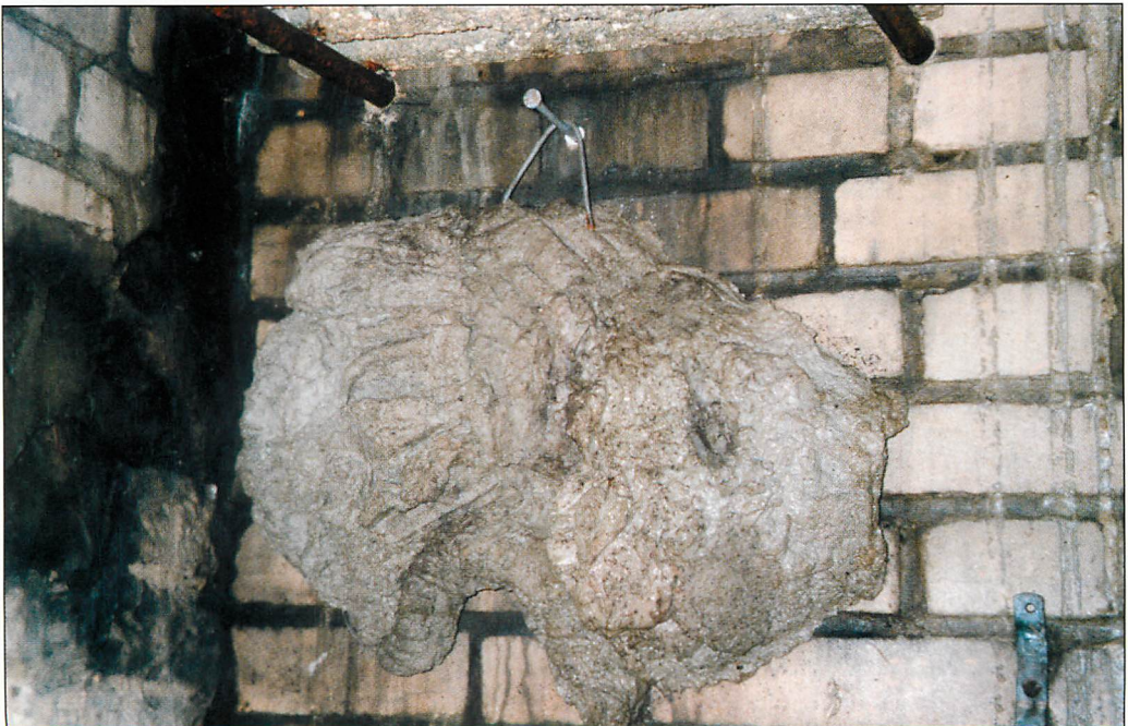
Abb. 1. Aus Holzbetonresten hergestelltes Wandelement. Außenansicht. im „Ascheltunnel“ Hennickendorf (22.II.2007).

Diese äußerlich sehr unterschiedlich aussehenden Hohlkörper befestigte ich mittels Bügeln, eingehängt in eingedübelte Schrauben