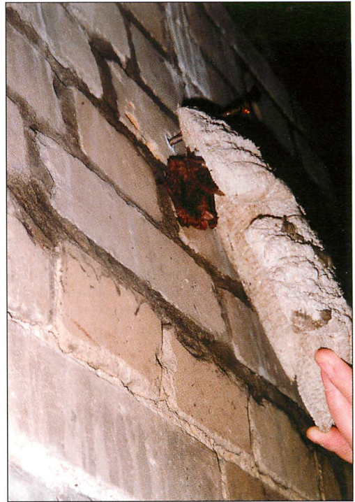
Abb. 5. Hinter einem leicht abgehobenen Wandelement befinden sich 2 auf Körperkontakt winter-schlafende Fledermäuse, vorn eine Fransenfledermaus, Myotis nattereri , dahinter – kaum erkennbar – eine Wasserfledermaus, Myotis daubentonii (22. II.2007).

Seither hat sich die Anzahl der überwinternden Fledermäuse deutlich erhöht (Tab. 1). Im Winter 2005/06 konnten 54, 2006/07 maximal 56 Überwinterer gezählt werden. Obwohl wir einen Teil der Tiere zuletzt durch die Kontrollen am 11.I.2007 störten, da wir zur Fest-