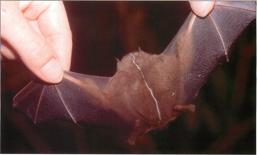
Abb. 15. Die Gesichts- und Rückenzeichnung der Gemeinen Gelbohrfledermaus wird wie die bei vielen anderen Zelt bauenden Arten als Tarnung zur Auflösung der Konturen gegenüber von unten herauf blickenden Freßfeinden interpretiert (REID 1997).

und Nektar aufgenommen (REID 1997). Die Gemeine Gelbohrfledermaus tritt sowohl in naturnahen Waldbeständen als auch in Plantagen auf. Die beiden Angehörigen der Gattung Uroderma nutzen als Quartier Blätter, die sie selbst in eine entsprechende Form bringen (englisch: tent-making bats). Hauptsächlich werden große Blätter, z.B. die von Bananen genutzt, bei denen die Tiere entlang der Mittelrippe das Gewebe herausbeißen, so dass das Blatt wie ein Zelt nach unten klappt und so ein schattiges und sicheres Tagesquartier entsteht. Da Gelbohrfledermäuse die Saft führenden Gefäße der Blätter nicht durchtrennen, bleiben diese lange Zeit grün und können bis zu 60 Tage genutzt werden (TIMM 1987). Knapp 60 Individuen wurden bereits in einem Quartier gezählt (REID 1997). Außer diesen „Zelten“ können die Tiere auch aus mehreren kleinen Blättern schirmähnliche Quartiere direkt am Stamm bauen (CHOE 1994).