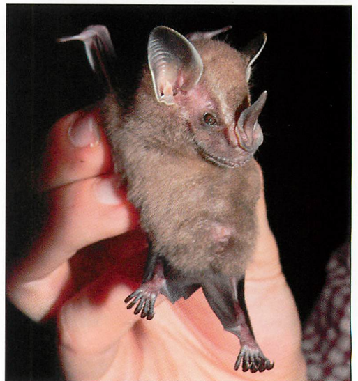
Abb. 16. Zwerg-Fruchtfledermaus ( Artibeus phaeotis ).

gut von den ähnlichen Gelbohrfledermäusen zu unterscheiden. Die kleinste der 19 Arten (Gewicht eines gefangenen Männchens 12 Gramm, Unterarm 38,5 mm) ist die Zwerg-Fruchtfledermaus (NOWAK 1994). Die Art ist in Tieflandlebensräumen Mittelamerikas vom südlichen Mexiko bis nach Ecuador und Gu-