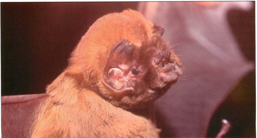
Abb. 10. Porträt von Mormoops megalophylla .