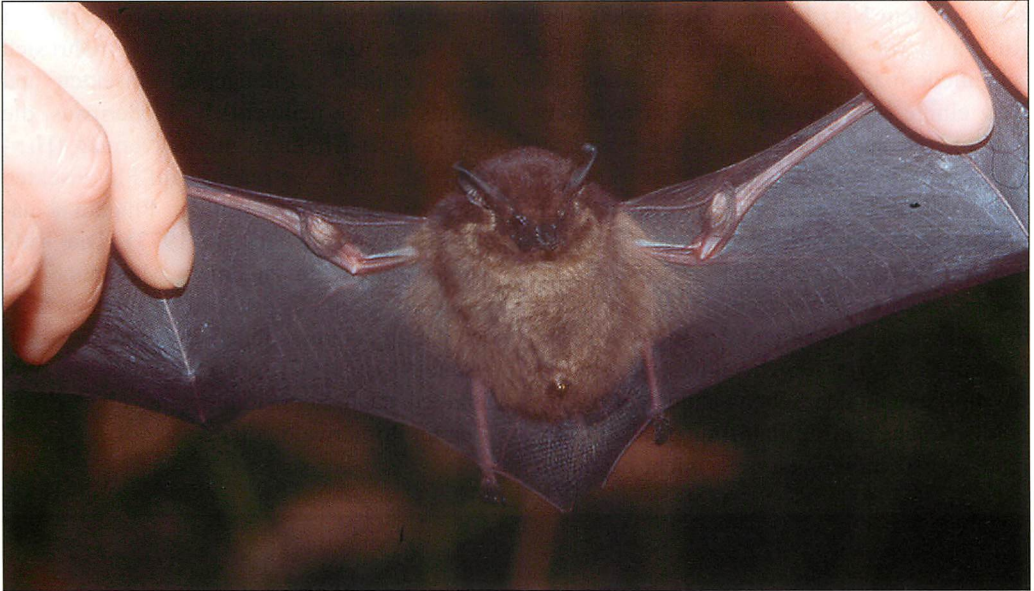
Abb. 6. Gut zu erkennen sind die Flügeltaschen von Saccopteryx bilineata .

auf. In diesen befindet sich eine stark riechende Masse, die beim Paarungsspiel der harem bildenden Art eine Rolle spielt (BRADBURY & EMMONS 1974). Diese Masse wird nicht in den Taschen gebildet wie früher angenommen, sondern die Tiere stopfen Sekrete aus der Genitalregion, einer an der Kehle gelegenen Drüse, Urin und Speichel in diese Taschen, wo diese dann unter Beteiligung von Bakterien zu