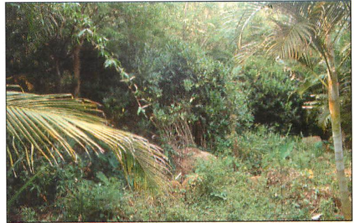
Abb. 4. Fangplatz im Bereich der Wiederaufforstung.