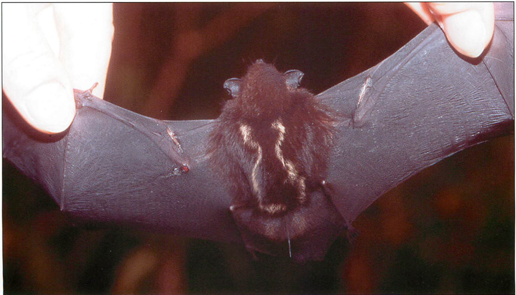
Abb. 7. Rückenzeichnung der Zweistreifen Taschenfledermaus ( Saccopteryx bilineata ).