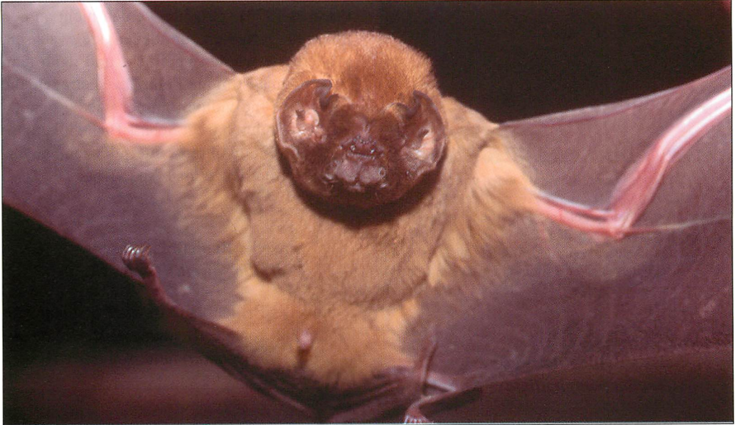
Abb. 9. Die Augen der Kinnblattfledermaus ( Mormoops megalophylla ) sind von vorne nicht zu sehen.

Nicaragua und von Kolumbien bis Venezuela und Ecuador. Aus Costa Rica und Panama liegen keine Nachweise vor (INFO NATURA 2003). Die Art hat ein ausgesprochen ungewöhnliches und charakteristisches Gesicht, dessen einzelne Elemente und Zugehörigkeiten sich erst nach längerer Betrachtung erschließen, so sind z.B. die Nasenöffnungen in die Oberlippe integriert.