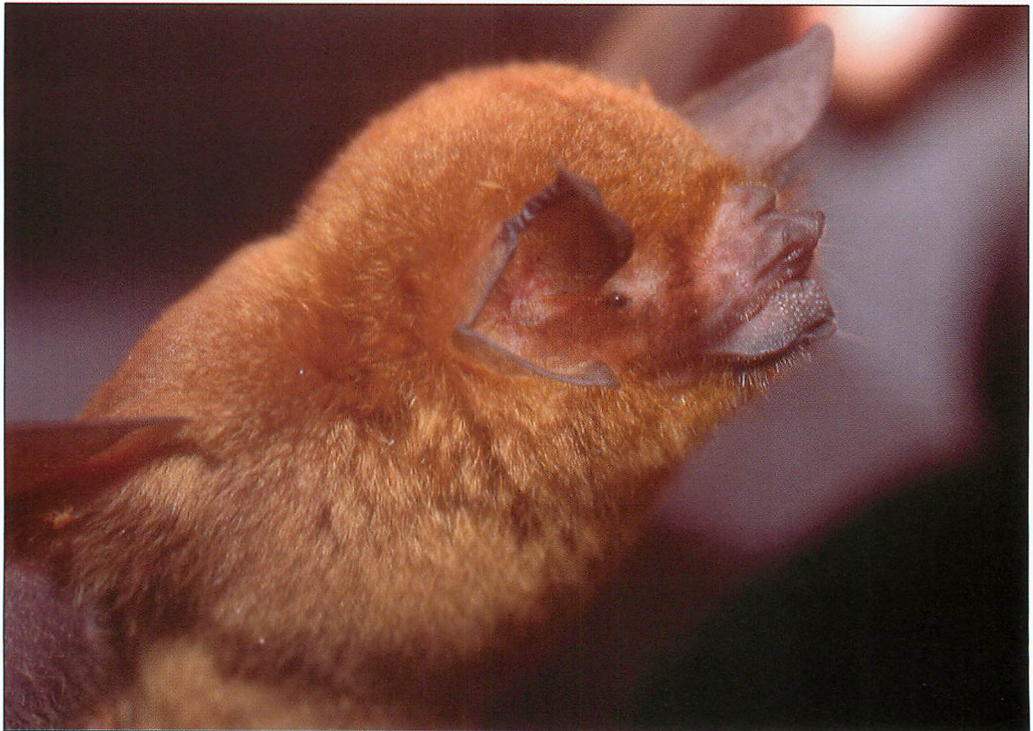
Abb. 8. Porträt der Gewöhnlichen Schnurrbartfledermaus ( Pteronotus parnellii ).

Die zu den auf die Neue Welt beschränkten Schnurrbart- oder Kinnblattfledermäusen ( Mormoopidae ) zählende Gewöhnliche Schnurrbartfledermaus ist von Mexiko bis nach Bolivien, Peru und Brasilien verbreitet (WILSON & REEDER 2005). Die Art ernährt sich ausschließlich von fliegenden Insekten und gilt als einzige neuweltliche Fledermaus, die den Doppler-Effekt zu nutzen vermag (HENSON et al. 1987). Sie reagiert auf Fluginsekten erst dann, wenn diese mit den Flügeln schlagen (GOLDMAN & HENSON 1977). Die Rufe werden durch die zu einem Megaphon geformten Lippen ausgestoßen. Waldwege werden häufig als Flugstraßen aber auch zur Jagd genutzt (REID 1997). Ein Tier wurde ca. zwei Stunden nach Sonnenuntergang über einem Weg im Primärwald gefangen.