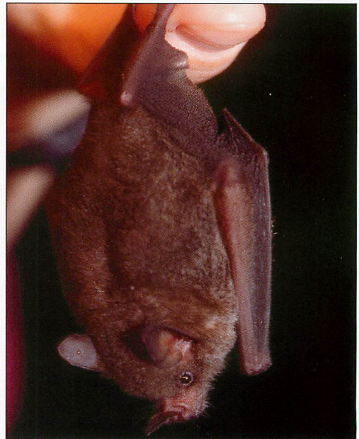
Abb. 12. Die artliche Eigenständigkeit von Sowell's Brillenblattnase ( Carollia sowelli ) ist erst seit dem Jahr 2002 bekannt.

Sowell's Brillenblattnase wird erst seit dem Jahr 2002 von der Seidigen Brillenblattnase ( Carollia brevicauda ) unterschieden (BAKER