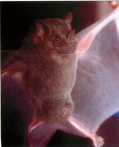
Abb. 13. Männchen der Kleinen Lanzennase ( Phyllostomus discolor ).

Die Tiere ernähren sich zum überwiegenden Teil von Früchten, zu einem geringeren Anteil werden auch Insekten gefressen (Angaben für mittelamerikanische, unter C. brevicauda geführte Tiere, REID 1997, LOU & YURRITA 2005). Während der Nahrungssuche scheinen sich die Tiere auch am Boden zu bewegen, da sie bisweilen in mit Früchten beköderten Mausefallen in dichter Vegetation gefangen werden (REID 1997). GALINDO-GONZÁLEZ (2004) stuft die Art (unter C. brevicauda ) als von Waldlebensräumen und zwischen diesen liegenden vernetzenden Vegetationsstrukturen abhängig ein, in größeren Primärwäldern ist die Art seltener als in vom Menschen beeinflussten Habitaten (REID 1997).