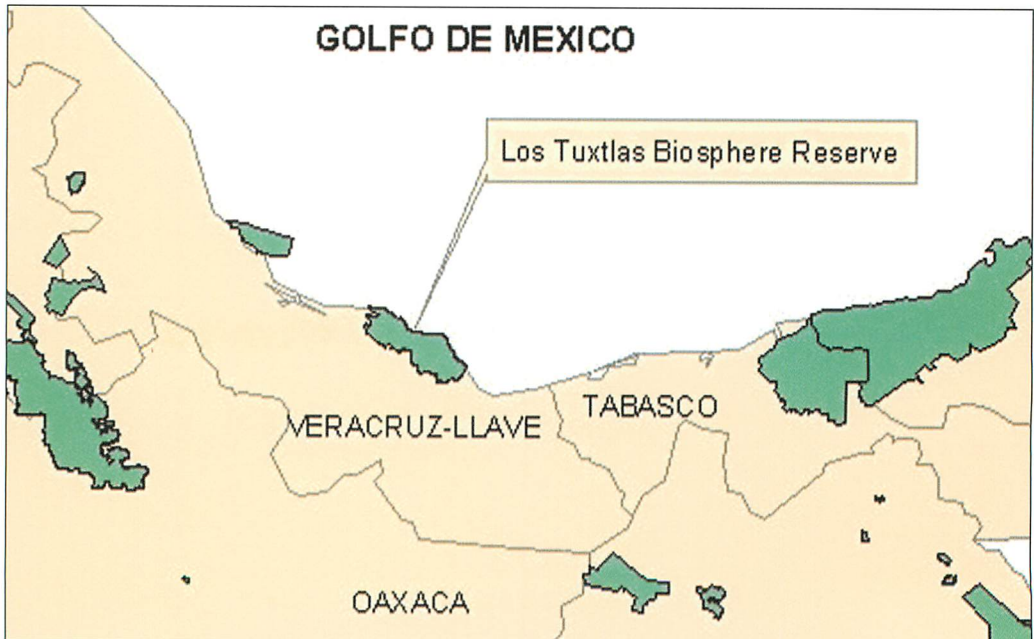
Abb. 1. Lage des Biosphärenreservates Los Tuxtlas am Golf von Mexiko. Grün hervorgehoben sind Biosphärenreservate und Naturschutzgebiete.