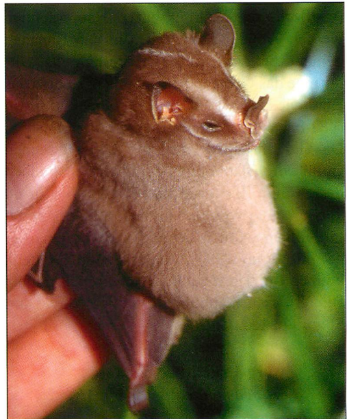
Abb. 14. Trächtiges Weibchen der Gemeinen Gelbohrfledermaus ( Uroderma bilobatum ).

Die Nahrung dieser von Mexiko bis Bolivien und Ost-Brasilien verbreiteten Art besteht hauptsächlich aus Früchten, daneben werden in geringen Anteilen auch Insekten, Blüten