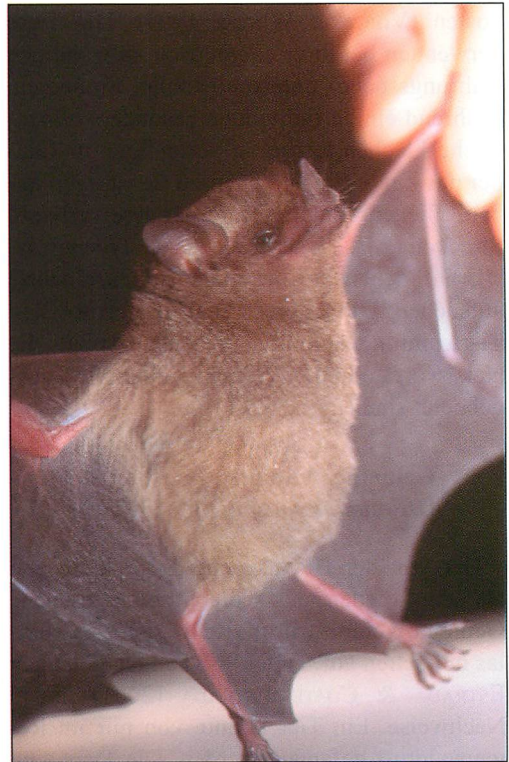
Abb. 18. Glossophaga soricina ist gut an der V-förmigen, von kleinen Warzen eingefassten Einkerbung in der Mitte der Unterlippe zu erkennen. Sie ist eine der wichtigsten Blüten bestäubenden Fledermausarten Mittelamerikas.