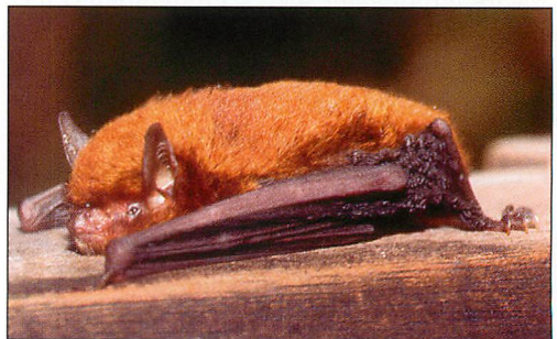
Abb. 19. Keays's Mausohr ( Myotis keaysi ) ist die einzige in der Region Los Tuxtlas auftretende kleine Myotis -Art.

Keays's Mausohr ist im Verhältnis zu vielen anderen kleinen Myotis -Arten (Gewicht 4 – 6 Gramm) Mittelamerikas auch unter Feldbedingungen während der Nacht gut zu bestimmen. Die Schwanzflughaut der Tiere, Beine und angrenzende Flughäute sind auch unterhalb des Knies leicht aber deutlich behaart. Die Art ist im Tiefland Mittelamerikas weit verbreitet und meist nicht selten (REID 1997). Die Tiere jagen niedrig über Wegen im Wald, auf Lichtungen oder über kleinen Bächen nach Insekten. Mit 9 Individuen war Keays's Mausohr die zweithäufigst gefangene Art, sie trat an allen drei Standorten auf.