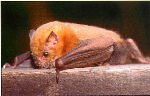
Abb. 17. Bei alten Männchen der Kleinen Gelb-schulter-Blattnase ( Sturnira lilium ) kann die Namen gebende Schulterzeichnung noch stärker ausgeprägt sein.

Die Art ist im Tiefland bis in eine Höhe von 700 m üNN vom nördlichen Mexiko bis nach Uruguay und dem nördlichen Argentinien verbreitet (REID 1997) und in den meisten Gebieten eine der häufigsten, wenn nicht sogar die häufigste Fledermaus (z.B. ESTRADA & COATES-ESTRADA 2001, PASSOS et al. 2003, CRUZ-LARA et al. 2004, GALINDA-GONZÁLEZ 2004, LOU & YURRITA 2005), so auch während meiner Fänge. Die Tiere ernähren sich hauptsäch-