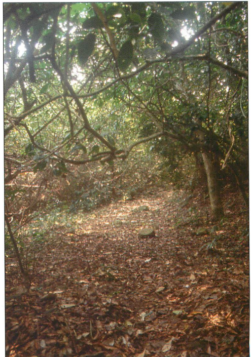
Abb. 5. Fangplatz über einem Weg im Regenwaldrest.