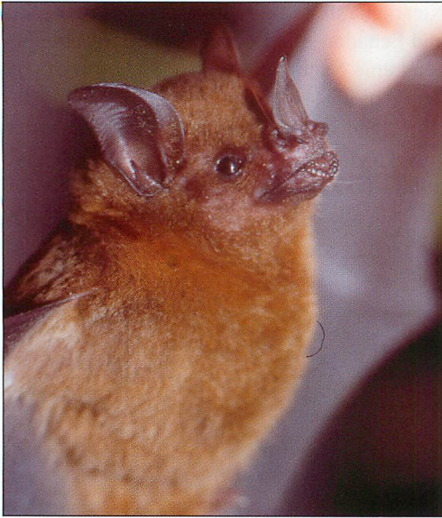
Abb. 11. Die meisten Individuen von Seba's Brillenblattnase ( Carollia perspicillata ) sind beige bis hellbraun gefärbt. Solch orange gefärbten Tiere verbringen den Tag in schlecht durchlüfteten Quartieren, in denen durch die Zersetzung des Fledermauskotes Ammonium-Dämpfe entstehen, die das Haarkleid bleichen (WAINWRIGHT 2002).