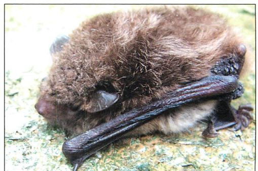
Abb. 1. Männchen der Wasserfledermaus ( Myotis daubentonii ) aus einem Fledermauskasten im Revier Möllenkamp am 23.VIII.2005.

Im Untersuchungsgebiet bestehen 14 Fledermauskastenreviere mit 305 Fledermauskästen (FKä). Es werden die jährlichen 4 bis