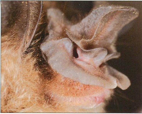
Abb. 2. Nasenaufsatz der Bourret-Hufeisennase mit der stark verlängerten Sella.

Schallbündelung zu erzielen, ohne durch eine weitere Vergrößerung mögliche Nachteile zu verursachen. Die deutliche Reduktion der Nasenblätter lässt sich ebenfalls mit der Bündelung der Schallkeule erklären.