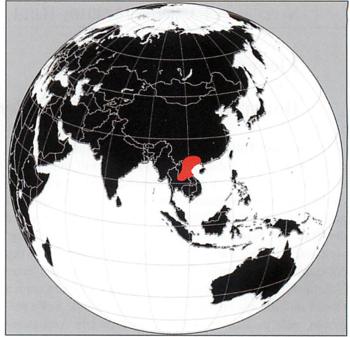
Abb. 3. Verbreitung der Bourret-Hufeisennase.

Bleibt nur zu hoffen, dass es für diese spektakuläre Art mit ihrer ungewöhnlichen Anpassung auch in Zukunft noch Lebensräume in südost-asiatischen Primärwäldern geben wird!