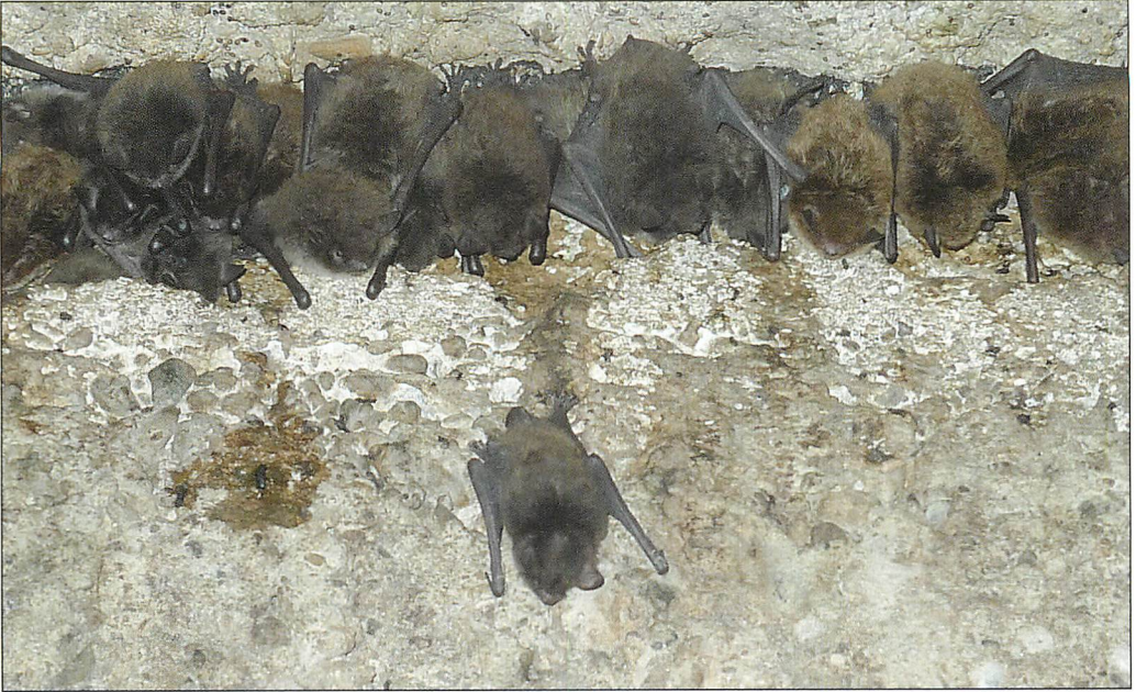
Abb. 5. Mehrere Wasserfledermaus-♀♀ mit flügge gewordenen Jungtieren. Datum: 7.VII.2010

Unter dem 7.VII. konnte die Höchstzahl an sich im Tunnel aufhaltenden Wasserfledermäusen festgestellt werden; die nunmehr flüggen Jungtiere ließ die Wochenstube auf 294 Ex. anwachsen (Abb. 6).