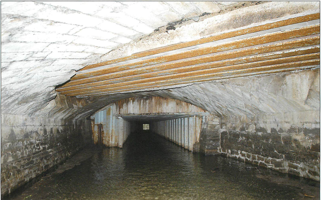
Abb. 3. Blick gegen die Fließrichtung zum 90 m weit entfernten Mundloch. An den Haupthangplätzen der Wasserfledermäuse (Betonelemente und Schalhhölzer) sind Sekretpuren der Vorjahrespopulation erkennbar.

bogengewölbtes, in Sandsteinquadern ausgeführtes Brückenbauwerk, welches die „Neue Exter“ überspannte. Die Gewölbebrücke ist in den neu geschaffenen Wasserlauf integriert