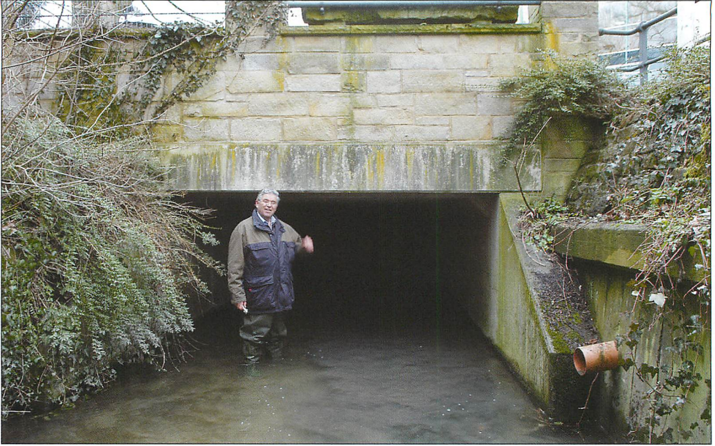
Abb. 2. Bachdurchfluss der „Neuen Exter“. Betongefasstes Mundloch des Wassereinlaufs.

Bach unter den Verkehrsflächen hindurch der Weser zuführt. Für die bis 1969 hier verkehrende „Extertalbahn“ (s. REINEKING 1970) bestand seit Mitte der 1920er Jahre ein rund-