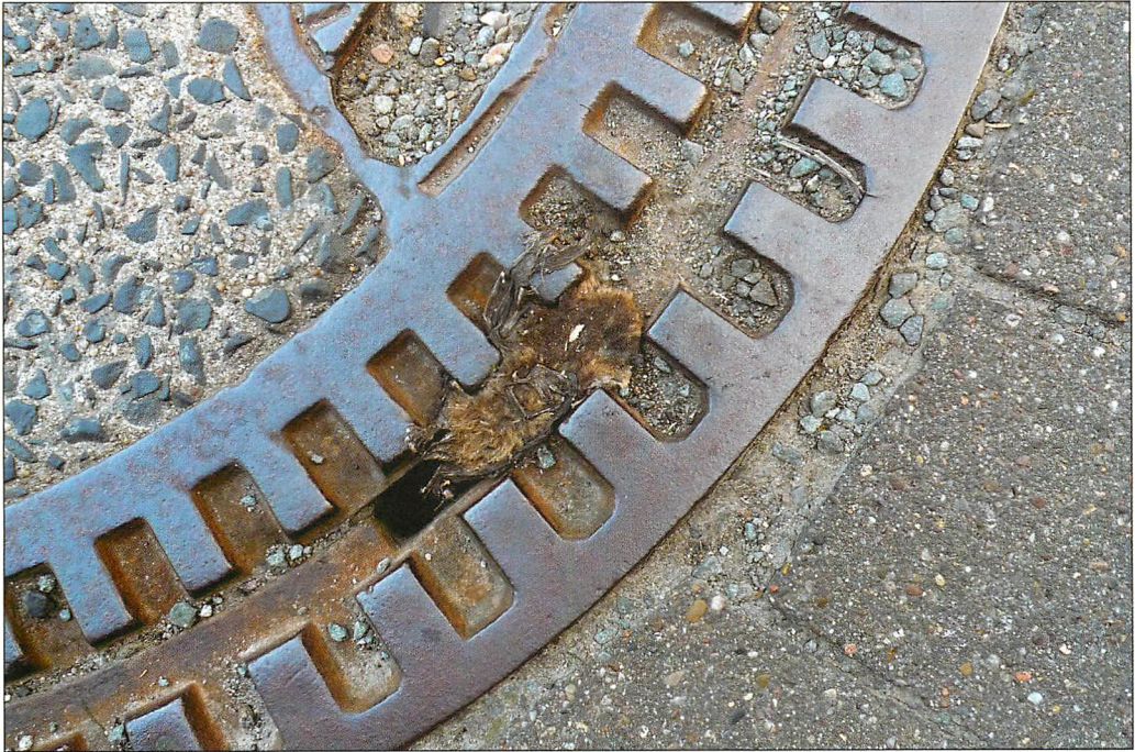
Abb. 8. Übertägige Situation im Bereich der Gulli-Öffnung: Eine Wasserfledermaus als „Verkehrsoffer“ nach dem Verlassen des Quartiers.

Als Ein- und Ausflug für die Fledermäuse fungiert zum einen der Ein- bzw. Ausfluss des Wasserlaufs, zum anderen befinden sich im Gussdeckel des sog. 2. Gullis vier schmale Revisionsöffnungen. Diese werden von den Tieren genutzt, zumal sich an der Deckelunterseite oft die besagte kopfstärke Gesellschaft befindet. Mindestens ein Individuum kam unmittelbar nach Verlassen des Quartiers als Verkehrsoffer zu Tode (Abb. 8).