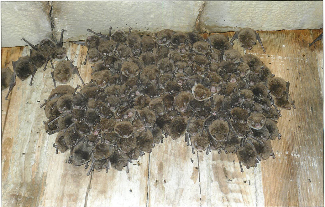
Abb. 6. Clusterartige Ansammlung eines Teils der Wochenstubengesellschaft am Schalholz.

Mit kontinuierlich abnehmender Individuenzahl nach dem Flüggewerden ab Mitte/Ende Juli stagnierte der Bestand etwa ab 10.VIII. bei rund 100 Individuen (ähnlich den Bestandszahlen im Juni). Die endgültige Auf-