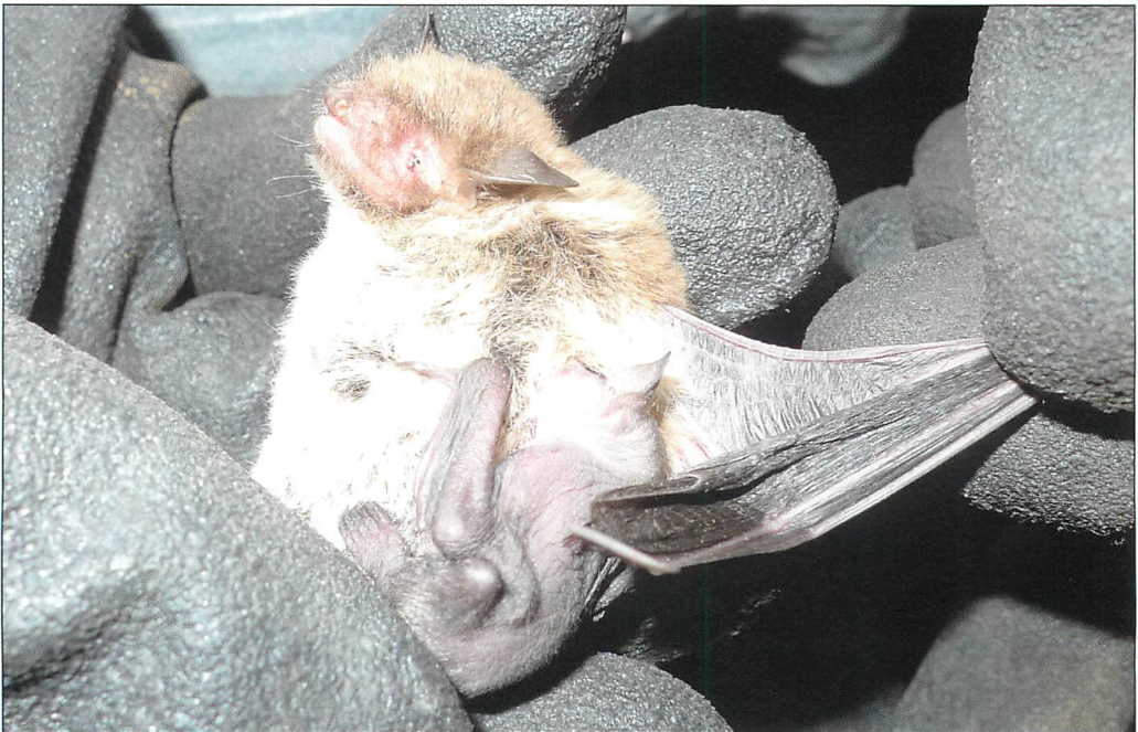
Abb. 4. Dokumentierter Jungtier nachweis in der untertägigen Wasserfledermaus-Kolonie. Datum: 9.VI.2010.

von einer umfangreichen Trächtigkeits- und Geburtenkontrolle vor und nach diesem Termin abgesehen worden (Abb. 4, 5). Auch hernach sind die Tiere ohne direkten menschlichen Kontakt geblieben. Im Vordergrund der Quartierkontrollen stand die größtmögliche Schonung der Wochenstubengesellschaft, nicht zuletzt auch im Hinblick auf die Unberührtheit des Vorkommens vor den noch durchzuführenden Sanierungsmaßnahmen am Bauwerk.