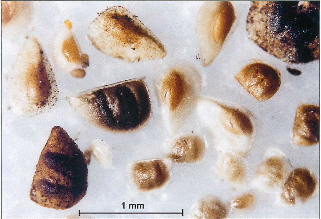
Abb. 3. Neben den Flottoblasten der Moostierchen schwimmen auch die Dauereier verschiedener Wasserfloharten in riesiger Zahl auf den Wasseroberflächen und bilden dort einen dünnen Belag auf den windabgewandten Seiten von stehenden Gewässern.