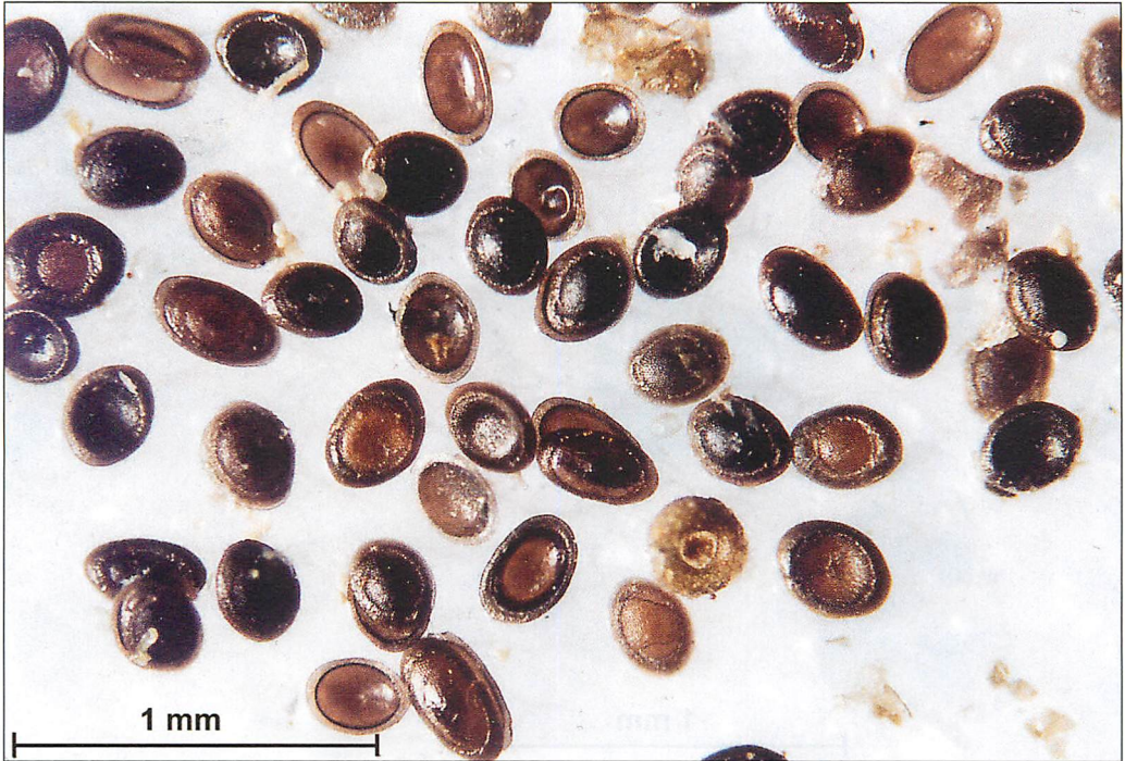
Abb. 2. In großer Zahl schwimmen Flottoblasten der Moostierchen auf der Wasseroberfläche vieler stehender Gewässer und können so von Wasser- oder Teichfledermäusen beim Jagen mit verschluckt werden.

delt, die an der Wasseroberfläche von kleinen Tümpeln und Teichen treiben.