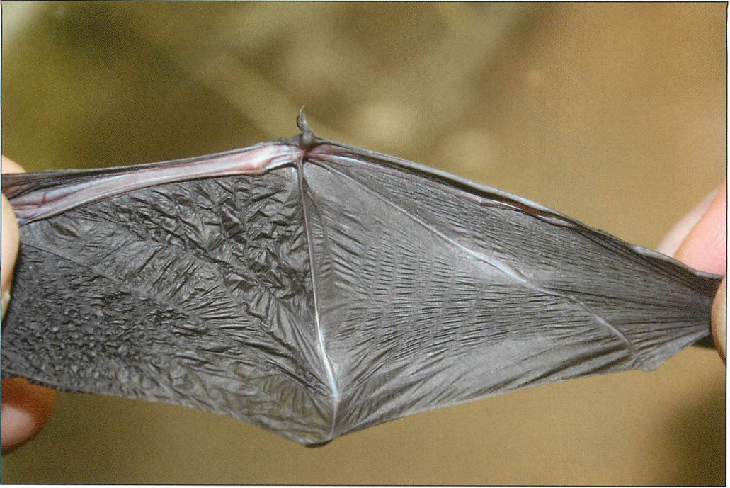
Abb. 3. Rachitische Verwachsungen am linken Flügel einer jungen Zwergfledermaus ( Pipistrellus pipistrellus ).

Wohnbezirk gefunden wurden. Die Ursachen aber, die zu diesen Verletzungen geführt haben, sind leider völlig ungeklärt.