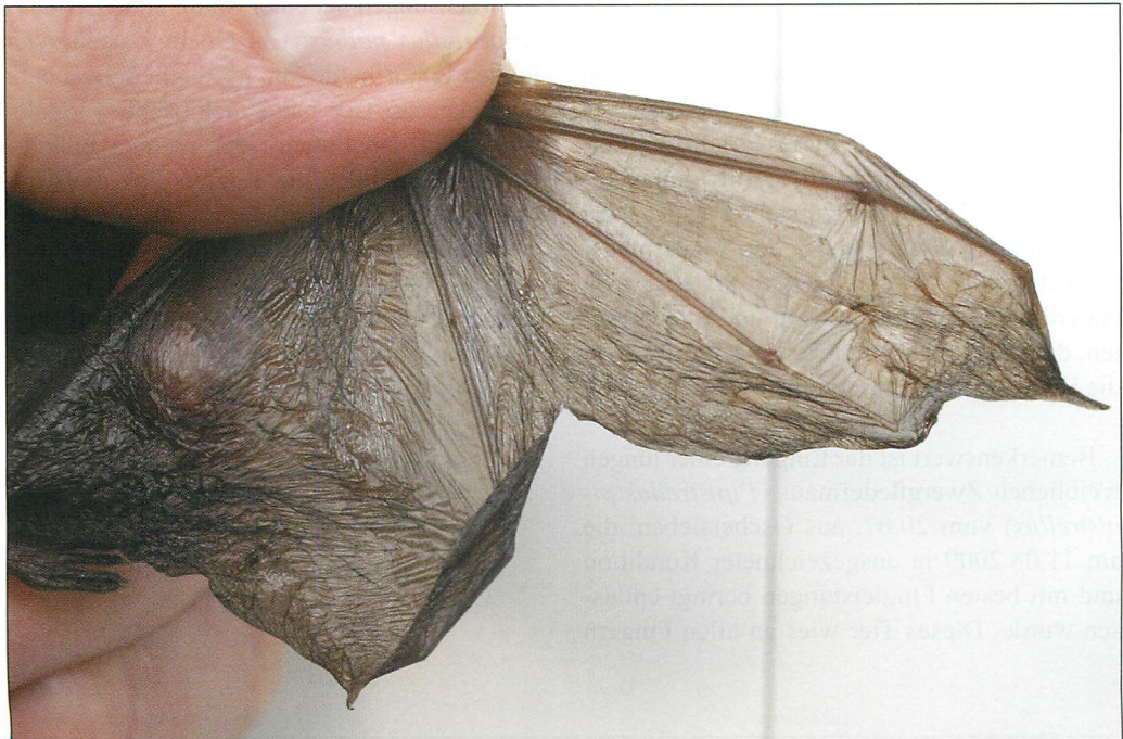
Abb. 2. Zustand desselben Flügels der Wasserfledermaus am 16.04.2009.