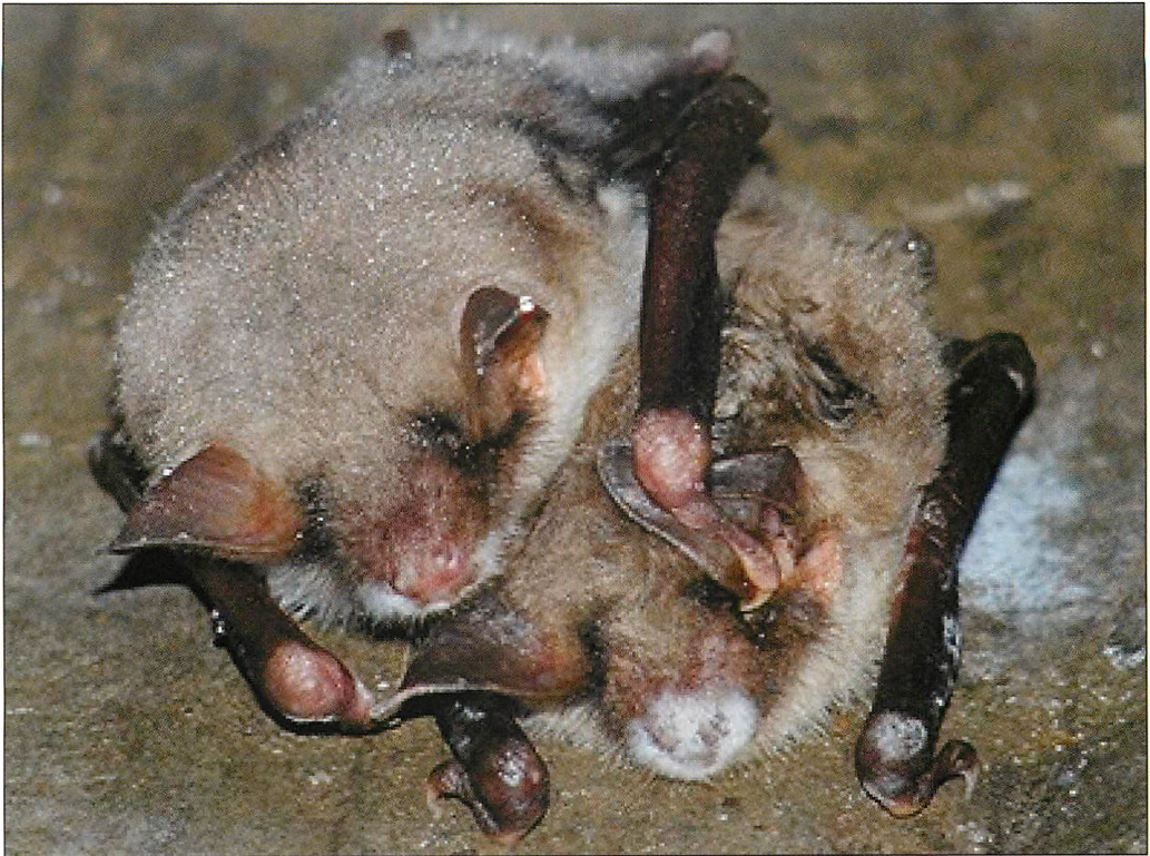
Abb. 1. Zwei Große Mausohren ( Myotis myotis ) mit dem charakteristischen Bild einer Besiedlung mit dem Pilz Geomyces destructans .

Fledermäuse am so genannten Weißnasensyndrom (WNS, BLEHERT et al. 2009, USFWS 2009, ALEY 2010). Charakteristisches Kennzeichen sind kleine weiße Polster flaumartigen Pilzbefalls seitlich der Nase und auf den Flughäuten, welches letztendlich zur Namensgebung führte (Abb. 1). Im Jahr 2006 wurden erstmals Fledermäuse mit typischem Pilzbefall in einer bei Touristen beliebten US-amerikanischen Höhle im Bundesstaat New York bemerkt. Seitdem hat sich WNS rasch auf die angrenzenden nordöstlichen US-Bundesstaaten ausgebreitet und inzwischen auch die Grenze zu Kanada (Ontario und Quebec) überschritten (FRICK et al. 2010) (Abb. 2). Mittlerweile sind mehr als eine Million Fledermäuse durch WNS gestorben (ALEY 2010, USGS 2009). Mindestens sieben verschiedene Fledermausarten sind bisher vom WNS betroffen (GARGAS et al. 2009, TURNER & REEDER 2009, MATTESON 2010; Systematik und Namensgebung nach BARBOUR & DAVIS 1969, BANFIELD 1974):