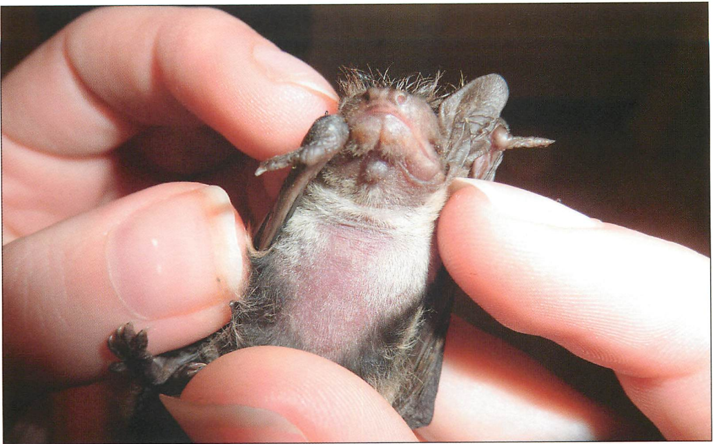
Abb. 2. Pflegling mit abklingendem Haarsausfall. Kurz nach Nahrungsumstellung wachsen die Haare wieder nach.