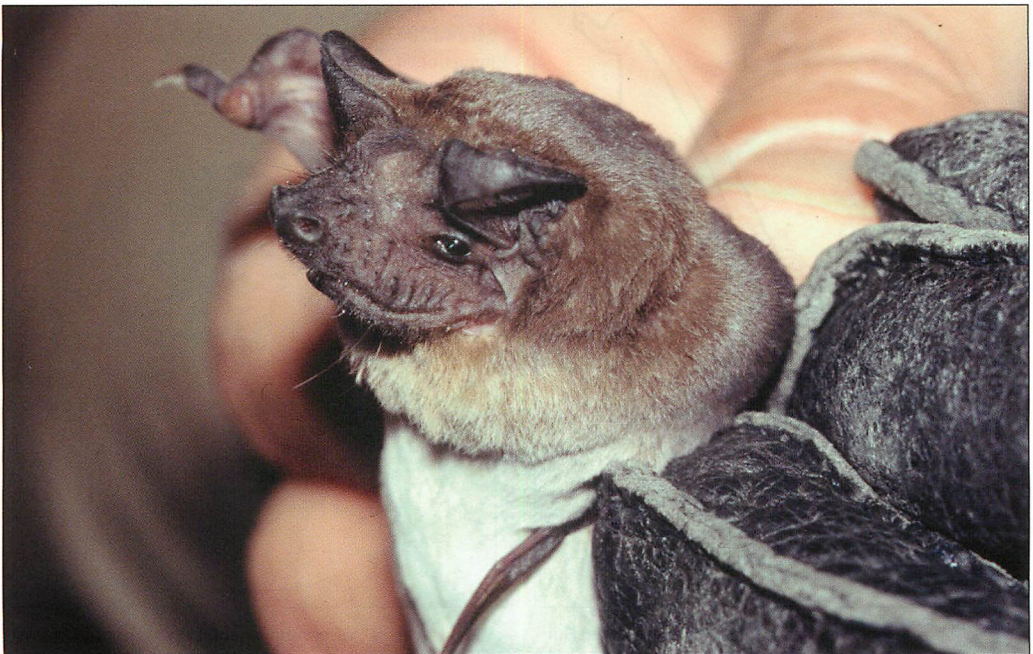
Abb. 2. Eine Angola-Bulldoggfledermaus aus einer Brückendehnungsfuge am Malawisee (Malawi).