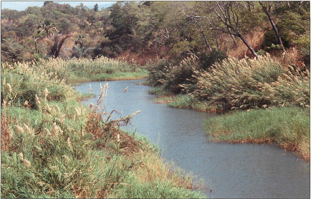
Abb. 5. Jagdgebiet von Angola-Bulldoggfledermäusen: eine versumpfte Flussmündung am Malawisee (Malawi).

Viele Hundert Individuen können in derartigen Verstecken, oft „dicht gepackt“, den Tag verbringen. Immer wieder teilen Angola-Bulldoggfledermäuse sich solche Unterkünfte mit anderen Arten, etwa mit der Zwerg-Bulldoggfledermaus ( Chaerephon pumilus ). Die Kolonien mögen nicht nur durch ihr andauerndes, hohes Gezeter auf sich aufmerksam machen, sondern meist verrät ihr durchdringender, an Fenchel erinnernder „Moschus-Geruch“ solch eine Fledermausgesellschaft. Dies und der Kot machen sie oft zu ungeliebten Untermietern von bewohnten Häusern. Noch in der Dämmerung verlassen die Tiere einer Kolonie in Pulks ihr Quartier, offenbar eine Strategie, um möglichen Feinden, wie dem Fledermaushabicht ( Macheiramphus alcinus ) die Jagd auf sie zu erschweren. Die Ortungsrufe ausfliegender Angola-Bulldoggfledermäuse können von vielen Menschen wahrgenommen werden. Die schwach frequenzmodulierten Rufe reichen nach HAUGE (2010) bis unter 18 kHz, nach anderen Autoren (TAYLOR 2000, MONADJEM et al. 2010) liegt die dominante Frequenz allerdings bei 24 kHz.