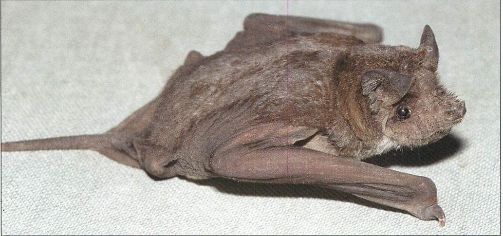
Abb. 1. Eine Angola-Bulldoggfledermaus ( Mops condylurus ) aus dem Dach eines Touristen-Bungalows am Kariba-Stausee (Binga, Simbabwe).

und Subtropen der Alten und Neuen Welt weit verbreiteten Fledermausfamilie „ Molossidae “. Eine dieser Arten, die Europäische Bulldoggfledermaus, Tadarida teniotis , geht weiter nach Norden und erreicht sogar die Schweiz.