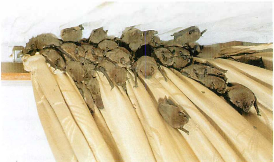
Abb. 1. Eine Gruppe der Invasion vom 23. VIII. 1993 in Münster mit 245 Zwergfledermäusen – a group of the invasion at 23. VIII. 1993 in Münster with 245 Pipistrelle.