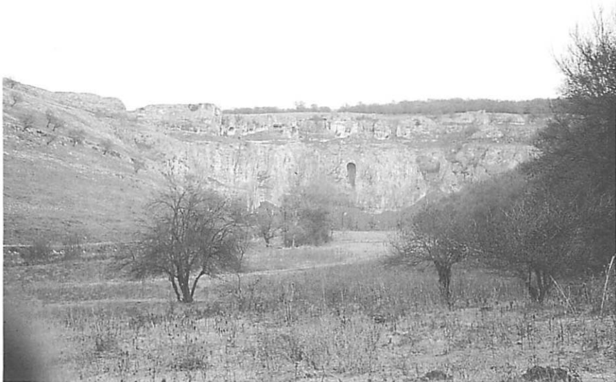
Abb. 3. Blick auf die Felswand „Bjalata stena“ („Die weiße Wand“) im Gebiet des Flusses Malki Lom. In diesem Gebiet jagte der Adlerbusard auf Abendsegler.

Während der oben beschriebenen Tagflüge der Abendsegler wurde mehrmals beobachtet, daß Turnfalken ( Falco tinnunculus ) kein Interesse daran fanden, Abendsegler zu jagen.