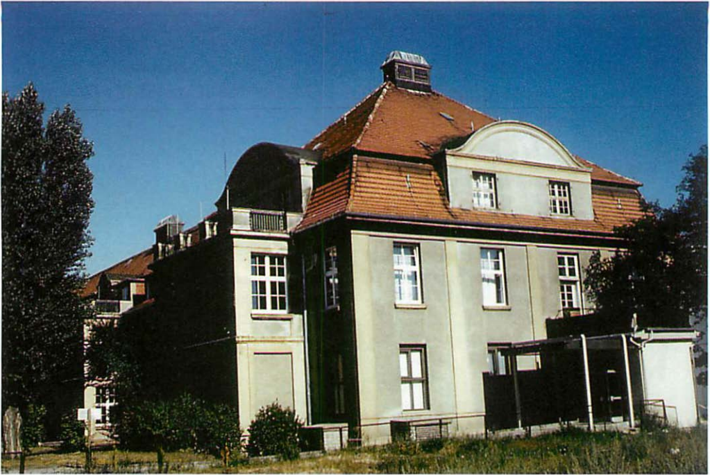
Abb. 2. Chirurgische Kinderklinik - Die Einflüge der Zwergfledermäuse lagen in den Fenstern der oberen Etage und des Dachbereiches.

mäßig treten diese in Bereichen des UNI-Klinikums zwischen Schillingallee/Strempelstraße auf, in denen mehrere Sommer-, Zwischen-, \sigma - und ein Winterquartier von Zwergfledermäusen bekannt sind (Abb. 1). Die Gebäude sind vorwiegend Altbausubstanz. ZÖLLICK (1980) schreibt über die Fledermausinvansionen im Stadtgebiet Rostock und erwähnt bereits eine Invasion in der Neuen Medizinischen Klinik (UNI), Heydemannstraße vom 3.IX.1973 (30 Indiv.). Die stärkste Invasion wurde von ZÖLLICK (1980) aus dem Jahr 1976 mit 121 Indiv. angegeben. Die letzten Invasionen wurden durch den Verfasser in den Jahren 1990 mit 14 Indiv. und 1993 mit 21 Indiv. festgestellt.