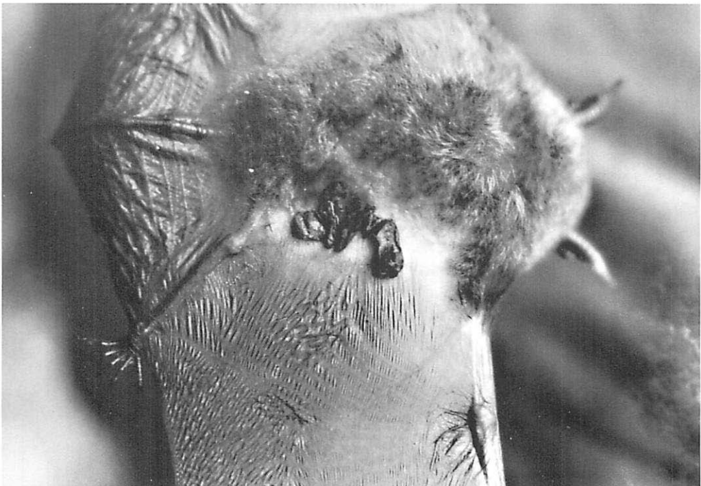
Abb. 1. Teerklümpchen an einem Mausohr ( Myotis myotis ).

Im dritten, erst kürzlich passierten Fall hat das betreffende Tier, ein Zwergfledermaus-♀ ( Pipistrellus pipistrellus ),