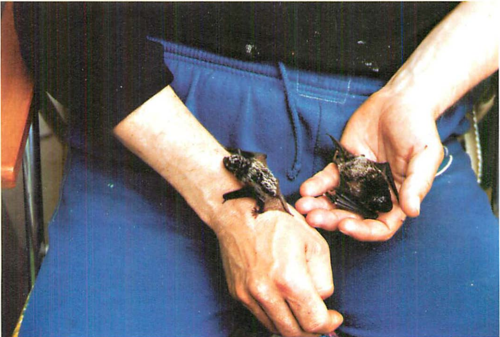
Abb. 1. Zweifarbfledermäuse: Mutter mit 6wöchigem Jungtier (l.) am 23.V.1997. Beim Muttertier sind rechts am Flügel die entzündeten Gelenke nach fast vollständig geglyckter Ausheilung sowie rechts am Körper eine Kahlstelle als Nebenwirkung der Antibiotika-Spritzung erkennbar.

Zufallsfunde einzelner Exemplare der Zweifarbfledermaus gelangen während der zurückliegenden Zeit in vielen Teilen Berlins, vor allem in den letzten Jahren und beson-