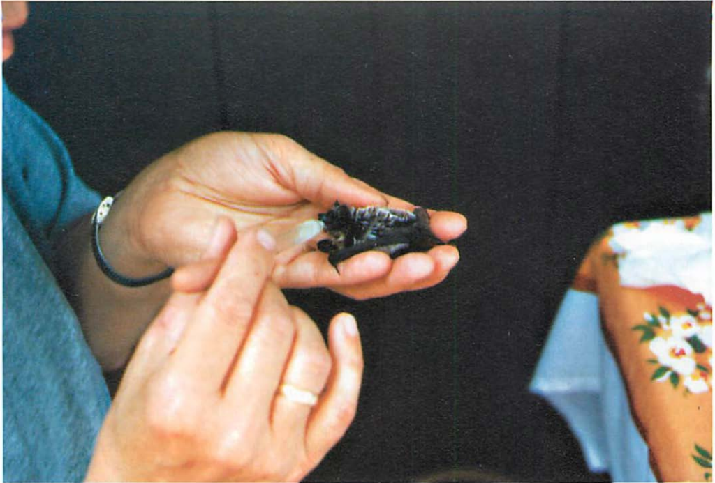
Abb. 2. Zweifarbfledermaus: Das 6wöchige Jungtier erhält eine künstlich zubereitete Nahrung aus der Puppen-Nuckelflasche.