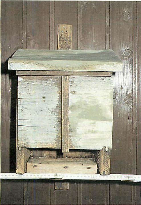
Abb. 3. Im Zoo Augsburg vorhandenes Original eines Issele-Kastens.

Bayerischen Umweltministeriums die erste Rote Liste der im Freistaat gefährdeten Fledermausarten.