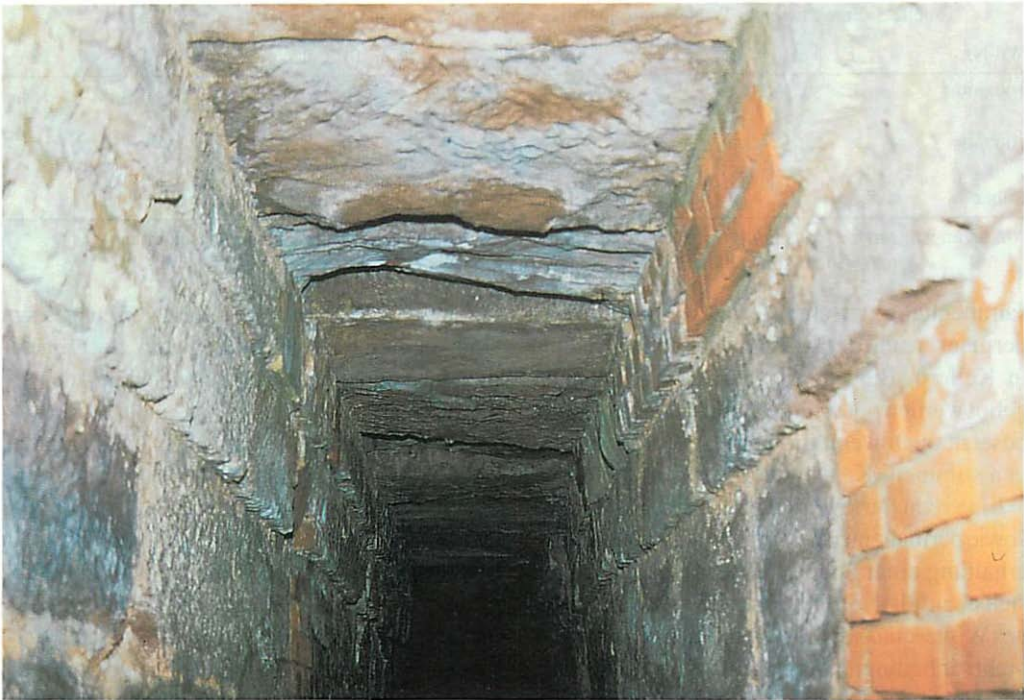
Abb. 5. Die Vielfalt an Spaltenverstecken ist ein wichtiges Kriterium für die Annahme von Wasserdurchlässen (Wd 12).

jedoch einige Nachweise in der Übergangszeit und im Sommer (Tab. 1). Weiterhin befand sich eine Fransenfledermaus in einer Mauerspalte der Brückenreste am Heider Weg (2.V.1999).