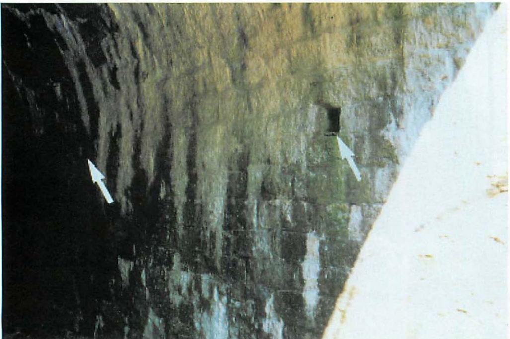
Abb. 2. Die seitlichen Wasserablauflöcher (Pfeile) der Unterführung U2 sind Verstecke für die Wasserfledermaus.

Verstecke für die Wasserfledermäuse (Abb. 2). 1994 wurde ein langer, bequem zu begehender Stollen entdeckt, der einen Bach durch den Bahndamm und unter eine parallel verlaufende Straße leitet. Darin befanden sich bei einer ersten Winterkontrolle (7.I.1995) zwei Braune Langohren. Daraufhin wurde die ehemalige Bahntrasse auf einer Länge von 16 km abgesucht und alle Durchlässe erfaßt. Es wurden weitere 19, durchweg kürzere und niedrigere