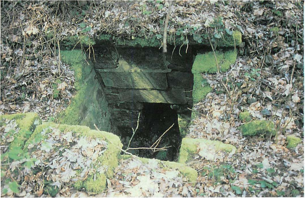
Abb. 3. Wasserauffangbecken reduzieren den Luftdurchzug (Wd 6).