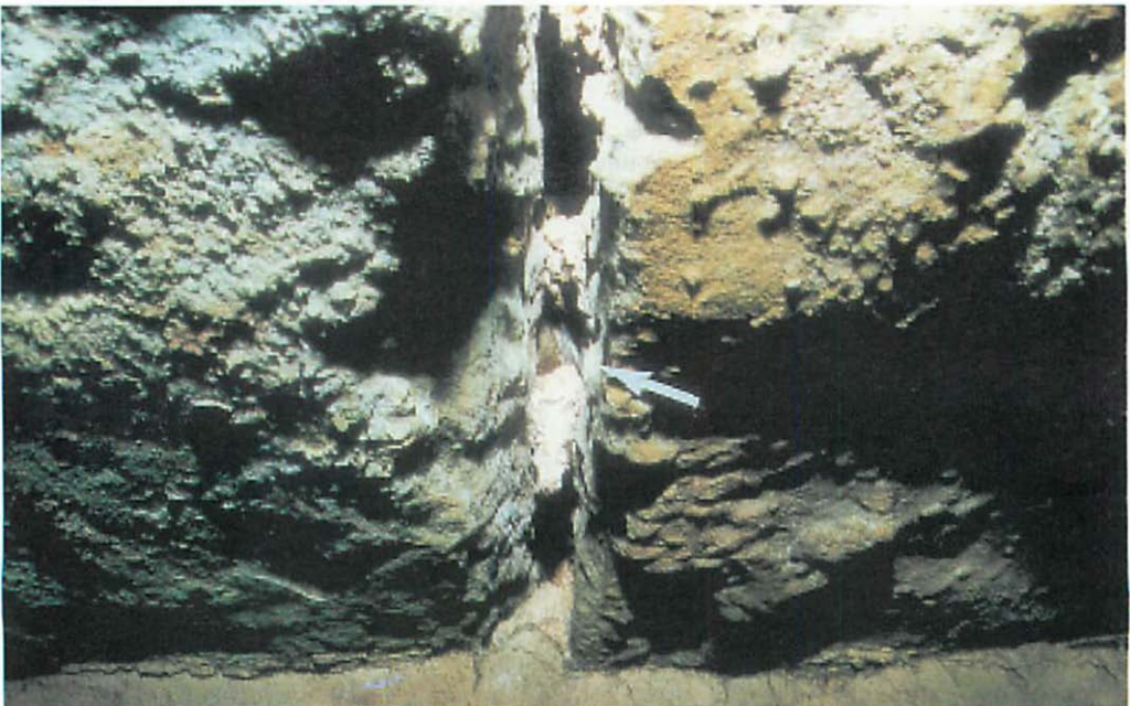
Abb. 6. Eine gut versteckte Fransenfledermaus in einer Deckenspalte.

Das Aufsuchen versteckter Hangplätze (Abb. 6) könnte überdies dem Schutz vor möglichen Prädatoren dienen (KLAWITTER 1976). BEKKER & MOSTERT (1991) stellten fest, daß sich in öffentlich zugänglichen (gestörten) Winterquartieren - im Vergleich zu solchen, die für die Öffentlichkeit gesperrt sind - Wasserfledermäuse bevorzugt versteckte Hangpositionen suchten und interpretierten dieses Verhalten als Meidestrategie gegen den Zugriff durch potentielle Räuber. Die hier gemachten Beobachtungen deuten ebenfalls in diese Richtung. Lediglich ein einzelnes an der Seitenwand hängendes Braunes Langohr wurde in den Durchlässen 12 und 14 beobachtet, in denen der kontinuier-