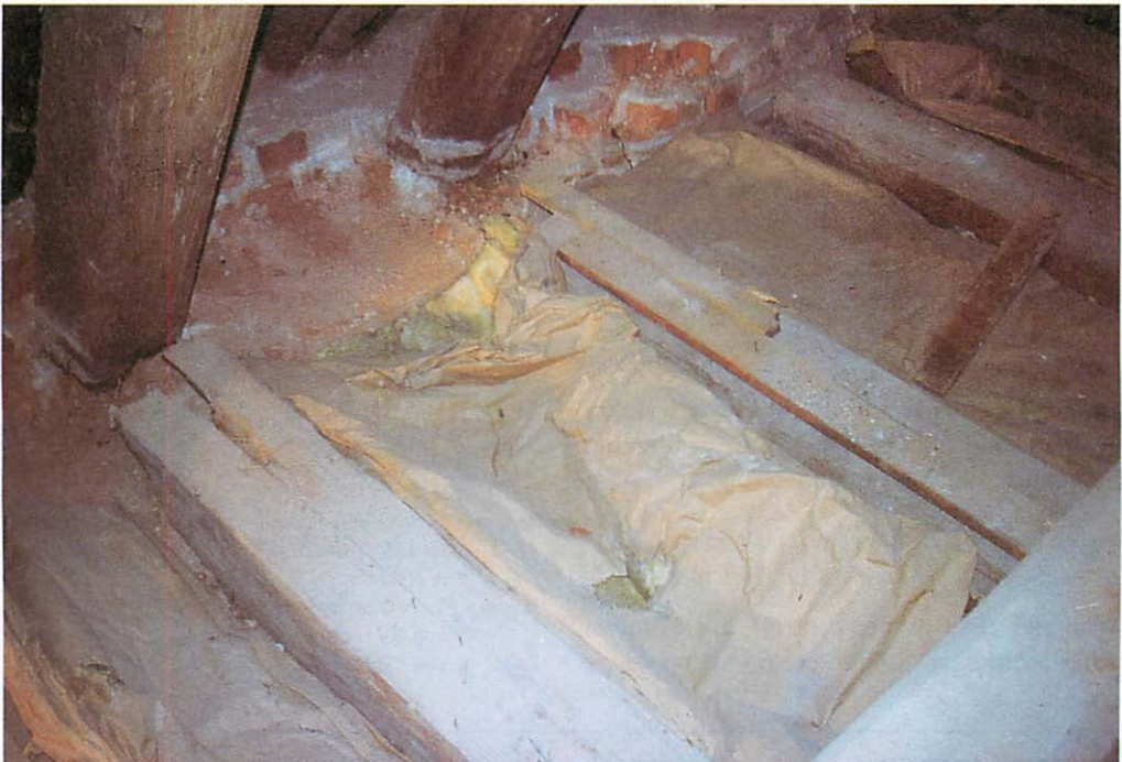
Abb. 1. Blick in den Fehlboden der Kirche Lauterbach nach dem Entfernen des Fußbodens. Das verpackte Isoliermaterial befindet sich noch zwischen den Deckenbalken.

Da die Möglichkeit bestand, auf weitere Fledermäuse zu stoßen, wurde bei dem bereits geöffneten Fehlboden unverzüglich unter dem bis dahin noch nicht angetasteten Isoliermaterial nachgesehen. Tatsächlich befanden sich dort weitere 6 Breitflügelfledermäuse, die z.T. schon recht munter waren. Außerdem konnte die Mumie eines Grauen Langohrs ( Plecotus austriacus ) sichergestellt werden.