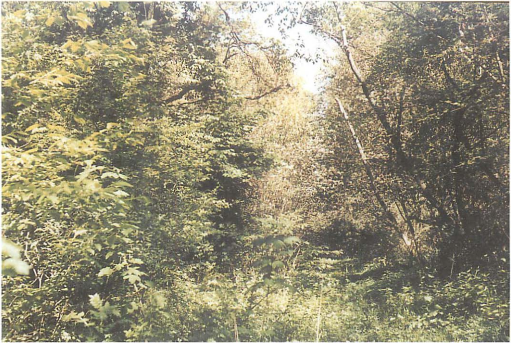
Abb. 2. Typischer Aspekt des Laubmischwaldes im Friesacker Zootzen zur Zeit der Blüte der Traubenkirsche ( Prunus padus )

europäischen Flachlandes (FISCHER et al. 1982).