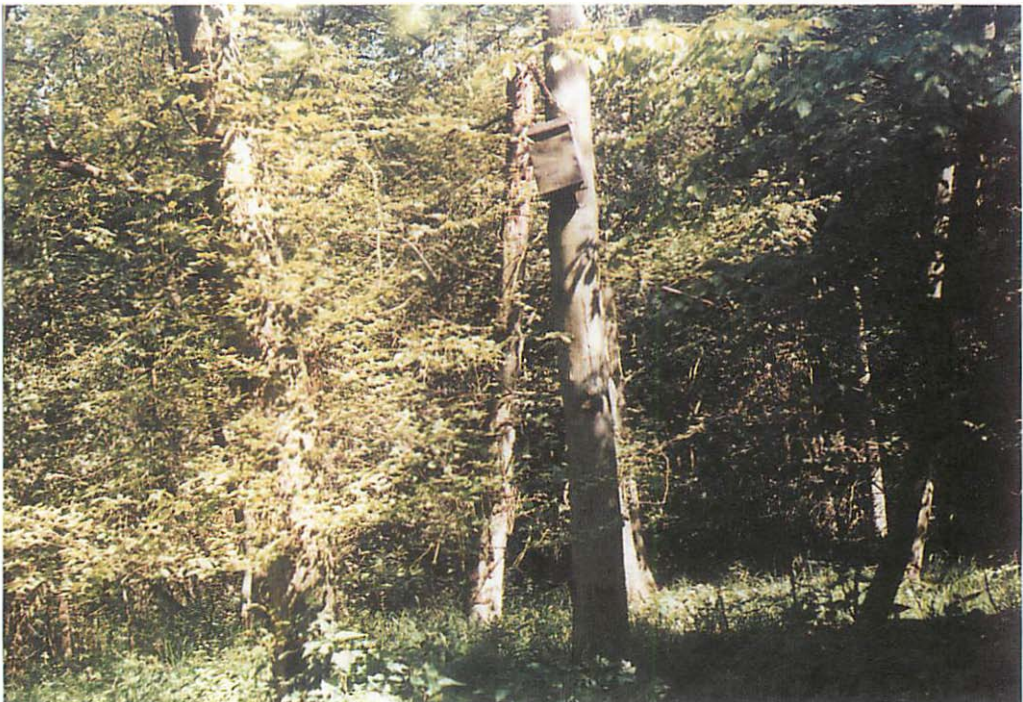
Abb. 1. Ein von den Fransenfledermäusen ( Myotis nattereri ) bevorzugt genutzter Kasten an einer lichten Stelle im Friesacker Zootzen.

mensetzt. Neben den beiden namensgebenden Arten sind Rotbuche ( Fagus sylvestris ), Esche ( Fraxinus excelsior ), Bergahorn ( Acer pseudo-platanus ), Winterlinde ( Tilia cordata ), Sommerlinde ( Tilia platyphyllos ), Flatterulme ( Ulmus laevis ), Bergulme ( Ulmus glabra ), Traubenkirsche ( Prunus padus ) und Wildapfel ( Malus sylvestris ) vertreten. Die üppige Strauchschicht wird neben der Haselnuß ( Corylus avellana ) vor allem durch den Jungwuchs der Bäume gebildet. In den letzten Jahren dringt verstärkt die Spätblühende Traubenkirsche ( Prunus serotina ) ein. Die Bodenflora enthält die Mehrzahl der Arten eutropher Laubmischwälder des mittel-