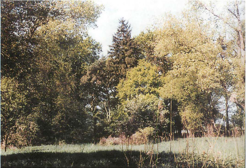
Abb. 4. Kleine Hochstaudenflur und Uferbestockung am Rhin, einem natürlichen Fluß an der Waldkante (unter anderem mit ortsfremder Fichte)

Rauhhaufledermaus ( Pipistrellus nathusii ), Große Bartfledermaus ( Myotis brandtii ), Mausohr ( Myotis myotis ), Abendsegler ( Nyctalus noctula ), Kleinabendsegler ( Nyctalus leisleri ) und Wasserfledermaus ( Myotis daubentonii ) festgestellt werden. 1990 fanden sich die ersten Fransenfledermäuse im Revier ein. Es waren 2 ♂♂ und 2 ♀♀. 1993 wurde die erste Wochenstubengesellschaft festgestellt, die aus mindestens 17 ad. ♀♀ bestand und sich gegenwärtig bei etwas über 40 ♀♀ eingeordnet hat (Tab. 1).