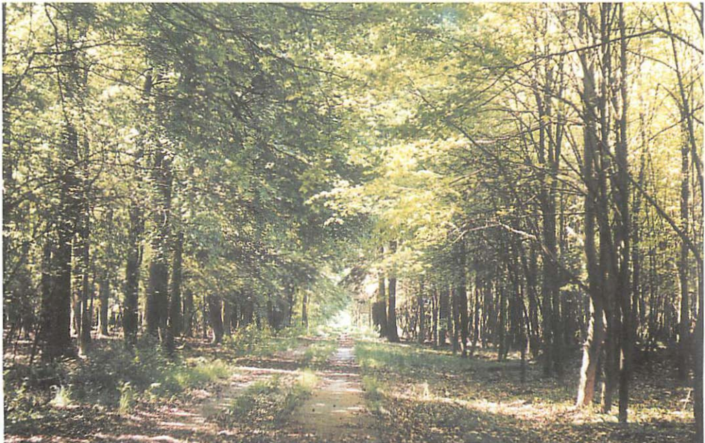
Abb. 3. Befestigter Forstweg in Friesacker Zootzen mit links angrenzender Stieleichen-Buchen-Bestockung und rechts einem Bergahorn-Linden-Stangenholz mit Stieleiche

waren Braune Langohren ( Plecotus auritus ), die dort bis heute mit zwei Wochenstubengesellschaften vertreten sind. Außerdem konnten Zwergfledermaus ( Pipistrellus pipistrellus ),