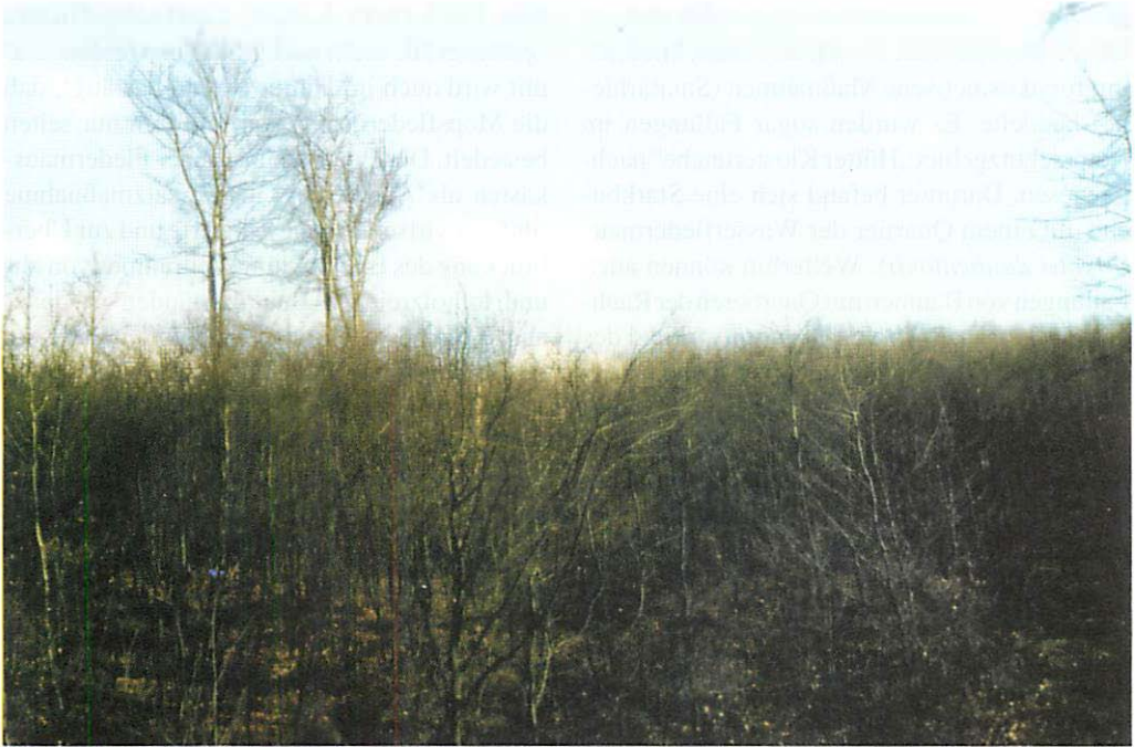
Abb. 14. Blick aus 10 m Höhe über einen Bearbeitungsbereich im nordwestlichen Teil des Hütter Wohlds. Bis auf einzelne Überhälter wurden hier die Altbuchenbestände gefällt und damit die ermittelten Fledermausquartiere zerstört. In diesen Gebieten sind nur noch Jungholzbestände vorhanden.