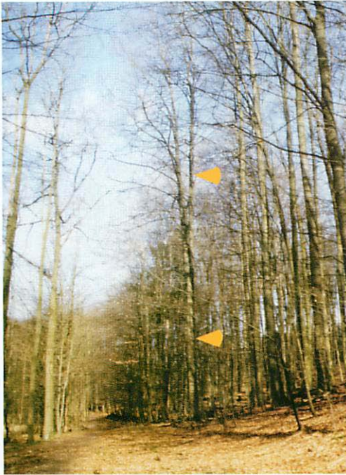
Abb. 8. Das Quartier Q9 wurde in einer Rotbuche am Rande eines Buchenbestandes, direkt an einem Wanderweg im Bereich der Teichkette, gefunden. Der Pfeil weist auf den Quartierbaum.