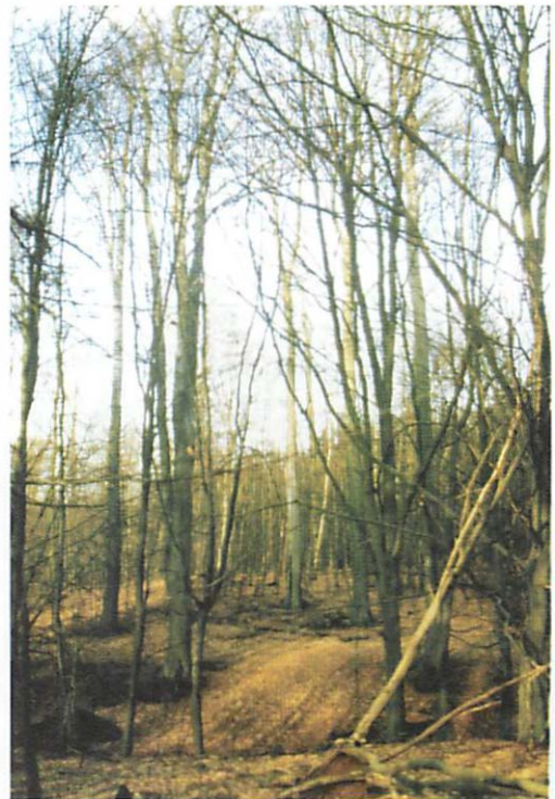
Abb. 12. Der Hütter Wohld mit seinen charakteristischen 120-170 jährigen Altbuchenbeständen. Aufnahme aus dem Jahr 1991 vor der forstwirtschaftlichen Nutzung.

ten Winterquartiere, die sich ausschließlich in Gebäuden befinden und die im Hütter Wohld gefundenen Baumquartiere der Wochenstubengemeinschaft möglich. Laut Fauna-Flora-Habitat-Richtlinie 92/43/EWG des Rates vom 21. Mai 1992, zum Erhalt natürlicher Lebensräume sowie der wildlebenden Tiere (FFH-Richtlinie der Europäischen Union), ist die Mopsfledermaus ( B. barbastellus ) in Anhang II aufgeführt. Damit ist das Land Mecklenburg-Vorpommern verpflichtet, zum Erhalt der Art Schutzgebiete auszuweisen. Deshalb wurde der Hütter Wohld im Jahr 2000 durch die Naturschutzverbände Naturschutzbund Deutschland & Bund für Umwelt und Naturschutz Deutschland in die Publikation „Defizitanalyse der Meldung von FFH-Gebieten des Landes Mecklenburg-Vorpommern und Ergänzendes Kohärentes Ökologisches Schutzgebietsnetz - Natura 2000“ für Mecklenburg-Vorpommern - aufgenommen (NABU & BUND 2000). Mit dieser Publikation wurde bei der EU-Kommission Beschwerde eingereicht, um die Sicherung des in der FFH-