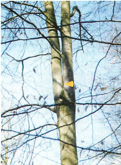
Abb. 9. Das Quartier Q9 befindet sich in 15 m Höhe im Zwiesel der Rotbuche. Der Pfeil weist auf den Quartierbereich. Das Quartier ist stark dem Regenablaufwasser ausgesetzt.

Die Eiche ist über dem Wurzelbereich bereits abgebrochen und wird schräg stehend von einer nebenstehenden Fichte gehalten. Der Quartierbaum hat einen Durchmesser von ca. 20 cm. Da das besenderte Tier III in der Quartierhöhe von 5 m gut zu erreichen war, wurde am Abend ein Netzfang vor der Eiche durchgeführt. Dabei gelang der Fang von drei B. barbastellus , darunter Tier III (Tab. 6). Zwei Tiere entkamen. Von Tier III (RNr. B 26959) wurde der Sender entfernt. Außerdem befand sich unter den gefangenen Mopsfledermäusen das besenderte Tier I (RNr. B 26969). Der Sender war bereits abgefallen.