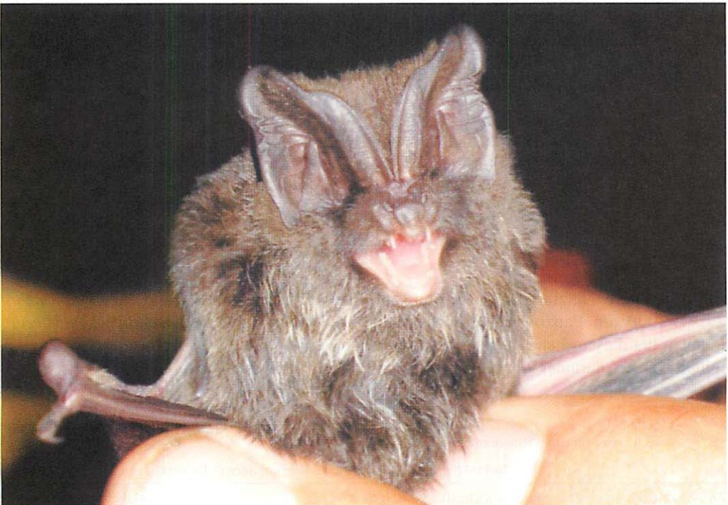
Abb. 1. Mopsfledermaus ( Barbastella barbastellus ) aus dem Hütter Wohld.

Im Rahmen eines Beringungsprogrammes wurde mit der Markierung von B. barbastellus begonnen und die Tiere mit Ringen (Flügelklammern) der Beringungszentrale Dresden versehen. Die gefangenen Tiere wurden bestimmt, vermessen und anschließend vor Ort wieder freigelassen. Mit der vorgenommenen individuellen Markierung sollen populationsökologische Daten der Wochenstubengemeinschaft (Altersstruktur und Geschlechtsreife) sowie Daten zur Beziehung von Sommerlebensräumen und Winterquartieren ermittelt werden.