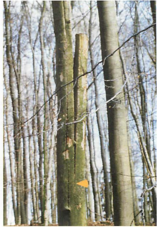
Abb. 5. Nahaufnahme Quartier Q6. Die Tiere verweilten trotz eindringenden Regenablaufwassers am 2. VIII. 2000 in dem Quartier. Am Abend wurden 20 ausfliegende Individuen der Mopsfledermaus gezählt. Der Pfeil weist auf den Quartierort unterhalb der Spalte.

dringendem Regenwasser in dem Quartier befinden. wurde am Abend eine Ausflugszählung durchgeführt. Dabei wurden gegen 21.30 Uhr 20 Tiere, darunter das besenderte Tier, innerhalb zwei Minuten beidseitig aus dem Keilspalt ausfliegend, gezählt.