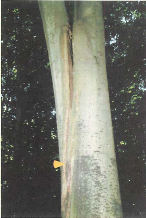
Abb. 2. Das Quartier Q2 wurde in einem Zwieselaufrisspalt einer Rotbuche, der bis zum Boden reicht, gefunden. Durch den Fund nicht flügger Jungtiere wurde das Q2 als Wochenstubenquartier eingestuft. Der Pfeil weist auf den Quartierort im mittleren Stammbereich.