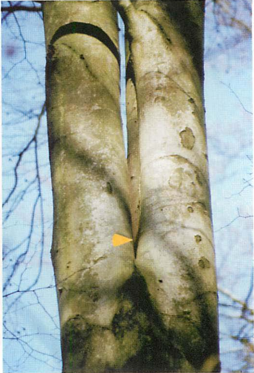
Abb. 10. Nahaufnahme des Quartierortes Q9: Die Tiere wurden im unteren Bereich der Quartierspähle gefunden. Der Pfeil weist auf diesen Ort. Bei der Untersuchung wurde festgestellt, daß der Zwieselspalt hinten zusammengewachsen ist.