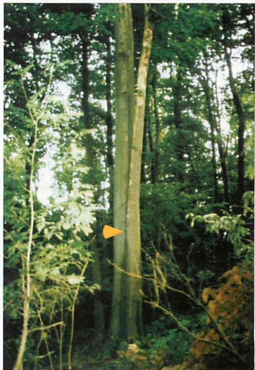
Abb. 3. Innerhalb eines Buchenbestandes wurde das Quartier Q5 entdeckt. Dabei handelt es sich um einen Zwieselaufrißspalt. Der Zwiesel ist einseitig abgebrochen. Der Pfeil weist auf den Quartierort in ca. 3,0 m Höhe.

Am 30.VII.2000 gelang durch das Tier II der Fund eines neuen Quartiers (Q5) in einer Rotbuche im Hütter Wohld, Höhe Ort Bollbrücke (Abb. 3, Fundort s. Abb. 11). Dabei handelt es sich um einen Zwieselaufbruchspalt (Keilspalt) eines älteren Baumes, wobei die Krone der Buche auf einer Seite abgebrochen ist. Die endoskopische Untersuchung erbrachte, daß sich das Quartier unterhalb der Aufbruchspalte in niedriger Höhe von 3,0 m befindet.