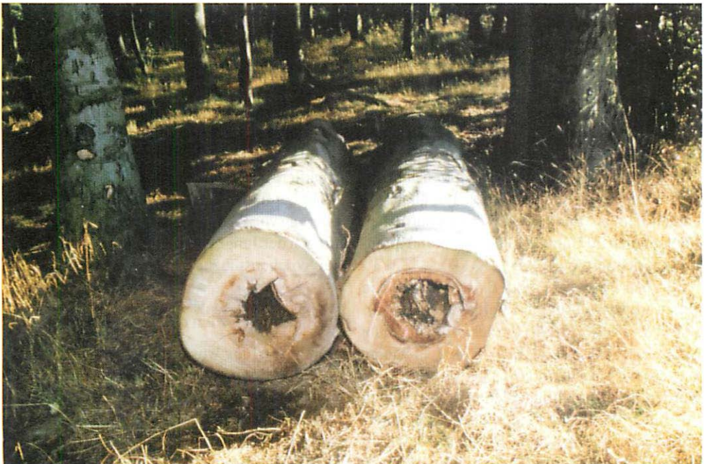
Abb. 15. Beispiel einer gefällten Starkbuche mit Wochenstubenquartier des Abendseglers ( Nyctalus noctula ) in einer Spechthöhle. Der Baum war forstwirtschaftlich nicht nutzbar, da die Ausfäulung der Höhle eine Höhe von 2,0 m aufwies. Durch einen deutlich sichtbaren Kotstreifen von etwa 3 m Länge unterhalb der Höhlenöffnung war dieser Baum unschwer als langjährig genutzter Quartierbaum auszumachen. Im Juli 1998 wurden hier 61 ausfliegende Tiere gezählt.