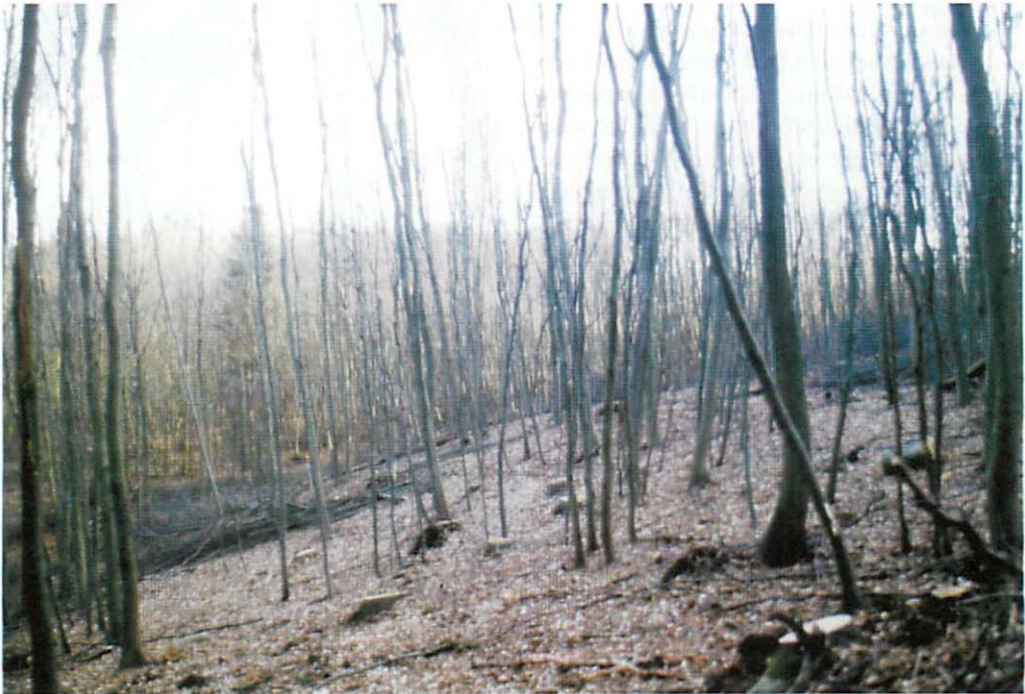
Abb. 13. Das gleiche Gebiet im Jahr 2000 nach der forstwirtschaftlichen Nutzung. Großflächig wurden Altbuchen gefällt und Totholz beseitigt. Die verbliebenen Jungholzbestände weisen altersbedingt keinerlei Höhlen oder Risse auf und sind somit als Quartierorte für Fledermäuse unattraktiv.

Die jüngeren Baumbestände verfügen naturgemäß kaum über Höhlen und die einzelnen Überhälter weisen nach Begutachtung durch die Verfasser keinerlei Höhlen, Risse oder Spalten auf und haben somit als Fledermausquartierbäume noch keine Bedeutung (Abb. 13 u. 14). Die skizzierte Situation hat sich bis heute weiter verschärft. So mußten die Verfasser im Jahr 2001 trotz vollständiger Datenübergabe der Fledermauserfassung an die Forstverwaltung des Landkreises Bad Doberan wiederum die Fällung von 35 registrierten Bäumen mit Fledermausquartieren feststellen. Für die Fällung der Bäume ist kein notwendiger Grund ersichtlich, da diese durch größere Ausfaltungen, Baumhöhlen und Totholzanteile forstwirtschaftlich nicht nutzbar waren und eine Unfallgefahr in diesen Waldbereichen auszuschließen ist. So kann belegt werden, daß durch die Forstbehörde