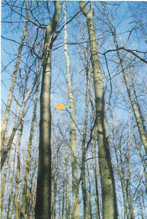
Abb. 6. Im Gebiete eines jüngeren Eichenbestandes konnte das Quartier Q8 in einer abgestorbenen, 20 cm starken Traubeneiche entdeckt werden. Der Pfeil weist auf den Quartierort in ca. 8,0 m Höhe.