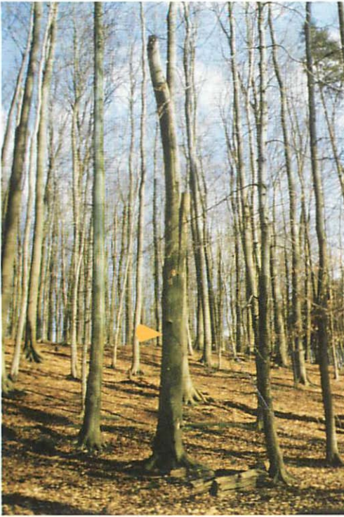
Abb. 4. Beleg des Quartiers Q6. Dabei handelt es sich um einen Keilspalt einer toten Zwieselbuche. Der Pfeil weist auf den Quartierbaum.