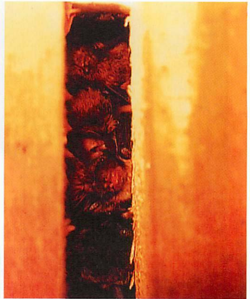
Abb. 6. Ausschnitt aus einer Gruppe Großer Bartfledermäuse in einem wieder eingebauten „alten“ Spaltenquartier: Bei den drei oberen Individuen handelt es sich um Alttiere, beim unteren um ein 2002 geborenes Jungtier.

ten Spalten hat sich um eine weitere auf 11 (von 15) erhöht. Außerdem war am 18.VII.2002 erstmals die nur etwa 3 m neben der Giebelöffnung befindliche Spalte besetzt.