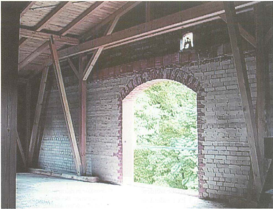
Abb. 4. Öffnung im Westgiebel, durch die beizeiten in den Abendstunden anscheinend alle Großen Bartfledermäuse ( Myotis brandtii ) den Dachboden verlassen, um im 10 m entfernt beginnenden Laubwald "einzutauchen".