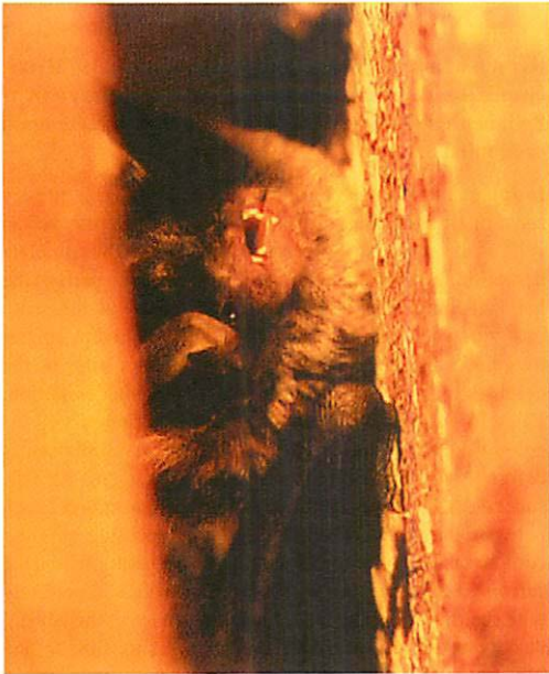
Abb. 7. Porträt einer Großen Bartfledermaus (Alttier) in einem wieder installierten „alten“ Spaltenquartier.

ren Arten, sowohl über positiv als auch negativ ausgegangene Baumaßnahmen.