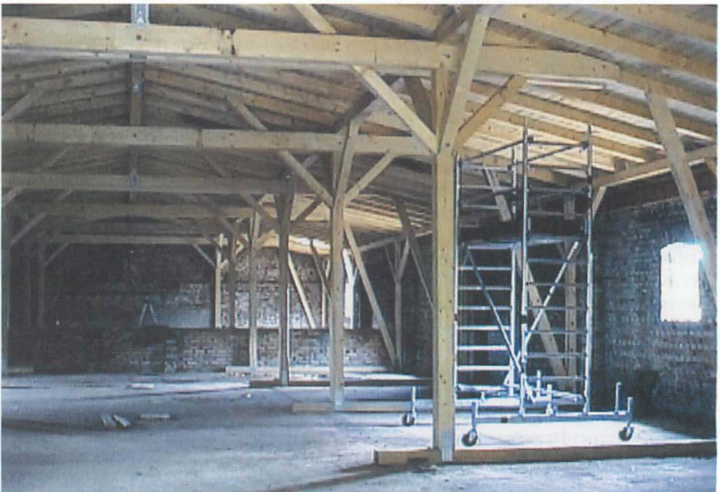
Abb. 3. Boden des ehemaligen Stallgebäudes in Julianenhof mit komplett erneuerter Dachkonstruktion.

Ab März 2002 stand der Dachboden den Großen Bartfledermäusen in tadellosem Zustand mit allen „alten“ Spaltenquartieren (Abb. 4) zur Verfügung. Anzumerken ist lediglich, daß sich die mikroklimatischen Verhältnisse infolge der eingetretenen Trockenlegung (wenigstens zeitweise) verändert haben; denn es regnet jetzt nirgendwo mehr durch, und auch der Fußboden ist überall absolut trocken. Daß M. brandtii diesbezüglich aber erhebliche Gegensätze toleriert, war zu erwarten; denn nach langen Perioden ohne Regen trockneteder Dachboden auch früher im Sommer völlig aus. Die Temperaturverhältnisse dürften hingegen annähernd gleichgeblieben sein; auch sie unterlagen schon immer starken Schwankungen, je nachdem wie intensiv und wie lange das Dach der direkten Sonnenstrahlung ausgesetzt war und ist.