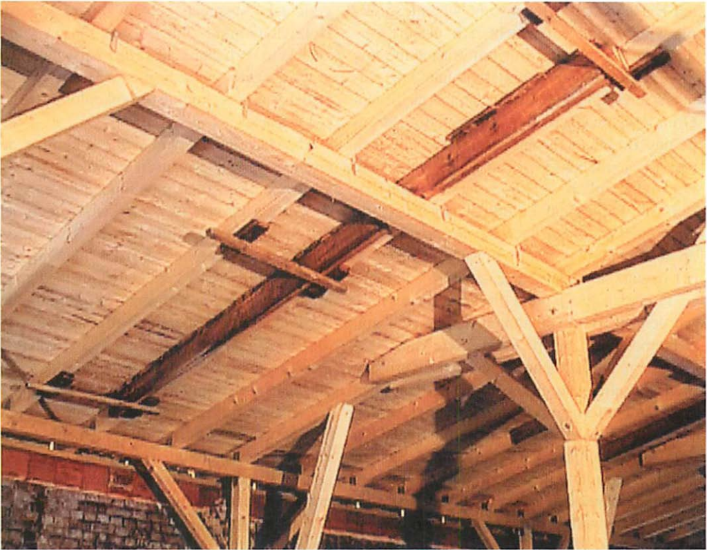
Abb. 2. Anhand der dunklen Hölzer deutlich erkennbar: originalgetreu wieder eingebaute, stabil im Dachgebälk verankerte „alte“ Spaltenquartiere.