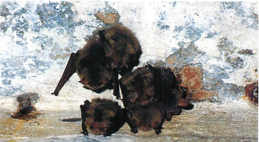
Abb. 3. Kleine Winterschlafgemeinschaft als relativ aufgelockerter Cluster, bestehend aus drei Fransenfledermäusen ( Myotis nattereri ) und drei Braunen Langohren ( Plecotus auritus ) im Jan. 1995 in der Ostquellbrauerei Frankfurt/Oder.

Zwischen den Schwärmquartieren scheint es auffällige Unterschiede zu geben. Während es für die Spandauer Zitadelle nur vereinzelt Nachweise dafür gibt, daß während der Schwärmphase erscheinende Fransenfledermäuse auch im Winter vor Ort sind, ist dies für die Gewölbekeller in der ehemaligen Ostquellbrauerei in Frankfurt/O. eher als Normalität anzusehen. Von den dort in der Schwärmphase