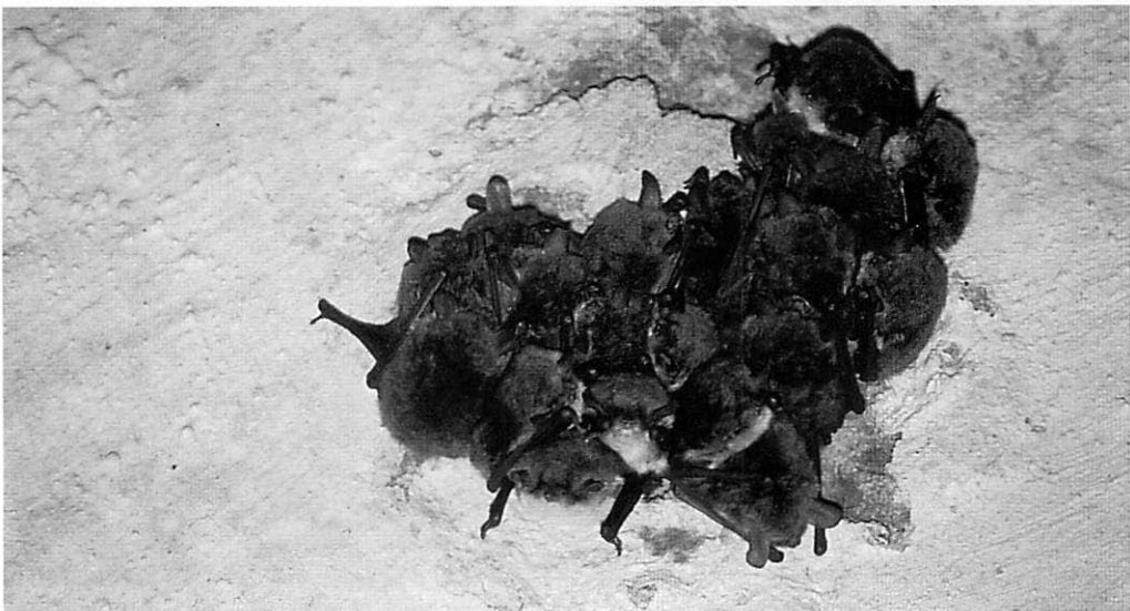
Abb. 4. Von mehr als 20 Fransenfledermäusen ( Myotis nattereri) gebildeter Cluster in der Ostquellbrauerei in Frankfurt/Oder.

Schlußfolgerungen für den Fledermausschutz: Unterirdische Hohlräume mit Schwärmaktivitäten von Fledermäusen müssen in der betreffenden Zeit (Mitte Juli/August bis Oktober/Mitte November) absolut ruhiggestellt werden. Führungstätigkeiten und andere Beunruhigungen sollten radikal ausgeklammert werden. Die Oberste Naturschutzbehörde der Senatsverwaltung von Berlin hat inzwischen reagiert, die entsprechenden Abschnitte der Spandauer Zi-