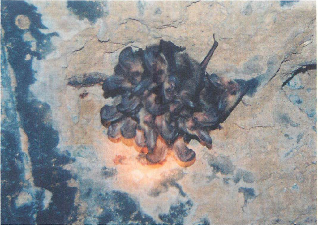
Abb. 1. Cluster der Braunen Langohren ( Plecotus auritus ) am 17.IX.2003 in der Schorflheide (Gebiet Pechteich/ ehem. Wasserwerk/linke Zisterne).