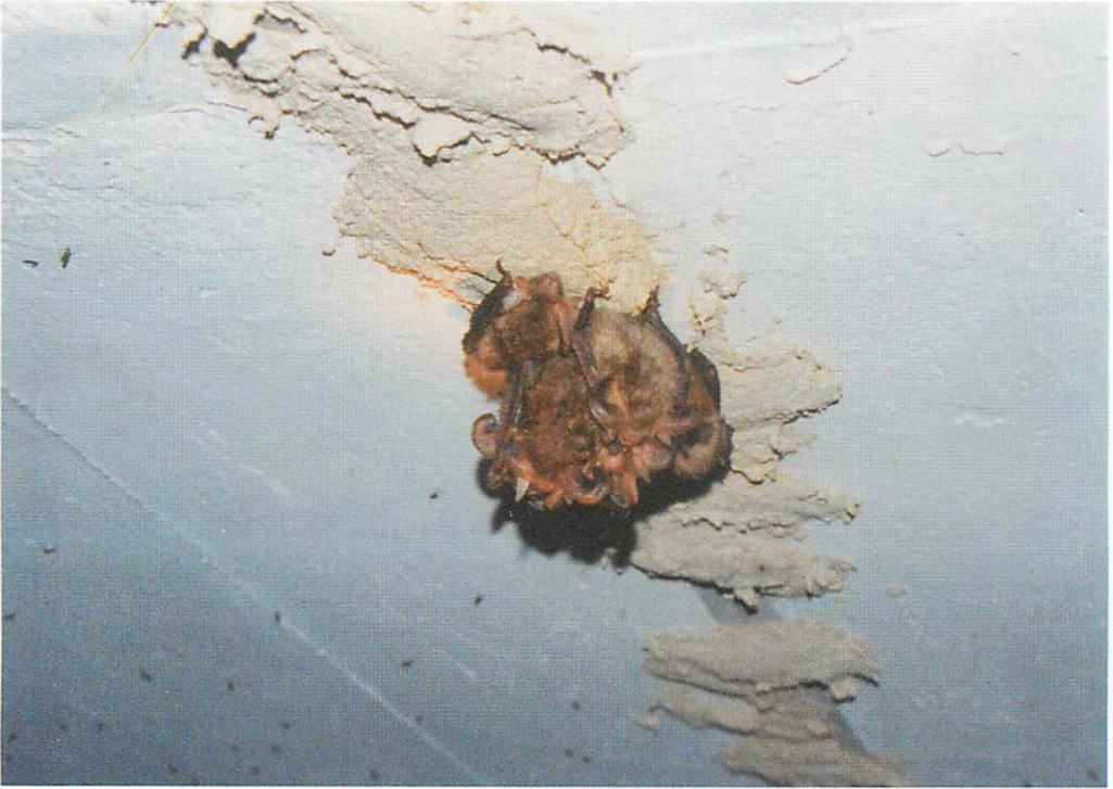
Abb. 3. Cluster der Braunen Langohren ( Plecotus auritus ) E. Sept. 2002 in der Schorfheide (Gebiet Pehlenbruch/chem. Telekom-Bunker).