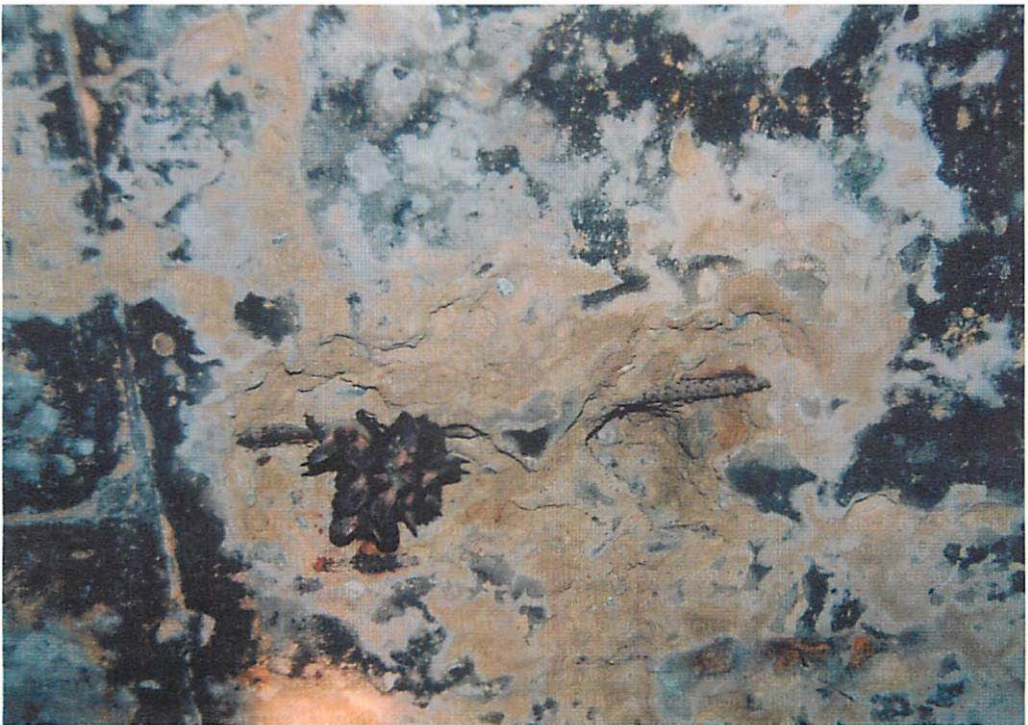
Abb. 2. Wie Abb. 1. aber wenige Sekunden später: Ein Teil der Braunen Langohren ist bereits abgefliegen.