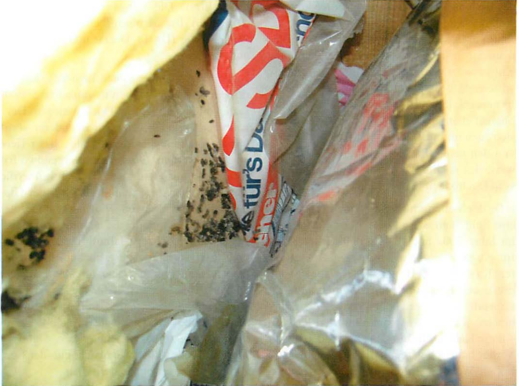
Abb. 5. Reichlich vorhandener Kot der Breitflügel-Fliege unter der Dämmschicht, zu der an diesem Platz zusätzlich auch eine Plastefolie gehört. Auch an dieser Stelle werden die unterschiedlichen Altersstadien des Kotes erkennbar.

Die Handkontrolle dieses Fänglings ergab, daß es sich um ein adultes ♀ mit - noch deutlich erkennbar - angetretenen Zitzen handelte. Damit stand fest, daß ich es mit einer Wochenstubengesellschaft der Breitflügel-Fliege zu tun habe, die sich ungewöhnlicherweise in der Dämmschicht des Fußbodens bzw. über der Zimmerdecke etabliert hatte. Ob dort auch die Jungenaufzucht stattgefunden hat, ist zwar sehr wahrscheinlich, aber angesichts des späten Termins (2. VIII.) nicht mehr nachvollziehbar gewesen. Nach der Freilassung des handkontrollierten Tieres konnte ich an mehreren Stellen aus dem Fußboden heraus weitere Soziallaute von E. serotinus vernehmen, so daß die Gesamtzahl der Fliegemäuse noch erheblich größer gewesen sein muß. Daraus ist zu schlußfolgern, daß sich die Fliegemäuse in der Dämmschicht unter der Dachpappenlage über den gesamten Dachbodenbereich frei bewegen können.