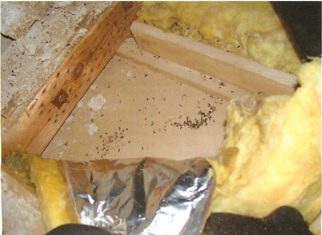
Abb. 4. Kot der Breitflügelfledermaus ( Eptesicus serotinus ), der unter der Dämmschicht auf den Rigipsplatten liegt. Deutlich erkennbar, daß es sich um älteren (grau gefärbten) und frischen (dunkel, schwärzlich erscheinenden) Kot handelt.

Als ich am obengenannten Tage die Dachluke öffnete, vernahm ich bereits intensive Soziallaute von Fledermäusen. Doch weder im Deckenbereich des Daches noch an anderen sonst üblichen Aufenthaltsorten konnte ich der Tiere ansichtig werden. Es war auch nirgendwo frischer Kot vorhanden. Als ich vorsichtig über die Dachträger balancierte und kurz vor der Giebelwand stand, drangen jedoch erneut Gezeter und Geraschel aus der Dämmung zu meinen Füßen heraus. Ich hob daraufhin in der Erwartung, Siebenschläfer zu erblicken, die Dachpappenbahnen mit der obersten Dämmschicht an. Aber statt Siebenschläfer kamen ungefähr 10 Breitflügelfledermäuse zum Vorschein, die rasch laufend sofort versuchten, sich wieder in die Deckung zurückzuziehen (Abb. 4 und 5). Ich hatte große Mühe, wenigstens eins der Tiere zu Kontrollzwecken zu erwischen.