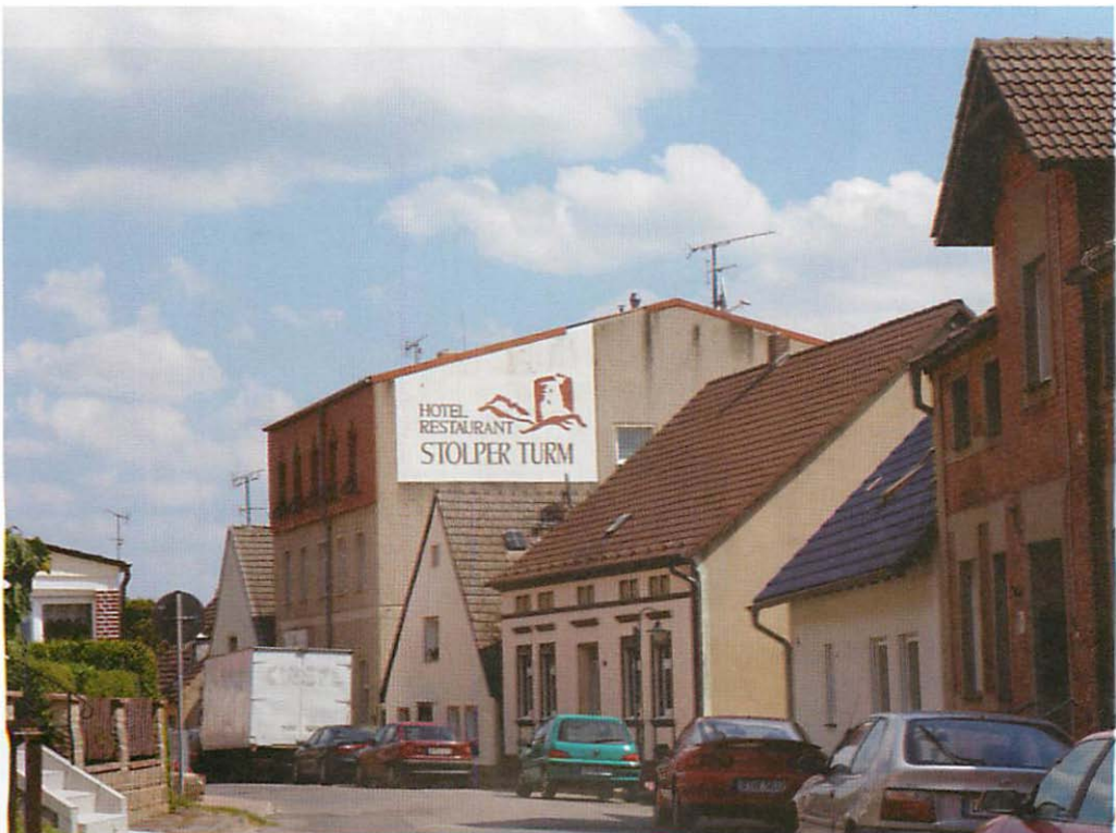
Abb. 1. Das Gebäude des Hotels „StolperTurm“ mit der vor einigen Jahren aufgestockten Etage (erkennbar durch die straßenseitig angebrachte Verblendung).

Der Dachboden ist nur über die Deckenträger vorsichtig begehrbar, so daß größere Bereiche