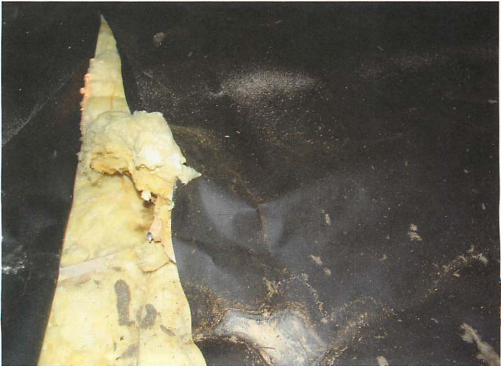
Abb. 3. Unter der aufgeschlagenen Dachpappbahn wird die gelbliche Masse der Dämmschicht sichtbar.