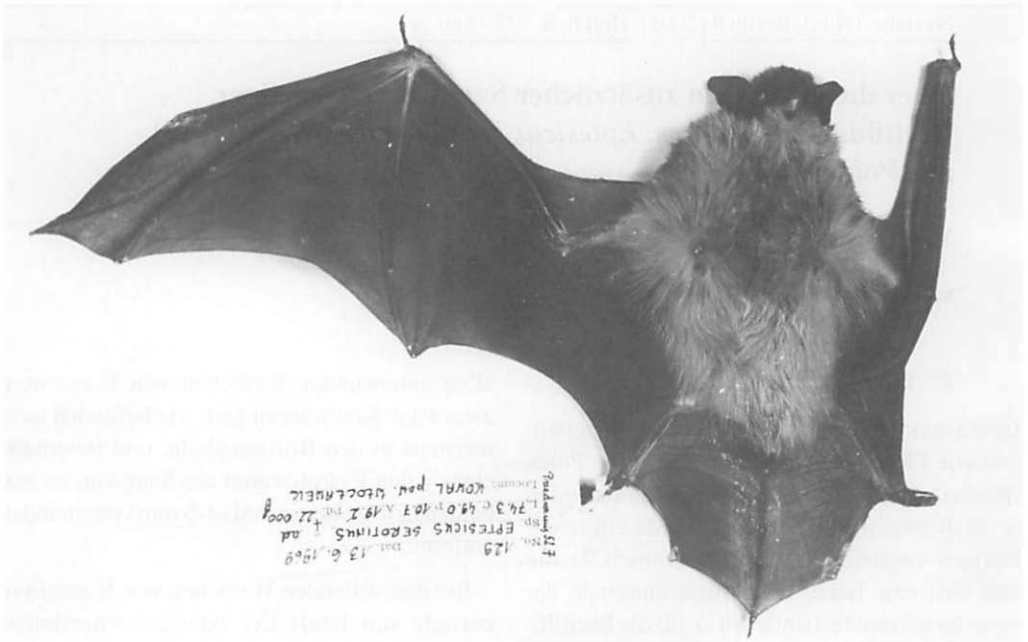
Abb. 1. Der Balg der aus Zentralpolen stammenden Breitflügelvedermaus ( Eptesicus serotinus ) mit den rechtsseitig doppelt angelegten Saugzitzen (Nr. coll. 91303/129 MRI PAS in Białowieża). Die zusätzliche Saugwarze ist an der rechten Brustseite erkennbar.