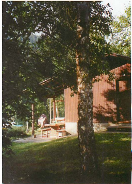
Abb. 3. Zweiter Standort: Die gleiche Birke wie die auf Abb. 2 zu sehende, mit Blick in den Garten

In den letzten Jahren beschränkte sich der Quartierwechsel immer mehr auf die von mir angebotenen Kästen. Bei den hier gegebenen geringen Entfernungen der Kästen zueinander kann als Grund ein notwendig werdender Wechsel des Jagdgebietes ausgeschlossen werden. Auch die Verschmutzung mit Kot spielt wohl höchstens eine sehr untergeordnete Rolle, da die Kotschicht wegen des starken Abbaus durch die große Biomasse an Fliegenlarven nie stark anwächst und eher positiv wie eine Heizung wirkt. Die stetige Zunahme an Parasiten in der Höhle wird wohl die ausschlaggebende Rolle für einen Wechsel des Quartiers spielen. Daher ging ich im Jahr