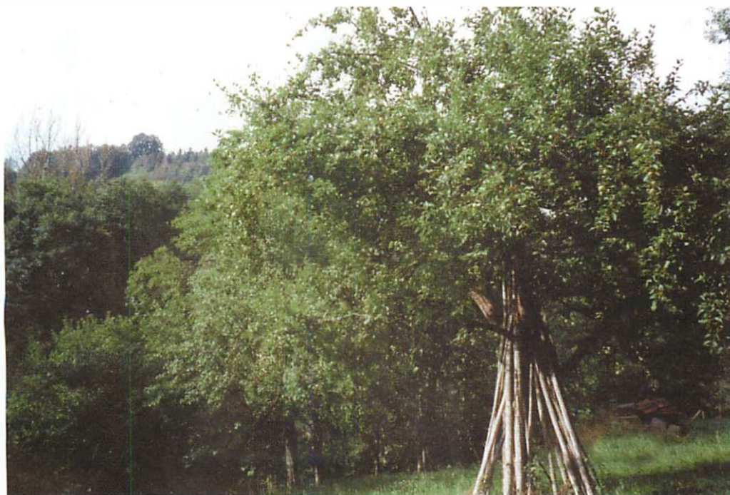
Abb. 5. Dritter Standort: Der gleiche Baum wie der auf Abb. 4 zu sehende, mit Blick in Richtung Gärten (Hecke)

Zu den eindrucksvollsten Ereignissen zählt immer das Schwärmen der Fledermäuse am frühen Morgen vor Sonnenaufgang vor ihrem Quartier, das sich über eine halbe Stunde und länger hinzieht. Hierbei berühren sie hin und