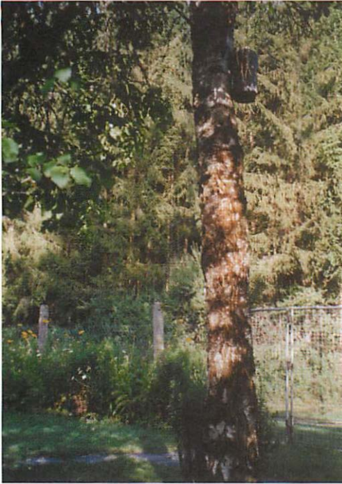
Abb. 2. Zweiter Standort: Birke mit Blick über den Zaun in den nahen Fichtenwald

Die Bechsteinfledermaus gilt als typische Waldfledermaus. Trotzdem sah ich davon ab, die Höhlen direkt im Wald anzubringen. Die Zählung der Tiere beim abendlichen Ausfliegen etwa eine halbe Stunde, aber auch später nach Sonnenuntergang ist wegen der dann vorherrschenden Lichtverhältnisse praktisch nur gegen den hellen Hintergrund des Himmels möglich, was im Wald in der Regel nicht gegeben ist.