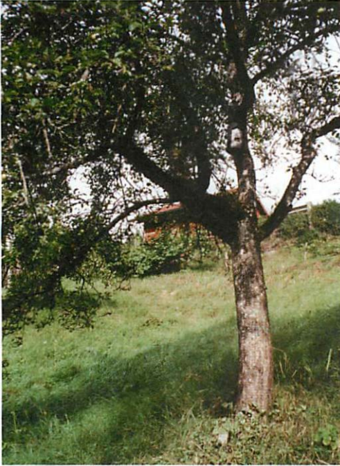
Abb. 6. Vierter Standort: Apfelbaum mit angrenzendem Wiesenstück, aber näher am Wald, mit Blick auf die Gärten

wieder den Kasten so, als wollten sie schon hineinkriechen, fliegen dann aber wieder ab, umkreisen ortend auch den anwesenden Beobachter, der dabei den weichen Flügelschlag zu spüren bekommt, und verschwinden schließlich im Inneren des umschwärmten Quartiers. In diesen Minuten des Schwärmens muß sich ja die Umstimmung vollziehen von den weitgehend solitären Aktivitäten nachts, während sie jagen, sowie wahrscheinlich auch während der nächtlichen Ruhepausen zur geradezu gegensätzlichen Lebensweise in einer dicht gedrängt ruhenden Kolonie während der Tagesstunden.