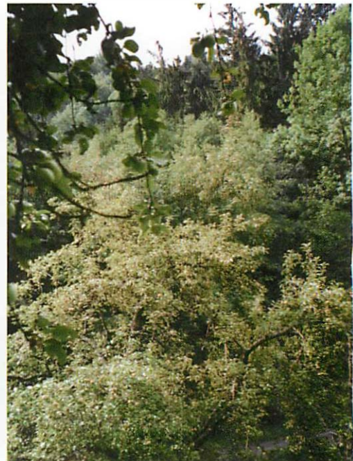
Abb. 7. Vierter Standort: Der gleiche Baum wie der auf Abb. 6 zu sehende, mit Blick zum nahen Wald.

The author describes the unexpected settlement of a colony of Bechstein's bats, Myotis bechsteinii in a garden site (in 1997 and 1998 only few individuals, from 1999 onwards a nursery colony with a maximum of 22 individuals). The bats inhabit varying different types of offered artificial bat boxes, mainly made of woodconcrete. The paper contains remarkable information about the frequency and the assumed causes of the frequent change of batboxes as well as the swarming behaviour during the early morning hours.