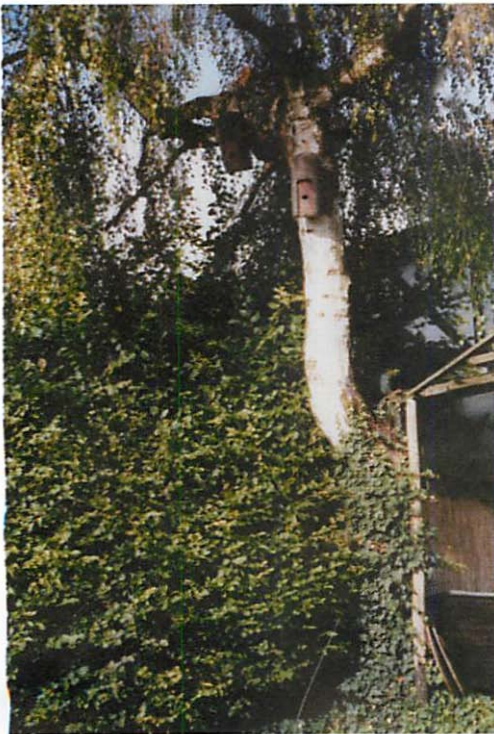
Abb. 1. Erster Standort: Die Birke, an der ich zuerst die Kästen anbrachte.

Im Verlauf der Jahre benutzte ich folgende Höhlen: Fa. Schwegler: Typen 2F, 1FD, 1FS, 2FN, Fa. Strobel: Typ Fledermaus-Rundkasten, R. HERTER: Typ „Flachkasten“, B. STRATMANN: Typ „Holzkasten“. Einen weiteren Kasten fertigte ich selbst aus Holz an, um ihn ganz nach meinen Vorstellungen herrichten zu können. Leider wurde dieser Kasten bisher nicht angenommen. Auch der „Holzkasten“ nach STRATMANN, der aber erst 2003 aufgehängt wurde, blieb leer. Die Kästen brachte ich an zwei Birken sowie je einem Apfel- und Pflaumenbaum so an, daß die Öffnungen in Richtung Süden und Osten wiesen und sie, wenn überhaupt, nur kurze Zeit direkt von der Sonne bestrahlt wurden.