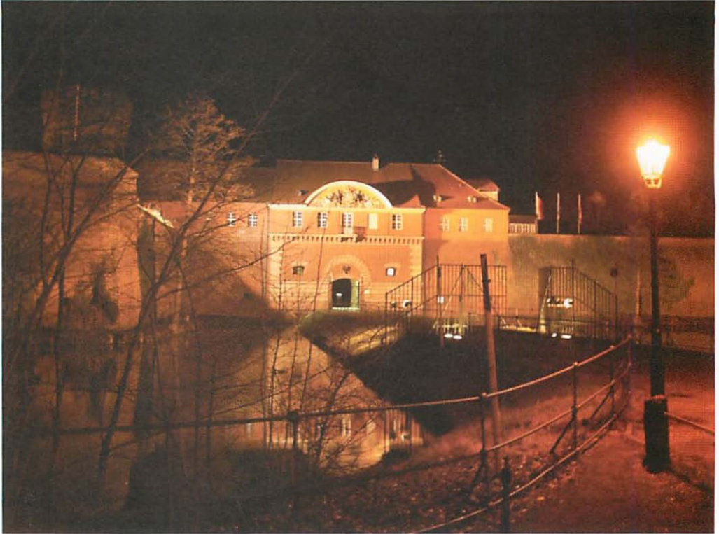
Abb. 1. Torhaus der Spandauer Zitadelle bei Nacht.