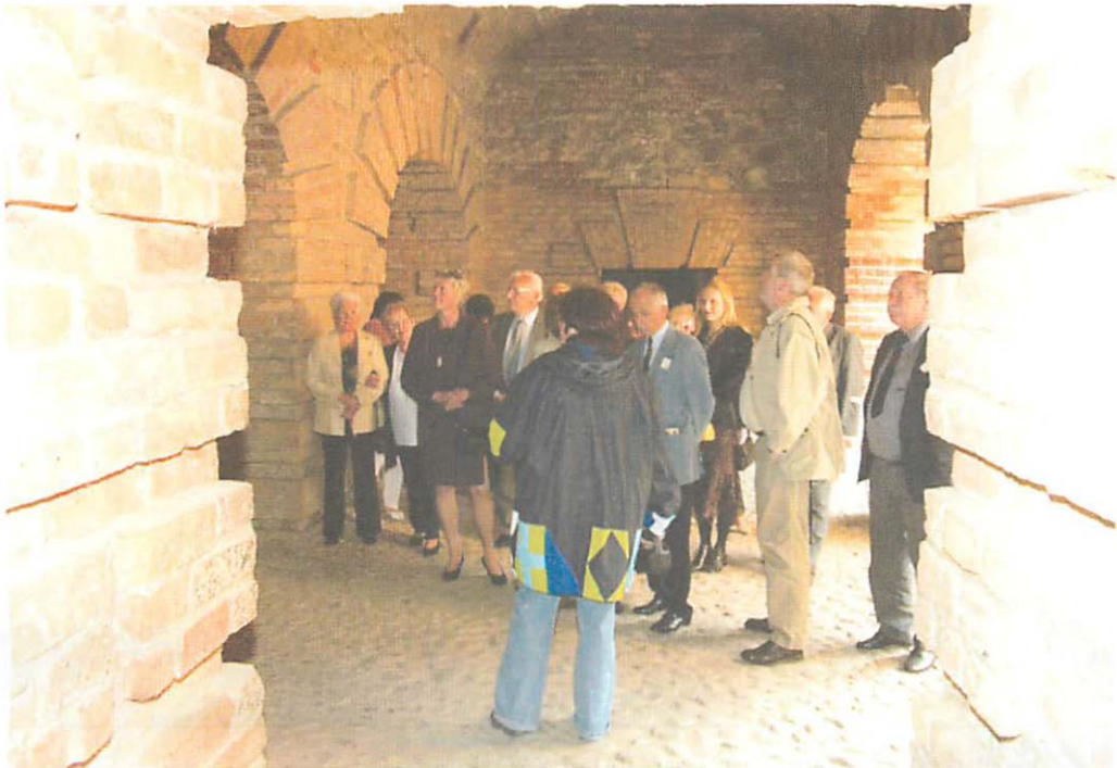
Abb. 4. Besuchergruppe in der Spandauer Zitadelle während einer Fledermausführung.

In order to protect the important bat population inhabiting the Spandauer Zitadelle, action has to be taken. People have to be convinced why the protection of these bats is necessary. A hindrance to this aim are the different methods used to count the actual number of bats. Therefore a careful dealing with numbers is necessary in order to substantiate the protection of the bats.