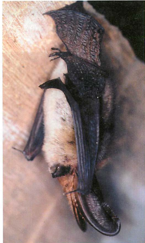
Abb. 1. Graues Langohr ( Plecotus austriacus ) im Winterschlaf mit nicht zurückgeklappten Ohren und abgewinkelten Flügeln.

Das höherhängende Graue Langohr verharnte unverändert an seinem Platz, und dies tat es