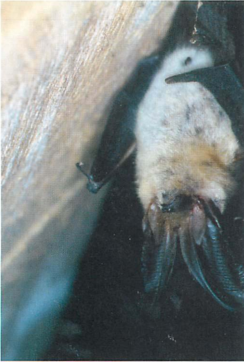
Abb. 2. Selbst von unten ist der große Bluterguß am rechten Ohr des Grauen Langohrs gut sichtbar.

auch noch am 29.III.2004. Am 20.XII.2004 war es immer noch am gleichen Platz, erwies sich anlässlich der Kontrolle aber als Mumie. Die Maße und Merkmale dieses ♂: Daumenlänge 6,0 mm, Krallen 2,0 mm, Tragusbreite 4,8 mm, Penisform typisch für P. austriacus . Dr. AXEL SCHMIDT (Beeskow), dem das Belegexemplar wegen seiner im Grenzbereich liegenden Werte zur Nachbestimmung vorlag und der bereits vorher die Färbung der Schnauze, der Ohransätze, der Tragi und der Rückenhaare nach den vorgelegten Bildern (Abb. 1-3) für arttypisch hielt, stellte die zweifelsfreie Zugehörigkeit zu P. austriacus anhand der Mumie endgültig fest.