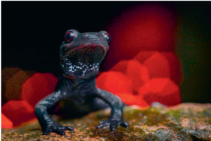
Salamandra atra .

Die Biogeografie bildet die Brücke zwischen Biologie und Geografie. Durch die Mischung beider Wissenschaften lassen sich Ökosysteme, Verbreitungen von Arten und evolutionäre Vorgänge dieser erklären. Europa bietet trotz seiner kleinen Fläche elf Biogeografische Regionen, von denen ich sieben vorstellen möchte. Wir begeben uns auf eine Reise von der Nordsee bis zum Schwarzen Meer, durch Moore und Steppen, über und unter die Berge. Die typischen Lebensräume der Regionen und deren herpetologische Bewohner bringe ich Ihnen aus meiner Perspektive sowohl durch kreative Bilder als auch anhand erlebter Geschichten aus meiner persönlichen Perspektive näher.