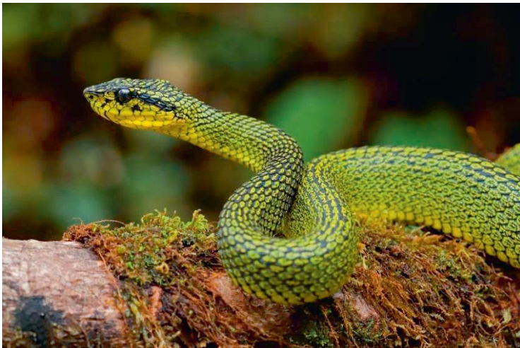
Bothriechis nigroviridis .

„Costa Rica? Hab‘ ich doch schon 1000 Mal gehört!“ Falls Sie gerade diesen Gedanken hatten, sind Sie nicht alleine – wir hatten vor unserer ersten Reise in das touristisch gut erschlossene Land in Mittelamerika ähnliche Bedenken. Haben wir nicht alle Tierarten und Orte schon zig-fach in den zahlreichen Reiseberichten abgebildet gesehen? Ist das nicht zu wenig abenteuerlich? Intensive Planung und einen einmonatigen Aufenthalt in Costa Rica später sind wir eines Besseren belehrt. In unserem Vortrag möchten wir Ihnen die Eindrücke, Erlebnisse und tierischen Begegnungen vorstellen, die wir an drei Standorten teilweise tief in der wenig besuchten Cordillera de Talamanca sammeln konnten: im Valle del Silencio, wo die Stille nur durch den melancholischen Gesang der Quetzale unterbrochen wird; auf einem Gewaltmarsch von 600 auf 2400 Höhenmeter, an dessen Ziel am Rio Lorí einer der seltensten Salamander der Erde wartet; und auf dem Cerro de la Muerte, dem „Berg des Todes“, auf dem, anders als es der Name suggeriert, eine Vielzahl an Salamanderarten lebt. Tausend Mal gehört? Das tausend-und-erste Mal lohnt sich trotzdem, versprochen!