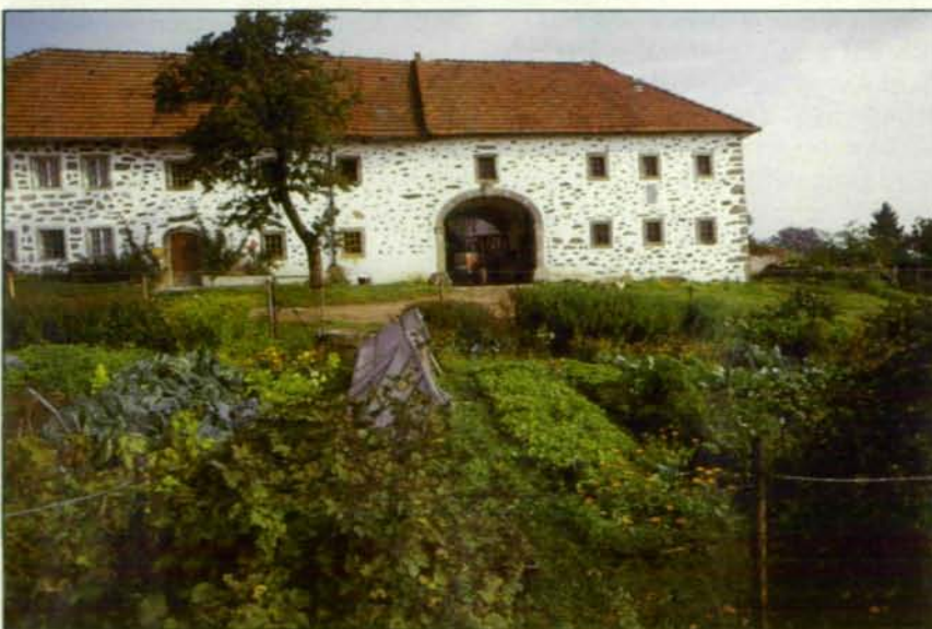
Abb. 2: Etwas „ungeordnet“, aber vielfältig liegt ein typischer Bauerngarten des Mühlviertels vor der nicht asphaltierten Hofeinfahrt und spiegelt einen Teil des Spektrums bäuerlicher Eigenversorgung wider.