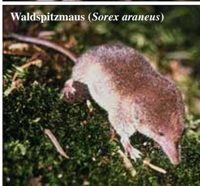
Waldspitzmaus ( Sorex araneus )