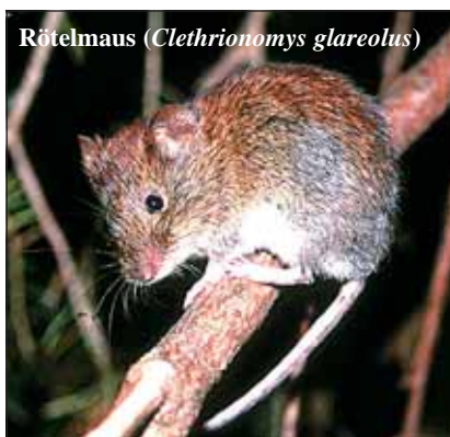
Rötelmaus ( Clethrionomys glareolus )

Sie sind stolzer Katzenbesitzer und bekommen von Ihren Katzen tote Mäuse zugetragen? Sie haben beim Spaziergang eine tote Maus am Wegesrand gefunden? - Helfen sie mit, etwas Licht in die Verbreitung dieser oft unterschätzten Tiergruppe zu bringen!