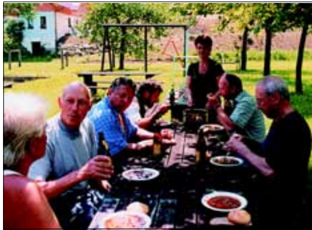
Abb. 28: Nach getaner Arbeit schmeckt es natürlich im Freien am besten.

Nach entsprechender Beobachtungszeit wird ein Bericht erfolgen!