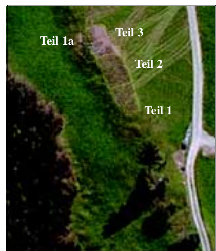
Abb. 22: Lage der neu aufgetragenen Teilstücke am 29. April 2001.