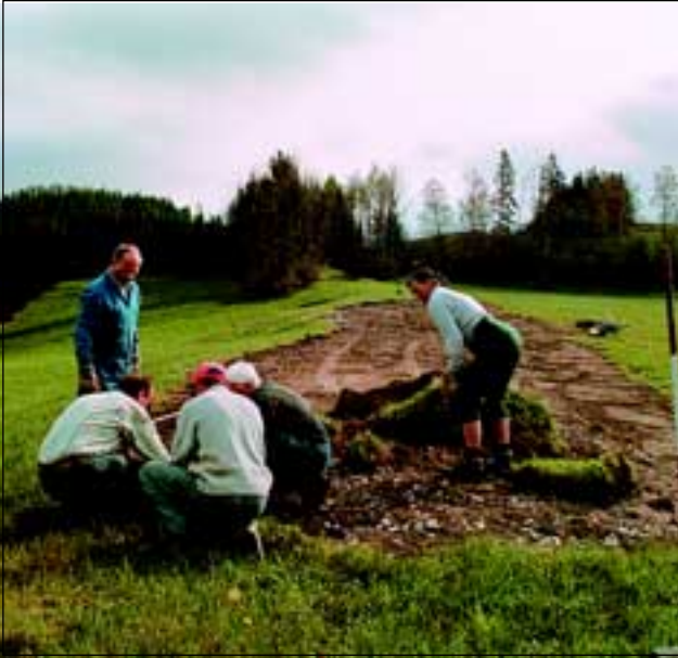
Abb. 17: Bei den ersten Rasenstücken war noch öfter zu überlegen, wie sie am besten aneinanderzufügen seien.