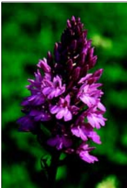
Abb. 3: Die Spitzorchis ( Anacamptis pyramidalis ) ist in dieser Häufigkeit nur mehr auf der Himmelreichwiese zu finden.