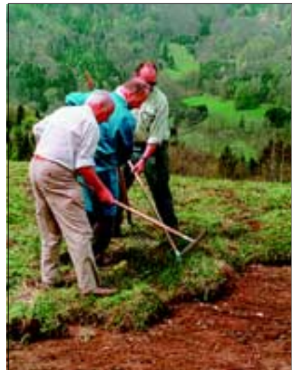
Abb. 19: Der Einsatz von Rechen zum Ziehen hat sich beim Aneinanderfügen der Rasenziegel bestens bewährt.