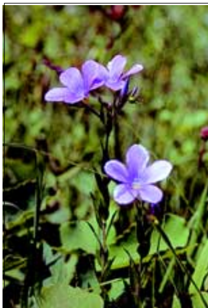
Abb. 6: Der Klebrige Lein ( Linum viscosum ) ist außerhalb des Nationalparkes Kalk-alpen nur mehr in Micheldorf zu finden.