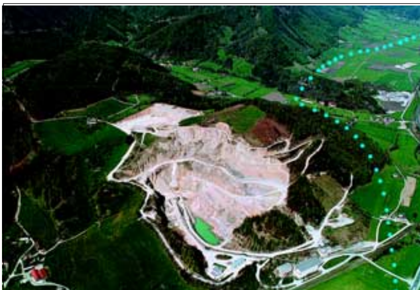
Abb. 2: Der Michelberg vom Süden nach Norden gesehen. Im Vordergrund der Kalksteinbruch des Tagbau Obermicheldorf, dahinter das Tal des Kremsursprunges mit dem Himmelreichbiotop, rechts die Pyhrnbahn und die B 138 (Punktierte Linie = geplante Autobahntrasse der A9).

le Material abzubauen behördlicherseits genehmigt sei und versprach, mit dem Zuständigen des „Tagbau Obermicheldorf“ der Fa. Hofmann Ges. m.b. H. u. Co. KG. über meinen Vorschlag zu sprechen, wenigstens Teile dieses wunderschönen, etwa 2,5 ha großen Kalkmagerrasens, mit