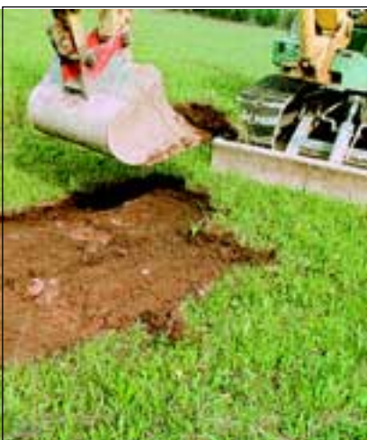
Abb. 20: Auch auf der Himmelreichwiese war die Humusschicht nur 10-15 cm dick.