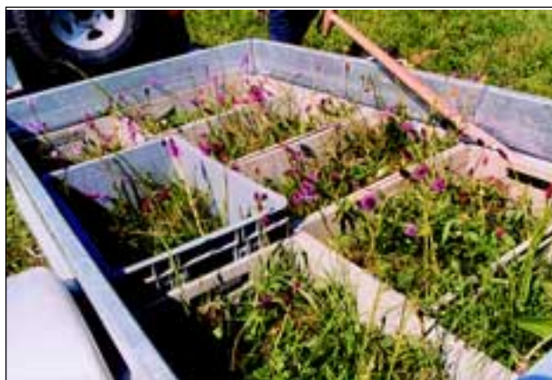
Abb. 27: Fein säuberlich nach Arten wurden Einzelpflanzen in Tragkisten zum Übersiedeln verstaub.