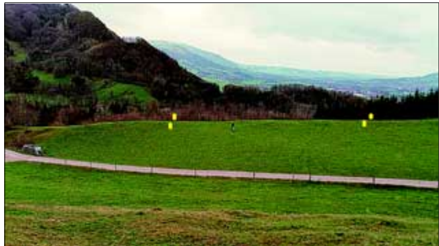
Abb. 10: Die gelben Markierungen auf dem Foto begrenzen die Wiesenfläche, welche ausgetauscht werden soll.