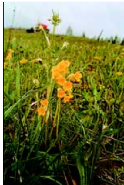
Abb. 7: Zu hunderten steht die Frühlings-Schlüsselblume ( Primula veris ) noch auf der Himmelreichwiese.

Frühlings-Enzian ( Gentiana verna ), Frühlings-Schlüsselblume ( Primula veris - Abb. 7), Geflecktes Knabenkraut ( Dactylorhiza fuchsii ), Arnika ( Arnica montana ), Schwarzwiolette Akelei ( Aquilegia atrata ), Kartäuser-Nelke ( Dianthus carthusianorum ), Schopfige Kreuzblume ( Polygala comosa - Abb. 8), Weiße Waldhyazinthe ( Platanthera bifolia ), Ästige Graslinie ( Anthericum ramosum ), und anderen Kalkmagerrasen. Dieses Wiesenareal von dem hier die Rede ist, stellt den Rest der so genann-