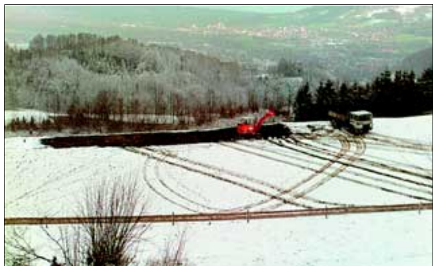
Abb. 11: Bei Schneetreiben wurden 350m 2 Wiese abgetragen.