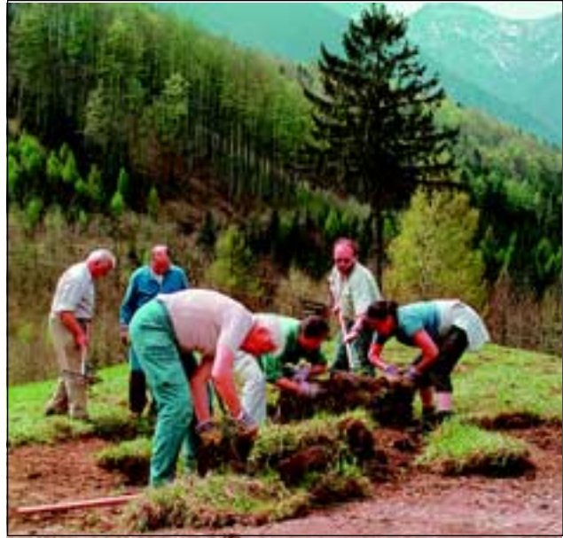
Abb. 18: Die Rasenteile wurden in Kraft raubender Handarbeit zurechtgerückt und aneinander gefügt.

Mit dem Kleinbagger wurden Rasenstücke mit den Maßen von etwa 60 x 80 cm und einer Dicke von 10-15 cm abgetragen - dicker war die Humusschicht nicht - vorsichtig auf den Unimog verfrachtet (Abb. 16) und über teilweise ziemlich unwegsames und steiles Gelände zum Bestimmungsort transportiert. Dort angekommen, wurden die Rasenflächen in Kraft raubender Handarbeit zurechtgerückt und aneinander gefügt (Abb. 17-20). Dabei mussten die immer wieder anfallenden Zwischenräume mit Kleinstücken und Humus aufgefüllt werden, um das Austrocknen von den Rändern her zu verhindern.