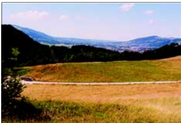
Abb. 25: Einen Monat später war von den Versetzungsarbeiten nicht mehr viel zu sehen.

An den Tagen des 1., 12., 20. und 26. Mai fanden begleitend zur Flächenversetzung auch mehrere Einzelverpflanzungen (ca. 700 Exponate, davon 380 St. Spitzorchis, 101 St. Händelwurz, 35 St. Kleines Knabenkraut, 40 St. Echte Schlüsselblume, 20 St. Geflecktes Knabenkraut, 12 St. Fliegenragwurz, weiters Frühlings-Enzian, Weißes Waldvögelein, Lanzettblättriges Waldvögelein, Katzenpfötchen, Klebriger Lein, Feuerlilien usw.) auf sechs unterschiedliche Versuchsflächen statt (siehe Abb. 9). Es war natürlich wichtig, festgestellt zu haben, dass dieselben Pflanzen dort auch Überlebensmöglichkeit vorfinden würden!