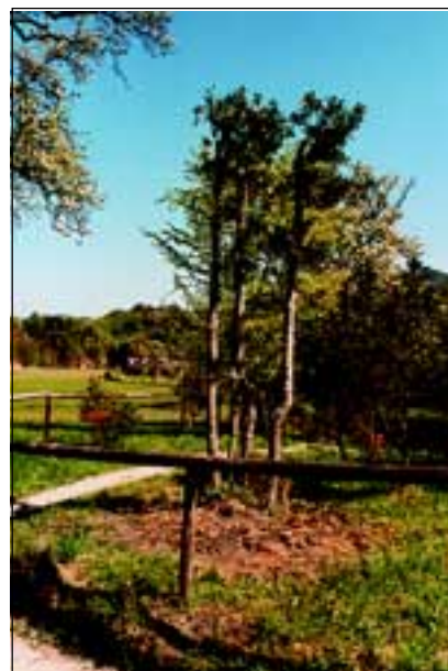
Abb. 12-14: Links steht der ca. 100-jährige „Schrader“ noch vor dem alten Bauernhaus „Ober Gerhard“ mit der Adresse „Im Himmelreich 1“. Im mittleren Teil des Bildes harrt der Baum bereits mutterseelenalleine zwischen den Steinbrüchen seines Schicksales, rechts sieht man ihn auf seinem neuen Standort im Himmelreichbiotop.

dafür vorgesehenen Wiesenstückes und das Übertragen des Kalkmagerasens, wobei gleichzeitig die Auspflockung des abzutragenden Wiesenstückes (Abb.10), welches nun etwas größer ausfiel, und die Lagerplatzbestimmung für den Humus im Steinbruchbereich erfolgte.