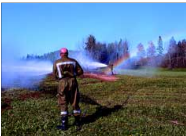
Abb. 23: Damit die versetzte Wiesenfläche nicht austrockne, dafür sorgte die Freiwillige Feuerwehr Micheldorf mit 2000 Litern Wasser.