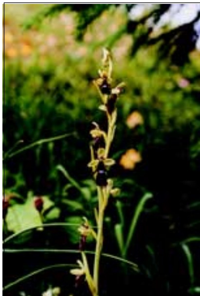
Abb. 5: Wie ein Manderl im Hubertusmantel wirkt die Fliegen-Ragwurz ( Ophrys insectifera ), bei uns darum „Bergmanderl“ genannt.