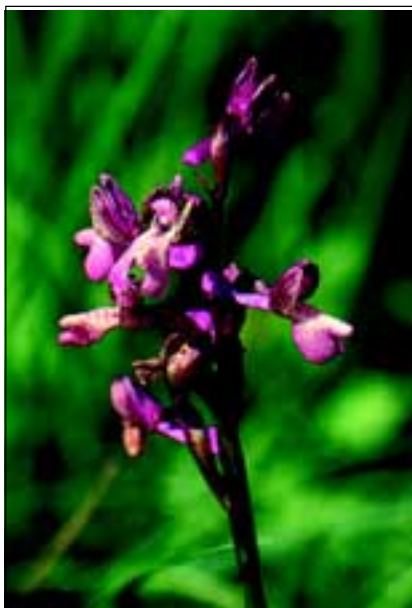
Abb. 4: Das Kleine Knabenkraut ( Orchis morio ) ist eine Wärme liebende Art aus dem südlichen Europa.

Innerhalb einer Woche und etlichen weiteren Telefonaten konnte schon für den 6. April ein Lokalaugenschein mit allen Beteiligten vereinbart werden, mit dem Ergebnis, dass aus abbauterminlichen Gründen schon bis Juni 2001 ein etwa 100 m 2 großes Wiesenstück abgetragen und auf ein für geeignet befundenes Areal versetzt sein sollte, wobei die Kosten der Baufahrzeuge (LKW, Unimog und Kleinbagger) vom Tagbau Obermicheldorf übernommen würden. Nebenbei erhielt ich die Zusicherung der Hilfe bei der Verpflanzung einer