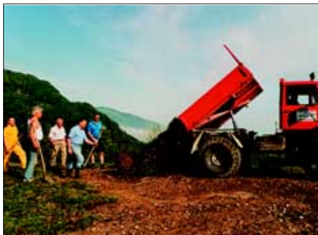
Abb. 24: Ein neuer Freiwilligen-Arbeitstrupp mit frischen Kräften vollendet mit weiteren 120 m 2 am 5. Mai 2001 die Versetzung von insgesamt 350 m 2 Kalkmagerrasen.

Der Arbeitsumfang war für die anberaumte Zeit von nur einem Tag zu groß, und so wurde zur Beendigung der Arbeit für kommenden Samstag ein neuer Termin vereinbart. Gott sei Dank wurden auch die Kosten für Kleinbagger und Unimog wieder vom Steinbruch übernommen. Zu diesem Zeitpunkt erfuhr ich vom Steinbruchleiter, dass sich der Abbau des Schuttmaterials verzögern würde, und nun doch mindestens ein Jahr für die Versetzung von Pflanzen und Wiesenmaterial Zeit wäre.