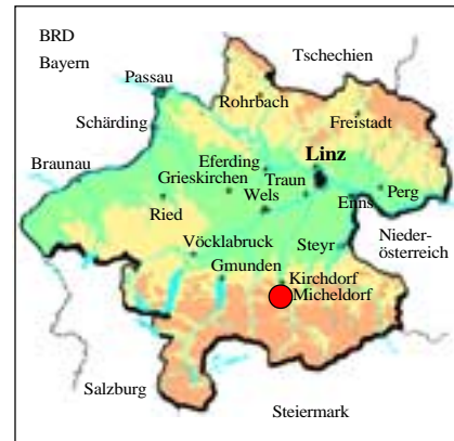
Abb. 1: Lage des Michelberges/Micheldorf in Oberösterreich.

seinen unzähligen, bereits sehr seltenen, unter Naturschutz stehenden Pflanzen zu retten.