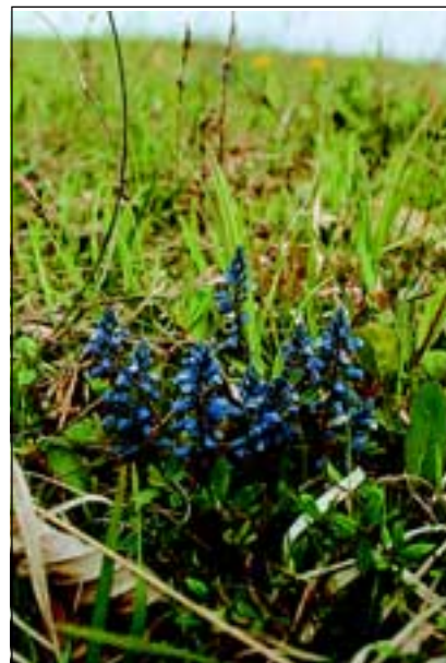
Abb. 8: Die Schopfige Kreuzblume ( Polygala comosa ) kommt in mehreren Farbvarianten vor: von blau bis weiß.