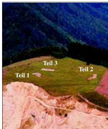
Abb. 21: Lage der 3 Teilstücke, welche von der Himmelreichwiese entnommen wurden.