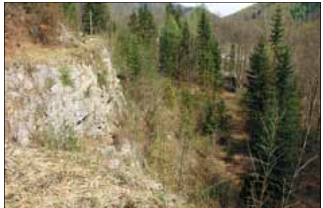
Abb. 7: Blick von der Hochebene zur unteren Etage mit Schutzfelsen, hinter dem die Steinbrucharbeiter bei Sprengungen Deckung suchten.