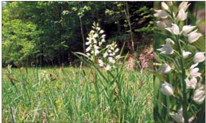
Abb. 27: Das Langblättrige Waldvöglein ( Cephalanthera longifolia L.) findet hier im Kalkmagerrasen einen idealen Lebensraum.