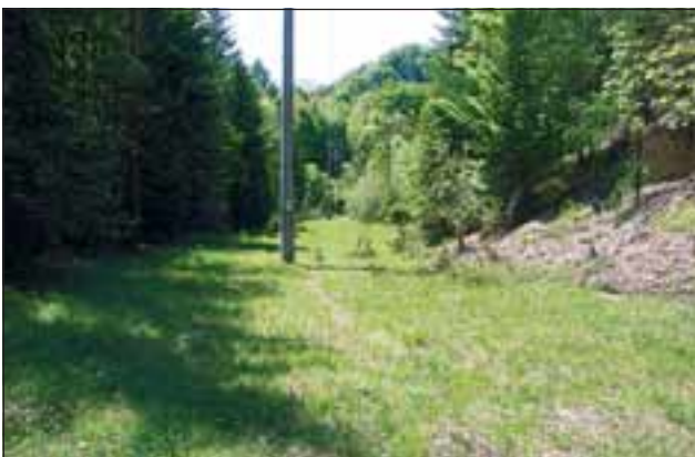
Abb. 10 und 11: Anfang (links) und Ende (rechts) der so genannten Hochebene, die früher Abenteuerplatz für Kinder und Jugendliche war. Heute wird der botanisch interessierte Besucher mit dem Anblick einer großartigen Flora belohnt.