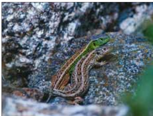
Abb. 33: Die Zauneidechse ( Lacerta agilis ) - unsere häufigste Eidechsenart - hier ein „Pärchen“.