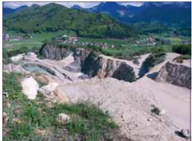
Abb. 37: Blick von der Oberkante des neuen Steinbruchs Richtung Kienberg.

pel in Auffahrtsschleifen, Sukzessionsflächen an Autobahnböschungen, Renaturierungskonzepte nach dem Abbau von Bodenschätzen, Ausgleichszahlungen für den Naturschutz bei Neubau von Hochspannungsleitungen, Ankauf von Biotopen und landwirtschaftlichen Nutzungsflächen und deren „Optimierung“ bei Verkehrs-Neubaustrecken oder am Rande von Industriebetrieben werden uns als ökologische Köder angeboten und es wird mit aufwändigen, oftmals perfiden Berechnungsverfahren und so genannten Biotopbilanzen der Nachweis versucht, dass dem Natur- und Artenschutz eigentlich mit einem Eingriff in den Naturhaushalt am meisten gedient ist.“ (WEINZIERL 1998).