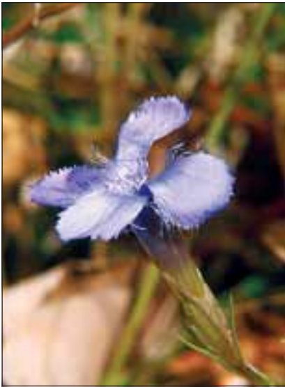
Abb. 25: Der Fransenzian ( Gentiana ciliata L.) ist eine von sechs Enzianarten, die im Kremstal noch zu finden sind.

Sprengungen - Abb. 6) wurde von Efeu überzogen. Die Abraumhalden mit dichtem Gestrüpp und einer Menge Erlen - bereits mehr als armdick - bewachsen.“