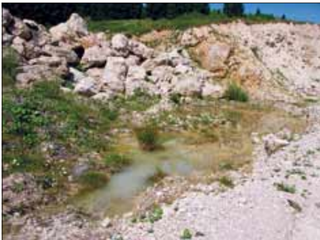
Abb. 36: Unterschiedliche Teillebensräume im neuen Obermicheldorfer Steinbruch.