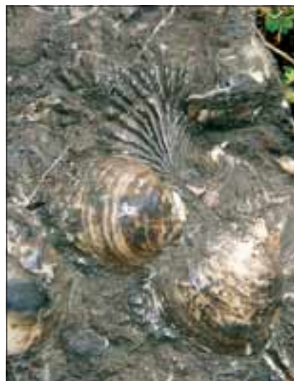
Abb. 18 und 19: Auf den Abraumhalden fanden später noch „Stoasuacha“ (= Steinesucher) viele versteinerte Muscheln und Schnecken wie Omphaloptycha (links) sowie Osters montis Kaprilis (rechts oben) und Schafhautla melingi aus den Lunzer Schichten des Oberen Trias.