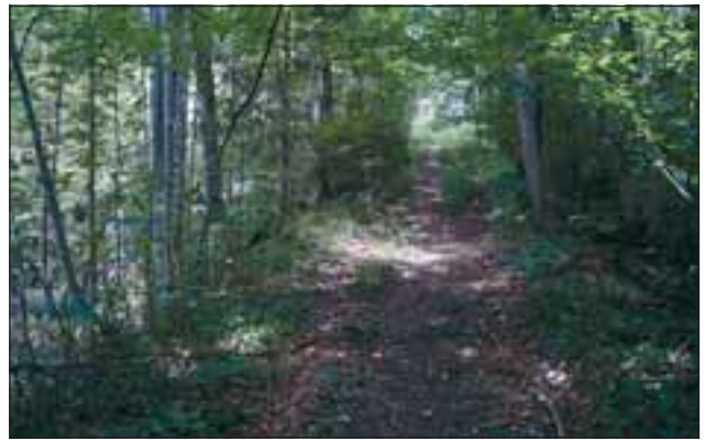
Abb. 5: Steiler Weg von der unteren Etage zur oberen, von der die Kalksteine mit einem Schrägaufzug zur Seilbahn transportiert wurden.