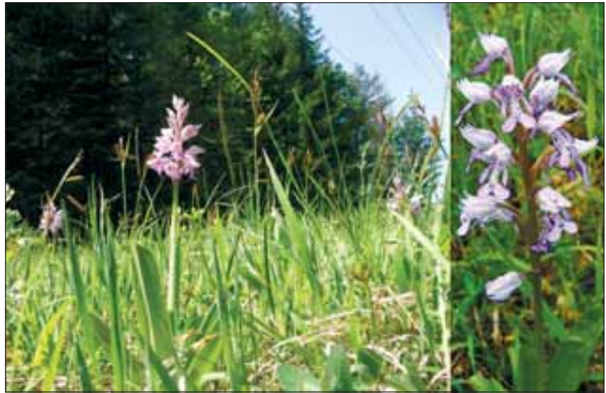
Abb. 26: Das Helmknabenkraut ( Orchis militaris L.) ist seit Mitte der Neunziger-Jahre auf der so genannten Hochebene immer häufiger anzutreffen und bildet kleine Gruppen. Im Gegensatz dazu scheint sein Vorkommen bei der Burg Altpernstein erloschen zu sein.