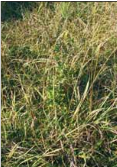
Abb. 28: Neben dem einheimischen Wacholder ( Juniperus communis L.) hat hier auf einem Felsenband ein so genannter Gartenflüchtling, die Cotoneaster , seinen ersten Einwanderungsversuch unternommen. Anscheinend werden die Früchte dieser asiatischen Pflanze nun von unseren einheimischen Vögeln als Nahrung angenommen.

Penibel genau hat Franz Haminger aufgezeichnet, aber nicht wissenschaftlich fundiert, wie er selbst meint. Etwa das Vordringen von Kleinsträuchern wie des Zwergbuchs-Kreuzblümchens ( Polygala chamaebuxus -Abb. 20). Oder das Auftauchen der Fliegenragwurz ( Ophrys insectifera - Abb. 21), im Volksmund „Berg-