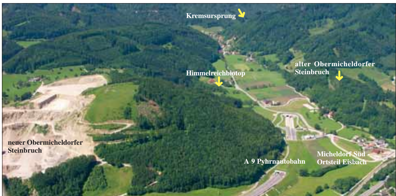
Abb. 39: Das Kreamsursprungtal mit dem neuen Obermicheldorfer Steinbruch auf dem Südosthang des Michelberges (links) und dem verwachsenen alten Obermicheldorfer Steinbruch (rechts) auf dem Ausläufer des Thurnhamberges.

Die Frage nach der gebräuchlicheren Methode dürfte schon einfacher zu beantworten sein. Der Vorrang wirt-