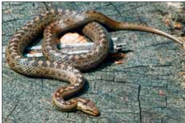
Abb. 31: Die Glattnatter ( Coronella austriaca ) wird häufig mit der Kreuzotter verwechselt und umgebracht.

mandl“ genannt, die 1985 erstmals in wenigen Exemplaren zu bestaunen war. Von Jahr zu Jahr wurden es dann mehr, oft bis zu 30 Stück auf einer relativ kleinen Fläche. Darunter Prachtexemplare bis 25 cm Höhe und mit bis zu 15 Blüten. Sieben Jahre später ging es mit den Bergmandln bergab, die Konkurrenz anderer Pflanzenarten war vermutlich zu stark geworden und 1995 schließlich waren sie verschwunden. Dafür tauchte dann plötzlich das Langblättrige Waldvöglein ( Cephalantera longifolia - Abb. 27) auf.