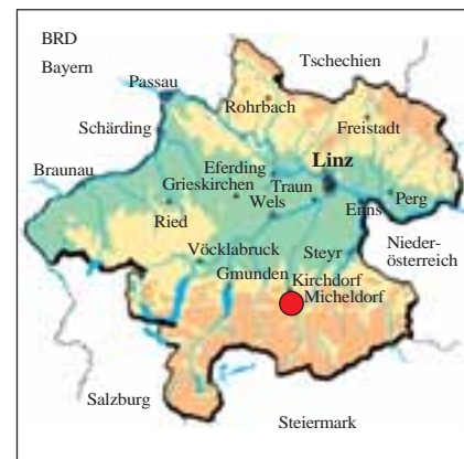
Abb. 1: Lage des Untersuchungsgebietes in Oberösterreich.

auch einer, der viel sieht, der die Natur aufmerksam beobachtet.“ Dann gerät er endgültig ins Schwärmen angesichts der Orchideen, die hier so zahlreich vorkommen wie sonst selten wo.