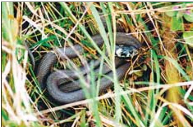
Abb. 30: Die Ringelnatter ( Natrix natrix ) ist nicht unbedingt nur in Wassernähe anzutreffen.