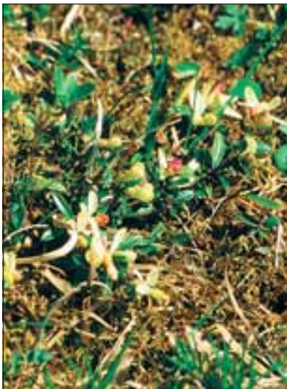
Abb.20: Das Zwergbuchs-Kreuzblümchen ( Polygala chamaebuxus ) ist im zeitigen Frühjahr auch heute noch zu finden.

Später dann, nach dem Krieg, hat Franz Haminger aufgezeichnet, was an Veränderungen in der Natur zu beobachten war. „Die ebenen Flächen waren mit festem Trockenrasen bedeckt, Steinnelke und Ochsenauge blühten um die Wette, in den schattigen Winkeln, wo sich Staunässe hielt, fasten Frühlingsknotenblume und Knabenkräuter Fuß. In die Ritzen und Spalten der Felsen zwängten sich die Wurzeln von Weiden, Birken und Espen. Ein großer, frei stehender Block (ehemals Schutzfelsen bei