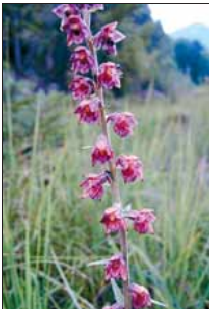
Abb. 22: Hier die Braunrote Stendelwurz ( Epipactis atrorubens ). Weitere Orchideen im alten Steinbruch sind Großes Zweiblatt ( Listera ovata ), Geflecktes Fingerknabenkraut ( Dactylorhiza maculata ) und knapp außerhalb auf dem nördlichen kleinen Steilhang zum Klubhaus der Modellflieger das Stattliche Knabenkraut ( Orchis mascula L.).