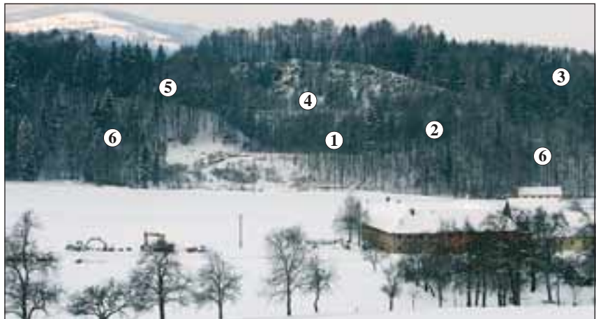
Abb. 12: Die Abbauflächen von der Kremssseite aus. 1 Untere Etage, 2 Trasse für Schrägaufzug (heute Wirtschaftsweg), 3 alte Seilbahntrasse (nun Lichtleitungstrasse), 4 Felsenband zur 5 Hochebene (heute ebenfalls mit Stromleitung), 6 ehemalige Schutthalden.

Doch zurück nach Obermicheldorf. Im Heimatbuch der Marktgemeinde Micheldorf ist nachzulesen, dass