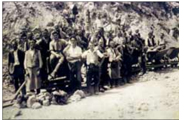
Abb. 16 und 17: Steinbruch-Arbeitergruppen um die Jahrhundertwende 1890/1910 in der Felswand und bei der Lore mit all ihren Arbeitsgeräten zum Abbau des Kalksteins. g u t e r

1887 Adolf Hofmann und Emil von Dierzer eine Gesellschaft zur Errichtung eines Zementwerkes in Kirchdorf gründeten. 1888 erhielten sie eine staatliche Konzession. Sie waren auch die Erbauer der Kremstalbahn (1883) und wollten den Massengüterverkehr auf der Bahn beleben. Anfänglich wurde zur Zementerzeugung oberhalb von Kirchdorf Mergel abgebaut. Das lohnte sich aber nur zwei Jahre. Anschließend kauften sie das Humsenbauerngut in Obermicheldorf und begannen mit dem Abbau des Opponitzer Kalkes. Dieser Betrieb überdauerte immerhin beinahe 40 Jahre. Als der begehrte Kalkstein immer weniger wurde und der Anteil von Dolomit immer größer, wurde er aufgelassen. Das war 1928. Seither ist es hier ruhig geworden, wenn man von der einstigen Betriebsamkeit und dem Lärm ausgeht, der mit dem Abbau von Kalk verbunden ist. Der Konkurrenzkampf um die besten Plätze