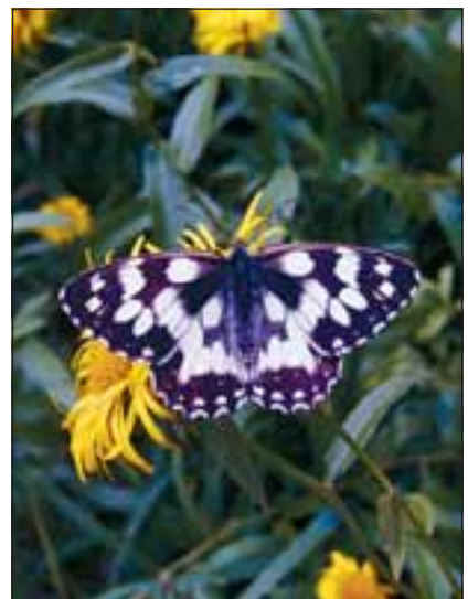
Abb. 23 und 24: Neben dem Kaisermantel (oben) und Schachbrett (unten) hier auf einem Alant sind noch viele Schmetterlingsarten wie zum Beispiel Landkärtchen, Waldportier, Admiral, Schwalbenschwanz, Kleiner Fuchs uvm. zu sehen.