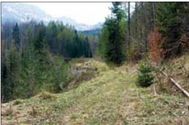
Abb. 8 und 9: Der Weg über das Felsband zur Hochebene, auf dem allerlei seltene Pflanzen zu finden sind.