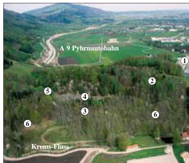
Abb. 2 (links, Orthofoto der Oö.Landesregierung 1995) und 3 (rechts, Luftaufnahme 30. April 2005, W. B e j v l): 1 Betriebsgelände der Fa. Maba (Schleuderbetonwerk), 2 alte Seilbahntrasse, 3 Untere Etage, 4 Felsenband zur 5 Hochebene, 6 Schutthalden.