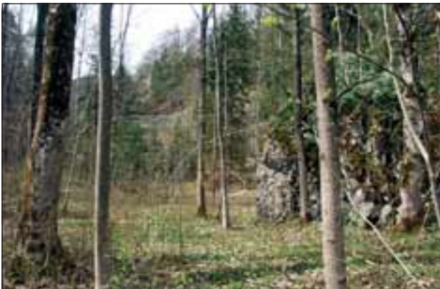
Abb. 6: Untere Etage mit Schutzfelsen bei Sprengungen. Im Hintergrund das Felsband Richtung Hochebene.