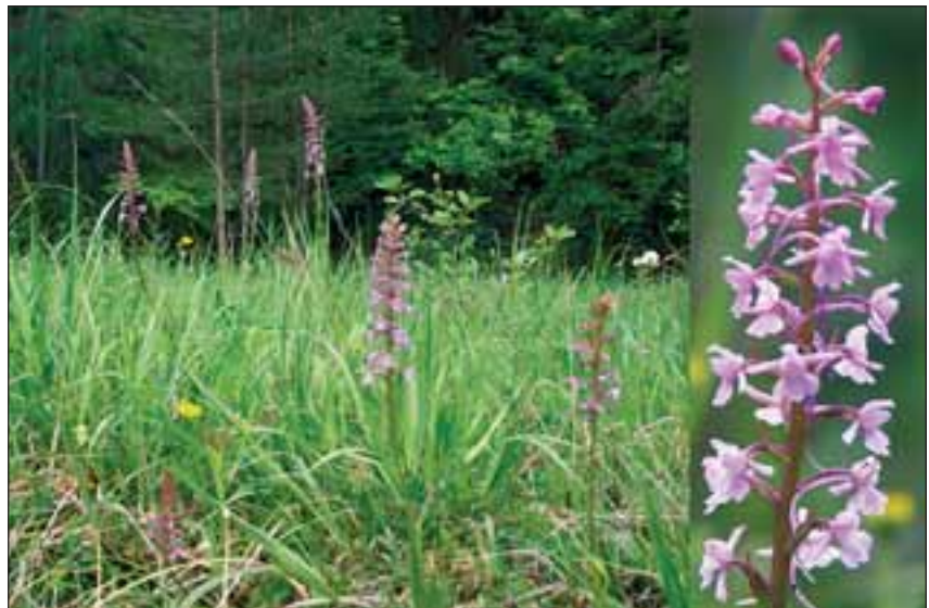
Abb. 29: Die Große Händelwurz ( Gymnadenia conopsea L.) hat schon vor Jahren die Fliegenragwurz abgelöst. All diese wunderschönen Orchideen können an den Waldrändern hier im Kremstal noch entdeckt werden.