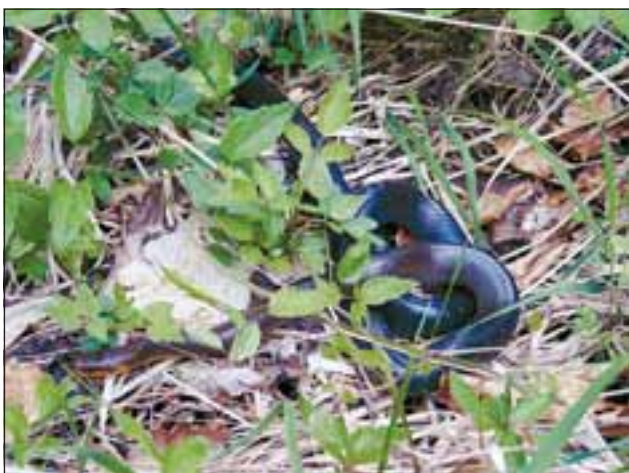
Abb. 32: Die Äskulapnatter ( Elaphe longissima ) ist mit einer Länge von rund 2 Metern eine der größten Schlangen Europas.

In der Naturschutzdiskussion hören wir heute oft das Schlagwort vom Schützen durch Nützen. Geboren aus der Erkenntnis, dass Schutzgebiete