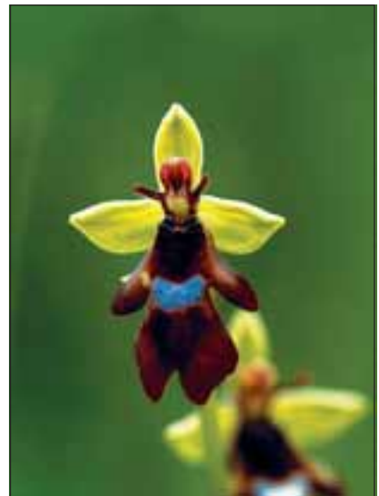
Abb.21: Ein typisches „Bergmandl“, die Fliegenragwurz ( Ophris insectifera ).