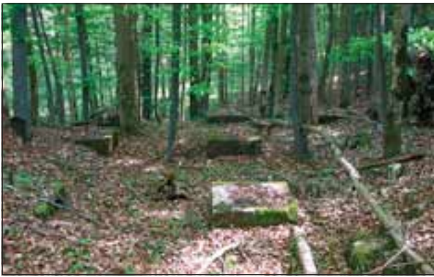
Abb. 4: Fundamentreste der ehemaligen Seilbahn vom Steinbruch zur Verarbeitungsstelle.